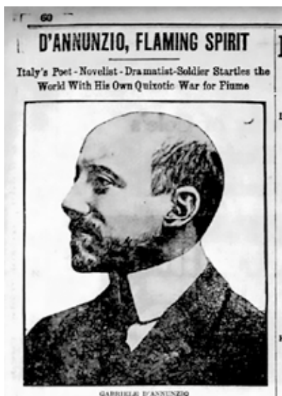
Prilog 4: The Boston Globe , “D'Annunzio, Flaming Spirit,” 21. rujna 1919., str. 60

D'Annunzijevo riječki eksperiment također je bio zanimljiv čitateljima u Sjedinjenim Američkim Državama, budući da su brojni članci objavljeni u svim glavnim novinama, a zatim ponovno tiskani u stotinama lokalnih novina diljem zemlje. S obzirom na to da strani čitatelji nisu bili toliko emocionalno vezani za potencijalne teritorijalne promjene ili unutarnje političke rasprave, članci u američkom tisku često su se fokusirali na lik samog D'Annunzija, često objavljujući dramatične fotografije ili izvještavajući o njegovim brojnim ljubavnicama. Talijansko-američke zajednice s nestrpljenjem su pratile vijesti o D'Annunziju. Čak su bile i domaćini raznih događaja koji su pokazali njihovu potporu njegovom hrabrom osvajanju Rijeke.