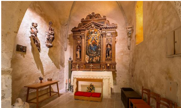
(Slika 4:)

stoljeća iz vremena benediktinaca. Kapela je dograđena kasnije kao zavjetna kapela jednoj obitelji, a crkva je korištena kao grobljanska kapela.