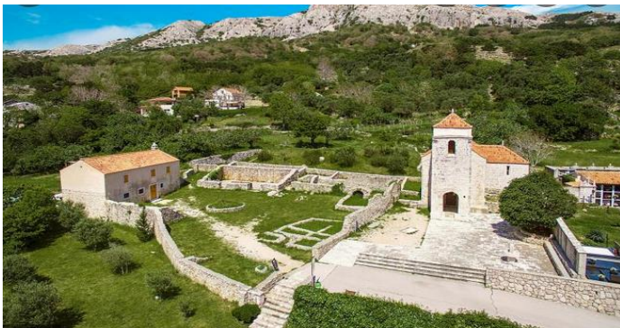
(Slika 8: Preuzeto: https://www.info-krk.com )

Godina 2000. posebna je po tome što je tada Bašćanska ploča proslavila svoju 900-tu obljetnicu te je tada kompleks opatije Svete Lucije uređen kao informacijsko-muzejsko središte.