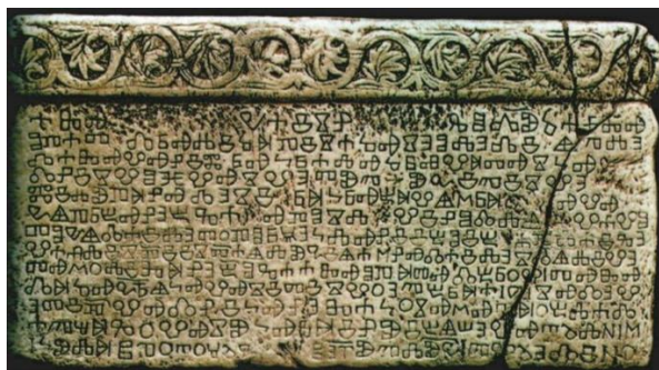
(Slika 5: preuzeto: Staroslavenski institut: https://stin.hr/glagoljica/ )

Nikada kasnije nije nađena cjelovita veća, u kamenu glagoljicom uklesana, ploča od ove ( Senjska ploča 87 je zapravo bila većih dimenzija, ali nije sačuvana u cijelosti). Mnogo je stotina natpisa opisano i otkriveno, ali su kraći jer je bilo teško klesati u kamenu. Često se mogu primijetiti u kamenu uklesani natpisi, ali su to najčešće kratki natpisi od najviše nekoliko riječi. U njima se bilježilo kada je nešto građeno, godina i nekoliko riječi ili nadgrobni natpisi, ploče ili slično.