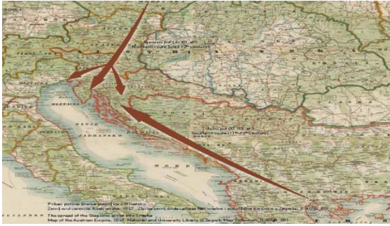
(Slika 1: preuzeto: Nacionalna i sveučilišna knjižnica u Zagrebu: https://www.nsk.hr/ )