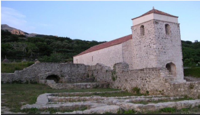
(Slika 3: preuzeto: Staroslavenski institut: https://stin.hr/glagoljica/ )

Sačuvana, jednobrodna crkva iz ranoromaničkoga razdoblja (crkva Svete Lucije), sagrađena je najvjerojatnije na prijelazu iz 11. u 12. stoljeće, točnije oko 1100. godine. 51