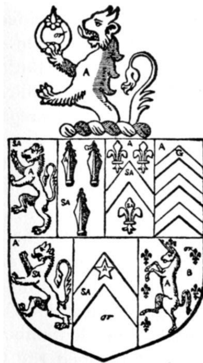
Prilog 1. Grb obitelji Cromwell