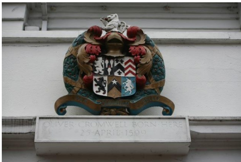
Prilog 2. Grb obitelji Cromwell iznad rodne kuće Olivera Cromwella

Štit grba obitelji Cromwell je starofrancuski štit koji se sastoji od nekoliko manjih grbova. U desnom gornjem kutu je vidimo uspravno prikazanog lava u srebrnoj kovini sa istaknutim jezikom i pandžama u crvenoj tinkturi na pozadini od crne tinkture. Ako krenemo prema glavi štita, s desne strane nalazimo tri šiljka od koplja u srebrnoj kovini s istaknutim vrhovima u crvenoj tinkturi na pozadini od crne tinkture. Zatim, na lijevoj strani glave štita