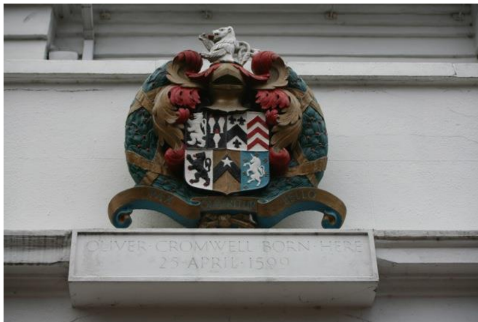
Prilog 2. Grb obitelji Cromwell iznad rodne kuće Olivera Cromwella

Štit grba obitelji Cromwell je starofrancuski štit koji se sastoji od nekoliko manjih grbova. U desnom gornjem kutu je vidimo uspravno prikazanog lava u srebrnoj kovini sa istaknutim jezikom i pandžama u crvenoj tinkturi na pozadini od crne tinkture. Ako krenemo prema glavi štita, s desne strane nalazimo tri šiljka od koplja u srebrnoj kovini s istaknutim vrhovima u crvenoj tinkturi na pozadini od crne tinkture. Zatim, na lijevoj strani glave štita