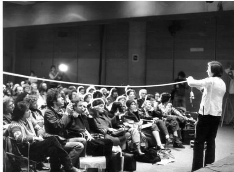
Slika 4. Hervé Fischer, Povijest umjetnosti je završila , 1979. Centre Pompidou, Pariz

povijesti, ali se bojava da ju ne nastavlja. Svoju refleksiju započinje anegdotom o slikaru Hervéu Fischeru koji je 1979. performansom u Parizu proglasio umjetnost mrtvom ( Slika 4. ). Fischer u Centre Pompidou svojevremeno pred publikom reže dugačku nit provučenu kroz prostoriju i tvrdi da je to zadnji čin povijesti umjetnosti. Njegovo metaforičko prekidanje tradicionalne lente vremena bio je oblik teorije o kraju umjetnosti, teorije prema kojoj živimo u doba 'postpovijesne' umjetnosti. 19