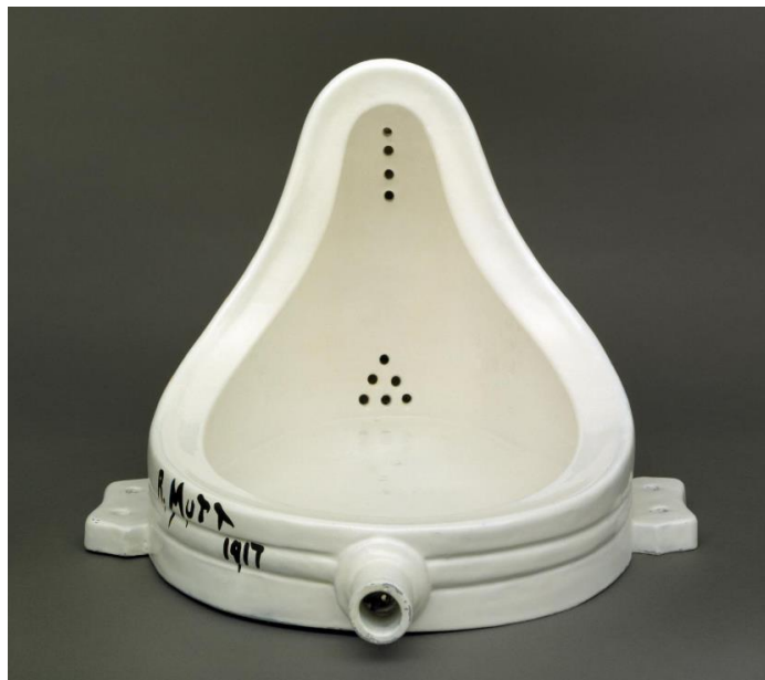
Slika 3. Marcel Duchamp, Fontana , 1917. (replika iz 1964.) Tate, London

njihova estetska vrijednost više nije razlog zašto ih stavljamo u muzeje i galerije. Ona su važna zbog svog povijesnog, kulturnog i filozofskog značaja. Kao što Dominic McIver Lopes uočava, primamljivo je tražiti estetsku vrijednost u sjajnom porculanu Duchampove Fontane (Slika 3.), ali to nije svrha tog umjetničkog djela. 13 Duchampov pisoar nije bitan jer je lijep, već zato što ispituje granice umjetnosti. Sam umjetnik je kritizirao besmislenu potragu za ljepotom u njegovom stvaralaštvu kada je rekao “bacio sam im sušilo za boce i pisoar u lica kao izazov, a sada se dive njihovoj estetskoj ljepoti”. 14 Moderna umjetnost se ne trudi biti lijepa jer je preokupirana traženjem svoje granice. Kada promatrač u galeriji vidi umjetninu poput Duchampove Fontane i zapita se zašto je to umjetnost ili pomisli da bi takvo nešto svatko mogao učiniti, to je upravo reakcija koja se od njega očekuje.