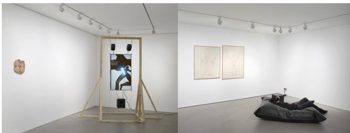
Slika 7. Sidsel Meineche Hansen, Second Sex War , 2016.

Sidsel Meineche Hansen 2016. u Londonu osmišlja izložbu Second Sex War , u čije središte stavlja pornografsku 3D animaciju ženskog lika s kojim promatrač može ući u interakciju koristeći VR naočale (Slika 7.). Tim likom, kojeg naziva Eva v3.0 , Hansen ukazuje na etičke i društvene posljedice virtualne pornografije, pitajući se pomiču li se granice morala kada utječemo na virtualno tijelo umjesto na fizičko. Zašto interakcija s hiperseksualiziranim, realističnim ženskim likom u virtualnoj stvarnosti u promatraču ne izaziva jednaku nelagodu kao interakcija sa stvarnom osobom? Koje su posljedice činjenice da je u današnjem društvu sve lakše stvoriti seksualnog roba sasvim nalik stvarnoj osobi, ali bez moralnih obveza koje dugujemo živom biću? 35