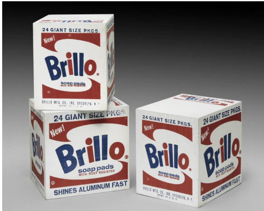
Slika 5. Andy Warhol, Brillo kutije , 1964. Philadelphia Museum of Art, Pennsylvania

Ideju da umjetnost staje tamo gdje filozofija o umjetnosti počinje Danto preuzima od Hegela koji u 19. stoljeću nudi alternativu ranije spomenutom Vasarijevom gledištu koje tada još uvijek dominira umjetničkim institucijama. 21 Vasari je također vjerovao da umjetnost ima svojevrsan kraj, odnosno da postoji problem kojeg umjetnost mora riješiti. Za njega je taj problem bio postići potpuni mimezis, a umjetnost je prema tome došla kraju već nakon nenadmašnih postignuća Michelangela. Hegel, a nakon njega i Danto, reći će da je konačni cilj umjetnosti filozofija. Jednom kada je umjetnost uspješno počela postavljati pitanja o vlastitoj definiciji, njen cilj je ispunjen i ona dolazi kraju. To naravno ne znači da se umjetnost više neće proizvoditi niti da se o njoj više neće pisati. Umjetnosti zasigurno ima više nego ikada, a moguće interpretacije pojedinačnih djela su nebrojive. Međutim, Danto će reći da težnja za postepenim dostizanjem određenog cilja koja je prije bila vidljiva više ne postoji te da je u umjetnosti već učinjeno sve što je moglo biti značajno za njenu povijest. 22 Dantovim riječima, “sve dok taj oblik pitanja nije proizašao iz umjetnosti, filozofija nije imala moć da ih postavi, a jednom kada su postavljena, umjetnost nema moć da ih riješi”. 23