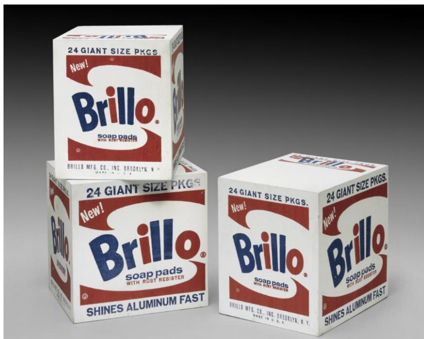
Slika 5. Andy Warhol, Brillo kutije , 1964. Philadelphia Museum of Art, Pennsylvania

Ideju da umjetnost staje tamo gdje filozofija o umjetnosti počinje Danto preuzima od Hegela koji u 19. stoljeću nudi alternativu ranije spomenutom Vasarijevom gledištu koje tada još uvijek dominira umjetničkim institucijama. 21 Vasari je također vjerovao da umjetnost ima svojevrsan kraj, odnosno da postoji problem kojeg umjetnost mora riješiti. Za njega je taj problem bio postići potpuni mimezis, a umjetnost je prema tome došla kraju već nakon nenadmašnih postignuća Michelangela. Hegel, a nakon njega i Danto, reći će da je konačni cilj umjetnosti filozofija. Jednom kada je umjetnost uspješno počela postavljati pitanja o vlastitoj definiciji, njen cilj je ispunjen i ona dolazi kraju. To naravno ne znači da se umjetnost više neće proizvoditi niti da se o njoj više neće pisati. Umjetnosti zasigurno ima više nego ikada, a moguće interpretacije pojedinačnih djela su nebrojive. Međutim, Danto će reći da težnja za postepenim dostizanjem određenog cilja koja je prije bila vidljiva više ne postoji te da je u umjetnosti već učinjeno sve što je moglo biti značajno za njenu povijest. 22 Dantovim riječima, “sve dok taj oblik pitanja nije proizašao iz umjetnosti, filozofija nije imala moć da ih postavi, a jednom kada su postavljena, umjetnost nema moć da ih riješi”. 23