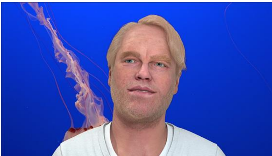
Slika 6. Cécile B. Evans, Hyperlinks or it Didn't Happen (isječak iz videa), 2014.

Cécile B. Evans 2014. stvara Hyperlinks or it Didn't Happen , video instalaciju u kojoj računalno generirana slika pokojnog glumca Philipa Seymoura Hoffmana vodi promatrača kroz potragu za značenjem postojanja jednog digitalnog bića (Slika 6.). Ideja iza ovog rada je ta da je razvoj računalne tehnologije entitetima kao što su CGI slike, hologrami ili botovi (samostalni računalni programi) dao nešto vrlo slično životu. Umjetnica postavlja pitanja o tome što to znači biti materijalno biće i imati svijest u doba umjetne inteligencije koja sve bolje i bolje oponaša stvarnost. 34