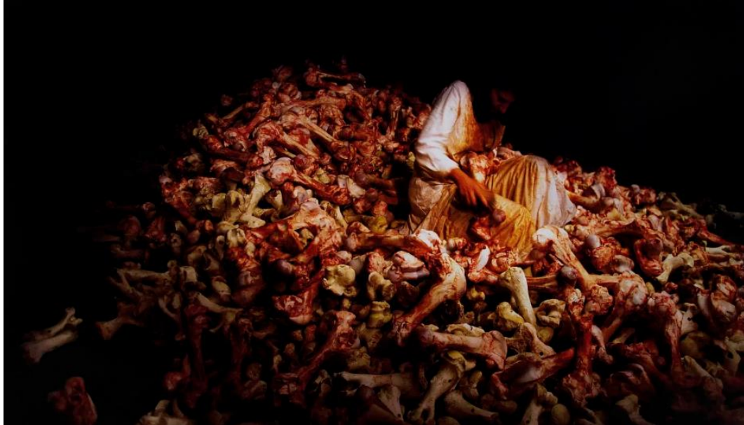
Slika 2. Marina Abramović, Balkanski Barok , 1997. Venecijanski bijenale

od preko četiri minute potpune tišine. Film Empire kojeg desetak godina kasnije stvara Andy Warhol je usporena snimka nepomičnog kadra Empire State Buildinga koja traje preko osam sati. Zašto su umjetnici počeli stvarati umjetnost koja je namjerno ružna, banalna ili dosadna? 10