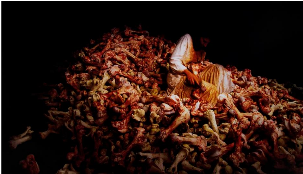
Slika 2. Marina Abramović, Balkanski Barok , 1997. Venecijanski bijenale

od preko četiri minute potpune tišine. Film Empire kojeg desetak godina kasnije stvara Andy Warhol je usporena snimka nepomičnog kadra Empire State Buildinga koja traje preko osam sati. Zašto su umjetnici počeli stvarati umjetnost koja je namjerno ružna, banalna ili dosadna? 10