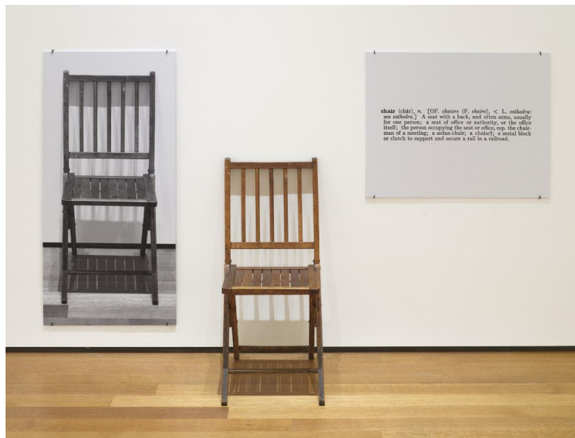
Slika 10. Joseph Kosuth, Jedna i tri stolice , 1965. MoMA, New York

vrijednost nije ni nužan ni dovoljan uvjet da bi neko umjetničko djelo bilo dobro. Ovo će gledište Goldie i Schellekens nazvati 'kontra-estetikom' jer se njime ne tvrdi samo da umjetnost može postojati i bez estetike, već da estetika samo odvraća pažnju od onoga što je zbilja bitno u svakoj umjetnosti, a to je ideja. 72 Već će time konceptualna umjetnost izgubiti poštovanje onih koji smatraju da se umjetnost koja nije lijepa udaljava od jedinog pravog cilja umjetničkog djelovanja. 73 No možda još veći problem za konceptualnu umjetnost je taj da u njoj nedostaje emocionalne povezanosti promatrača s djelom, onih istih dubokih emocija prema umjetnosti koje su inspirirale cijeli ovaj rad. Da, konceptualna umjetnost ima kognitivnu vrijednost i često postavlja zanimljiva filozofska pitanja, ali je li to nešto za što ćemo se vezati? Intelektualna vrijednost koju konceptualna umjetnost ima čini je legitimnim oblikom umjetnosti, ali čini se da nije dovoljna da bi je ljudi voljeli .