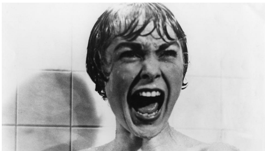
Slika 8. Alfred Hitchcock, Psiho , 1960. (isječak iz filma)

humoristične serije nećemo svrstati u istu kategoriju kao naprimjer Građanina Kanea , iako obje proizlaze iz istog medija narativne umjetnosti. Uistinu, ova je distinkcija utoliko više kontradiktorna kada se sjetimo da iz masovne umjetnosti isto mogu proizaći remek djela koja ćemo smatrati vrhuncima naše kulture. Zamislimo scenu tuširanja iz Hitchcockovog Psiha (Slika 8.). Nije li to ikonička slika koja je uzrokovala kulturnu revoluciju i koja je zaslužna za razvoj cijelog jednog novog žanra u filmskom stvaralaštvu? 50 To je sigurno umjetničko djelo, i to jedno koje je nedvojbeno vrijedno u društvu i kulturi, a očito je da je nastalo s ciljem da bude popularno, masovno proizvedeno i da se što bolje prodaje. Granice niske i visoke kulture u nekim su područjima jako nejasne. Ako su granice između popularne umjetnosti i ‘prave’, vrijedne umjetnosti toliko nejasne da jedno djelo može spadati u obje kategorije, ima li smisla da tu podjelu i dalje radimo?