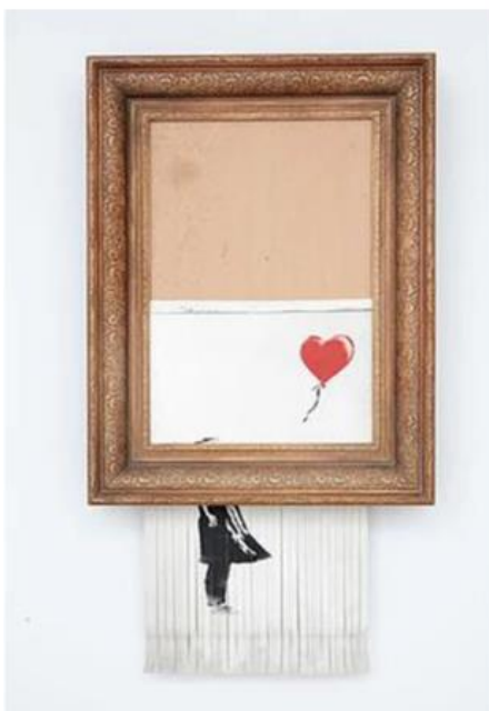
Slika 4. Banksy, Ljubav je u kanti za smeće , 2006. - 2018., Privatno vlasništvo

Riječ je o radu koji se, za vrijeme aukcije i to upravo njegove prodaje za 1.4 milijuna dolara, samouništava, točnije, želi se samouništiti čime akciju možemo označiti efemernom u svojoj intenciji. Djevojka s balonom verzija je Banksyjevog istoimenog grafita izvedena kao akril na platnu, koji je na dražbu pristigao s okvirom također izrađenim od strane autora. Kasnije je na službenim društvenim mrežama autora prikazan video instaliranja rezača za papir u okvir. Rezač, koji je u probnoj fazi svaki puta razrezao djelo u jednake okomite trake tako ga uništavajući, na dražbi je zablokirao i djelo izrezao samo do polovice. Banksy je ovom umjetničkom intervencijom, koju je kasnije na svojim društvenim mrežama popratio Picassovim citatom „nagon za uništavanjem, također je kreativni nagon“, pokazao spektakličnost društva u kojem živimo. Novom je, napola uništenom djelu Ljubav je u kanti za smeće vrijednost porasla te je 2021. godine prodano za 25.4 milijuna dolara. 61 Rad se može čitati u ključu akcije koja subverzira establišment, kao kritika konzumerizma, robne vrijednosti svega pa tako i umjetnosti, kojoj se cijena ironično povećava upravo spektakličnim uništavanjem djela u momentu njegove kupnje.