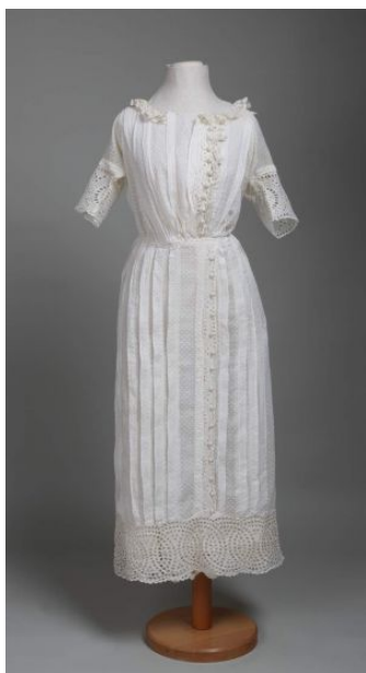
Prilog 11. haljina, oko 1915. g.(Zagreb), vezivo, čipka, markežit, Muzej za umjetnost i obrt, Zagreb ( https://repozitorij.muo.hr/?pr=i&id=36269 preuzeto 3. kolovoza 2022.)