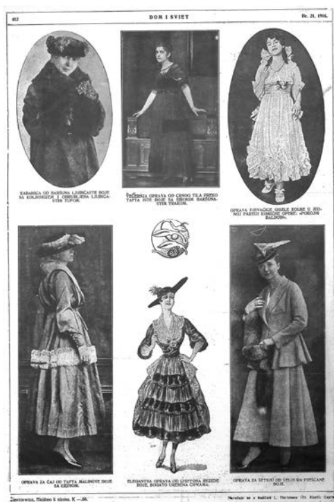
Prilog 12. Dom i svijet , 21. broj, 1916.(1. studenog 1916.), str. 412.

Kao što sam već napomenuo, haljine su prvenstveno bile osnovna odjeća žena srednje i više klase. Kada je riječ o nižim klasama i seljankama, one si u pravilu nisu mogle priuštiti haljinu. Međutim, postojali su rijetki slučajevi gdje su si žene iz bogatijih seoskih sredina