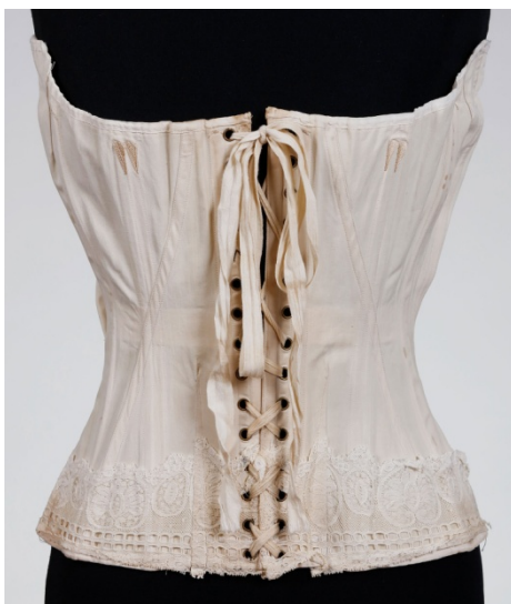
Prilog 1. steznik , oko 1910., pamučno platno, čipka, vez svilenim koncem, kovina 50 x 33 cm, Gradski muzej Varaždin, Varaždin ( https://www.gmv.hr/ops/index.html preuzeto 3. kolovoza 2022.)

Na prijelazu iz 19. u 20. stoljeće razvija se modna silueta u obliku slova S koju karakterizira vrlo uzak struk, gornji dio tijela nagnut prema naprijed i donji dio tijela pomaknut prema nazad uz opasnost za gubljenje ravnoteže. 23 Razvoj S linije tijela omogućen je zahvaljujući novom tipu korzeta koji se nazivao sans ventre . Za razliku od prethodnih korzeta ovaj nije pružao potporu za grudi već su bile opuštene i naglašene oblikujući prepoznatljiva takozvana golublja prsa . 24 S linija tijela bila je sastavni dio takozvanog gibson izgleda temeljenog na izgledima glumica i plesačica. Pojava S linije tijela na hrvatskim prostorima povezuje se s pojavom secesije kao umjetničkog pravca 1897. godine. 25 Ono što povezuje secesiju i S liniju tijela je vitičasta, organska i zavijena forma. Čini se da kada je riječ o prostoru Banske Hrvatske ova S silueta kasni nekoliko godina u odnosu na inozemstvo. Kašnjenje S siluete primjerice u Zagrebu u odnosu na primjerice Pariz rezultat je i samih zagrebačkih dama koje su bile suzdržane prema novim i ekstremnim promjenama pa su stoga odabirale blaže verzije. Iako sa zakašnjenjem S silueta je u Zagrebu zaživjela oko 1906.