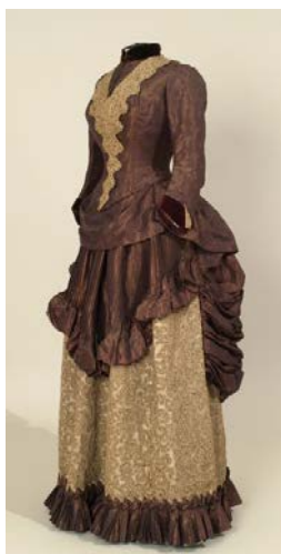
Prilog 6. Haljina , oko 1880. g.(Beč), čipka, atlas, taft, Muzej za umjetnost i obrt, Zagreb ( https://repozitorij.muo.hr/?pr=v.iiif.a&id=35274 preuzeto 3. kolovoza 2022.)

Krajem 1880-ih godina moda pariške stražnjice dolazi kraju. Haljine postaju jednostavne, a fokus prelazi na rukave. 67 Tako se 1890-ih godina javljaju leg o' mutton ili janjeći but rukavi velikog volumena u kombinaciji sa suknjama A kroja. Trend se gotovo istovremeno javlja i u inozemstvu i u Zagrebu. Pritom domaći tisak donosi nešto blaže i konzervativnije prikaze predimenzioniranih rukava u odnosu na inozemstvo. To je zasigurno i razlog zbog čega su Zagrepčanke brzo prihvatile ovaj trend (vidi prilog 7.). Prema samom kraju 19. stoljeća rukavi se sve više smanjuju i naposljetku izlaze iz mode.