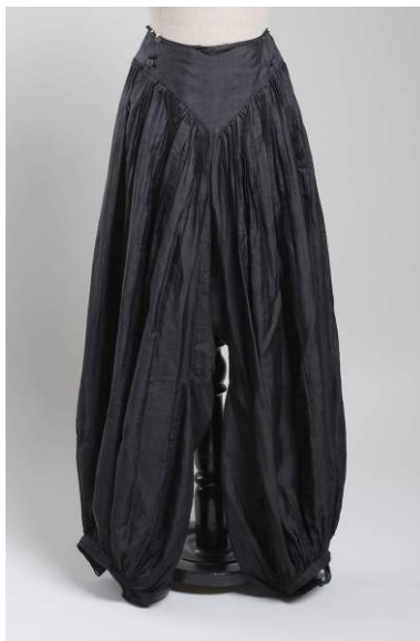
Prilog 16. pumperice : hlače za sport, oko 1900. godine, svila, Muzej za umjetnost i obrt, Zagreb ( https://digital.arhivpro.hr/muo2/?vdoc=840 preuzeto 3. kolovoza 2022.)

kupiti kod modnog krojača Josipa Pesta. 106 Hlače (vidi prilog 16.), poznate i kao pumperice 107 , u pravilu su bile tamnih boja kao i ostatak odjevne kombinacije za vožnju biciklom. 108 U časopisu Parižka moda se već 1895. godine navodi da biciklistkinje ili „Koturaškinje biraju dimije...“. 109 Već iduće godine Parižka moda donosi čitateljicama i izgled tih novih odjevnih oblika 110 . Prikazi biciklistkinja s hlačama u Parižkoj modi se u početku javljaju rijetko i pritom se naglašava da se svako žensko odijelo može prilagoditi da postane biciklističko. Kasnije se odijela za sportove pojavljuju puno češće zahvaljujući zalaganju urednica. 111 Uz slike hlača su dolazile upute za kroj i šivanje tako da su si ih žene i same mogle izraditi. Hlače su se, kao i suknje, često izrađivale od plisirano ili naboranog materijala. Čini se da se žene nisu baš često fotografirale s hlačama jer se zasigurno nisu smatrale svečanim odjevnim predmetom.