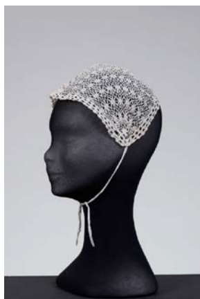
Prilog 19. kapica , početak 20. stoljeća, rukom rađena čipka, promjer 26 cm, Gradski muzej Varaždin, Varaždin ( https://www.gmv.hr/ops/index.html preuzeto 4. kolovoza 2022.)