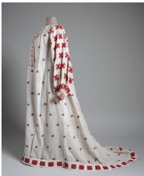
Prilog 10. Bela Čikoš-Sesija, Haljina s narodnim vezom , 1905.-1910. g.(Industrija Berger), vezivo, lanena tkanina, pamučni vez, Muzej za umjetnost i obrt, Zagreb ( https://repozitorij.muio.hr/?pr=i&id=49932 preuzeto 3. kolovoza 2022.)

Početak Prvog svjetskog rata (1914.-1918.) ponovno se popularizira ženstvena linija. Tako haljine u struku ponovno postaju uske kako bi se istaknule grudi i bokovi. Same suknje haljina postaju kraće i sežu iznad gležnja. 79 Uske suknje zamjenjuju šire ljevkastog oblika. Haljine u to vrijeme zbog rata počinju sve više sličiti na sportska odijela, radničke i vojničke, kao i odjeće za medicinske sestre. Zbog ratne bijede moda se našla na udaru kritika zbog cijena koje unatoč svemu ostaju visoke. Haljine su u to vrijeme jednostavnog kroja s rascvjetalim suknjama. Izrađivane su od laganih materijala i dekorirane čipkom ili nekim drugim decentnim ukrasom. Po pitanju boja dominira bijela ili druge svijetle boje (vidi prilog 11.). Izgled ovakvih novih haljina donosi se i u novinama Dom i svijet (vidi prilog 12.). Međutim čini se da žene u Banskoj Hrvatskoj ipak zbog ratne bijede i visokih cijena odabiru vrlo jednostavne oblike. 80