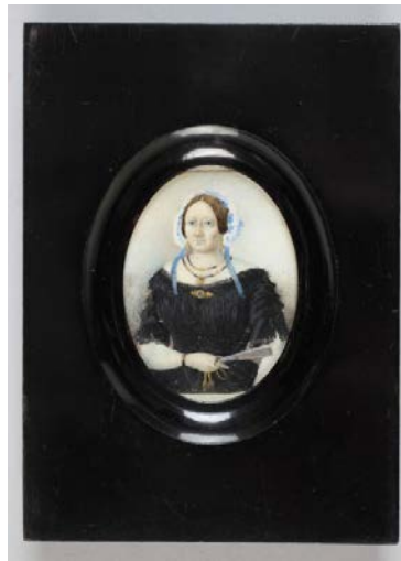
Prilog 18. nepoznati autor, Portret grofice Schafkotsch , oko 1840. g., akvarel na bjelokosti, 6 x 4,9 cm, Muzej za umjetnost i obrt, Zagreb ( http://athena.muio.hr/?object=view&id=27497 preuzeto 4. kolovoza 2022.)

Pokrivala za glavu su bila neizostavan odjevni predmet žena kako viših tako i nižih slojeva. Nosila su se iz više različitih razloga; u većini slučajeva zbog vremenskih uvjeta, ali i kao statusni simbol ili odraz nacionalne ili vjerske pripadnosti. 116 Dapače, društvene norme tog razdoblja zahtijevale su od žena da ni pod koju cijenu ne napuštaju dom bez šešira. 117 1840-ih dolazi do redukcije dimenzije šešira do te mjere da su zapravo svedeni na kapicu koja se vezala pod bradom i koja je najčešće imala čipkasti rub (vidi prilog 18.).