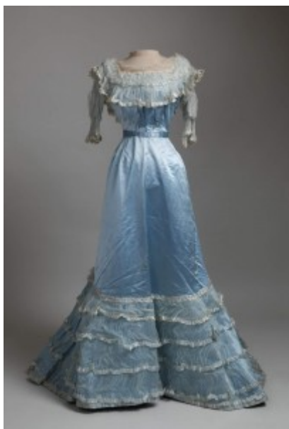
Prilog 8. Haljina , oko 1900. g.(Hrvatska), atlas, voile, Muzej za umjetnost i obrt, Zagreb ( https://repositorij.muo.hr/?pr=i&id=36741 preuzeto 3. kolovoza 2022.)

Krajem 19. stoljeća se nasuprot haljinama S linije počinju razvijati reform-haljine ili reformirane haljine kojima su glavni aduti bili funkcionalnost, praktičnost, kvaliteta, oslobođenost od korzeta i uporaba novih tekstila. Takve haljine imale su visok struk, bile su opuštenog drapiranog kroja koji nije sputavao tijelo, a boje, materijali i ornament su bili prirodni. Pritom su postojali različiti tipovi i podtipovi reformiranih haljina poput artistic dress , aesthetic dress i reformkleid . Ovakve haljine nastaju u umjetničkim krugovima koji su podržavali borbu za ženska prava kao i zdravstvenu reformu. Iako su bile promovirane na mnogo načina, reformirane haljine nisu doživjele veliku popularnost jer su žene ostajale vjerne silueti uskog struka s korzetom. Popularnost ovih haljina raste kada su ih žene počinju nositi s korzetima, što je bilo kontradiktorno jer time te haljine gube svoj izvorni cilj. Kao što sam već spomenuo, u periodu od 1902. do 1908. godine na haljinama se S silueta ublažava i kombinira s elementima empire haljina. Ovakav prijelazni oblik haljina je prihvaćen, ali također uz kompromis, a to je da se i dalje uz njih nosio korzet. Ovakve haljine također nisu bile popularne. Časopisi poput Pariške mode donose čitav spektar reformiranih haljina, ali većina tih oblika nije zaživjela na području Banske Hrvatske. Tome je pridonosila i činjenica su reformirane haljine često bile promatrane kao anti-modni element što je kod žena stvaralo