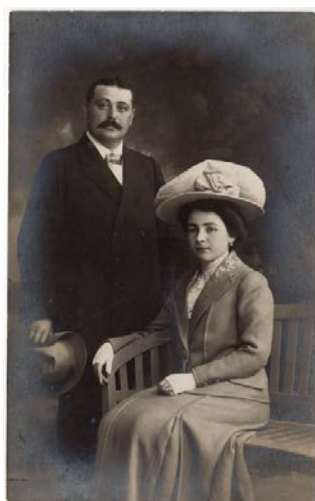
Prilog 13. nepoznati autor, Bračni par , oko 1915., crno-bijela fotografija, 13,8 x 8,6 cm, Muzej za umjetnost i obrt, Zagreb ( http://athena.muio.hr/?object=view&id=54107 preuzeto 3. kolovoza 2022. )

Novi tip ženskog odjevnog predmeta: žensko odijelo (vidi prilog 13.) ili „Tailleur kostim“ kako ga se naziva u časopisu Parižka moda javlja se tijekom 1880-ih godina u Engleskoj. Oblikovano je direktno po uzoru na muško odijelo i odijela za sportske aktivnosti poput jahanja. 84 Nastaje zahvaljujući ženskom pokretu koji ciljano uvodi elemente muške odjeće u žensku radi isticanja važnosti emancipacije, ali i radi bunta i provokacije.