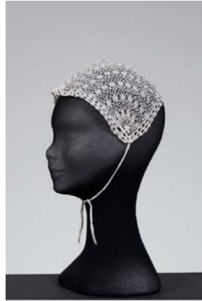
Prilog 19. kapica , početak 20. stoljeća, rukom rađena čipka, promjer 26 cm, Gradski muzej Varaždin, Varaždin