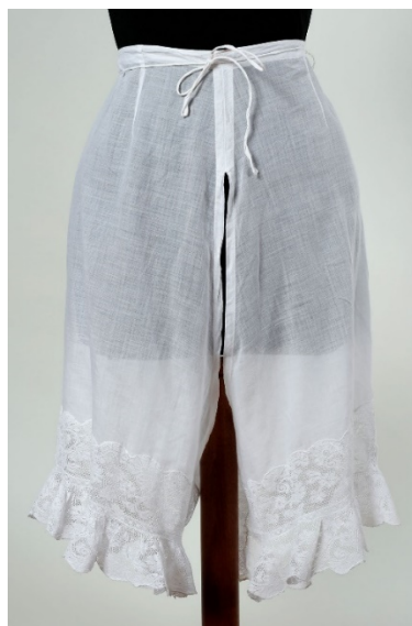
Prilog 17. Ženske gaće , druga polovina 19. stoljeća, batist, strojna čipka, 63 x 43 cm, Gradski muzej Varaždin, Varaždin ( https://www.gmv.hr/ops/index.html preuzeto 4. kolovoza 2022.)

Ženskim hlačama su vrlo bliske ženske gaće koje su bile u obliku hlača pa se stoga u nekim slučajevima praktički može govoriti o jednom te istom predmetu. Gaće je do početka 20. stoljeća nosio mali broj žena. Počinju se uvoditi od početka 19. stoljeća iz praktičnih razloga kako bi se prekrili intimni dijelovi od neželjenih pogleda. Prvo su uvedene kao obveza na plesnim podukama i baletu u ženskim školama i licejima. Popularnost im raste kada modom dominira krinolina s metalnim obručima. Gaće su pritom skupa s dugim čarapama prekrivale noge sve do gležnja i pomagale pri hladnoći i zaštiti od prašine. 1870-ih godina započinje njihova industrijska proizvodnja. 112 Pritom treba naglasiti da u to vrijeme općenito naglo raste proizvodnja ženskog donjeg rublja. 113 Tada su gaće bile do koljena sa stegnutim i ukrašenim rubom i rasporom na sredini (vidi prilog 17.). Popularnost im raste sukladno ženskim aktivnostima kao što je ples ( cancan ), sport i vožnja biciklom. Nakon toga se samo nastavljaju postupno sve više skraćivati. 114 Također se počinju i dekorirati čipkom, vrpčama i slično. 115 S druge strane, seljanke na području Banske Hrvatske ni na koji način ne prihvaćaju i ne nose hlače ili gaće niti nekakve sličan odjevne oblike.