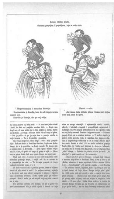
Prilog 2. Zvekan , 4. broj, 1890.(15. veljače 1890.), str. 27.

Krajem 19. stoljeća korzetu i neprirodno stegnutom tijelu se uz već spomenutu medicinsku struku počinju sve jače protiviti i ženski pokreti. 29 Međutim zanimljivo je da su zapravo najuporniji protivnici ukidanja korzeta bile upravo žene. Korzeti su se kritizirali i na šaljiv način kroz karikature u prilogu Doma i svieta poznatom kao Zvekan (vidi prilog 2.). 30