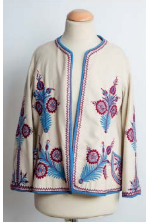
Prilog 25. Surka Josipe Vancaš (HPM/PMH 958)