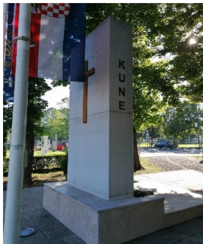
Fotografije 10 i 11: Spomenik 3. bojni 3. gardijske brigade „Kune“, Slavonski Brod

sjeverozapadnom stoji „KOBRE“, a na jugozapadnom pročelju stoji veliki katolički križ (slika 10). Križ simbolizira žrtvu, ali i neodvojivost katoličke crkve i vjeroispovijesti od kulture sjećanja na Domovinski rat.