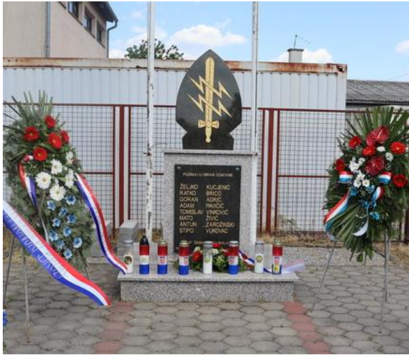
Fotografija 13: Spomen-obilježje poginulim pripadnicima Specijalne jedinice PU Brodsko-posavske, Slavonski Brod

održavan i koristi se kao mjesto sjećanja na pripadnike Specijalne jedinice PU Brodsko-posavske.