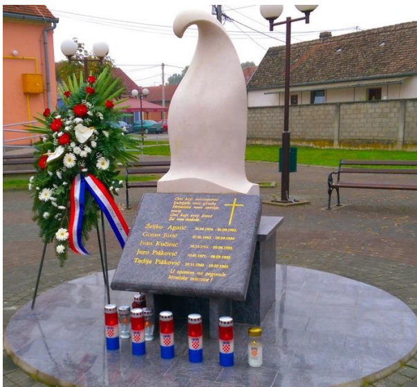
Fotografija 20: Spomenik poginulim braniteljima u Gornjoj Vrbi