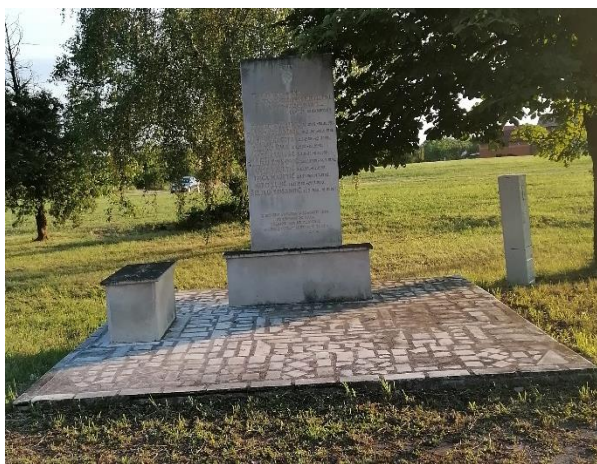
Fotografije 14 i 15: Spomen-obilježje i spomenik braniteljima i članovima NK Podvinje, Slavonski Brod