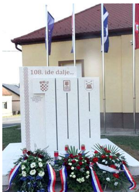
Fotografija 18: Spomenik pripadnicima 108. brigade u Podcrkavlju

U radu je već spomenuto da je 108. brigada osnovana krajem lipnja 1991. godine kao dragovoljačka postrojba ZNG. Njena 1. pješačka bojna tada je osnovana u selu Podcrkavlje, a 2. pješačka bojna u selu Sibinj. Na 31. godišnjicu njezina nastanka otkriven je spomenik poginulim i nestalim pripadnicima 108. brigade u Podcrkavlju. 95 Bijeli kameni spomenik sadrži grbove Republike Hrvatske, ZNG-a i 108. brigade, a na vrhu stoji poruka: 108. ide dalje... Osim grbova, na spomeniku se nalazi i simbol hrvatskog pletera koji se proteže cijelim