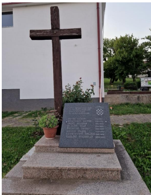
Fotografija 16: Spomenik žrtvama rata u Brodskom Vinogorju

I u naselju Vinogorje položena je spomen ploča poginulim braniteljima iz tog naselja. Na ploči uz hrvatski grb stoji tekst: