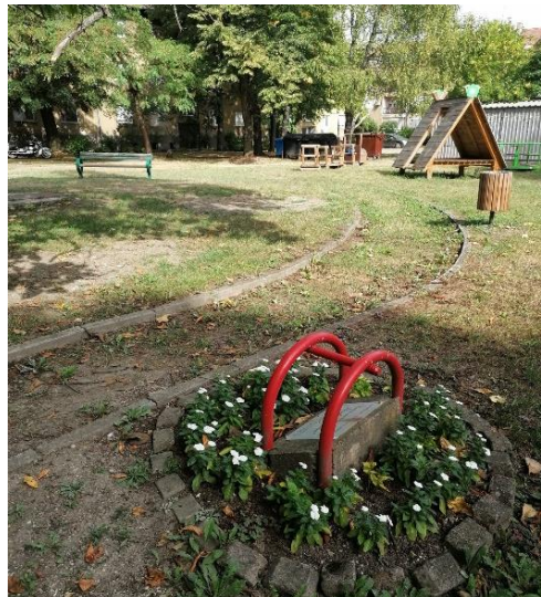
Fotografije 5 i 6: Spomen ploča na dječjem igralištu i pogled na igralište, Slavonski Brod

Osim djeci, u Slavonskom Brodu postoji i nekoliko spomen-obilježja posvećenim poginulim borcima u ratu. Najznačajnije takvo spomen-obilježje je spomenik „Poginulim braniteljima Hrvatske“ otkriven u svibnju 2004. godine. Spomenik kipara Ante Brkića isprva je postavljen u gradskom parku „Klasijske“ 89 , no kasnije je prebačen u park u strogom centru grada koji se nalazi između Vukovarske ulice i Trga Stjepana Miletića. Spomen-obilježje stoji ograđeno i uzdignuto na stepenastom platou, a sastoji se od brončanog kipa i obeliska (slika 5 i 6). Kip prikazuje ženu, odnosno majku koja klečeći drži dijete i pruža ga spomeniku - obelisku s hrvatskim grbom – majka svoje dijete predaje svojoj domovini. Na kipu ne stoji nikakav sadržaj u obliku teksta, dok spomenik nasuprot njemu sadrži imena 399 branitelja. Na vrhu obeliska stoji simbol hrvatske šahovnice, a ispod šahovnice stoje stihovi: