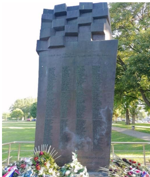
Fotografije 7 i 8: Spomen-obilježje i spomenik „Poginulim braniteljima Hrvatske“, Slavonki Brod