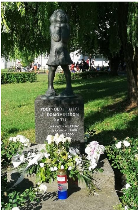
Fotografija 3: Spomenik „Djevojčica“, Slavonski Brod

Obzirom na to da je Slavonski Brod mjesto s najviše poginule djece u Domovinskom ratu u Hrvatskoj, već 2000. godine u gradu je podignut spomenik „Djevojčica“, posvećen djeci žrtvama rata u gradu. 87 Spomenik se nalazi u parku pokraj Osnovne škole „Hugo Badalić“ u