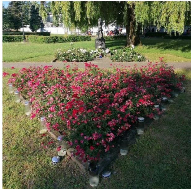
Fotografija 4: Spomenik i okruženje spomenika „Djevojčica“, Slavonki Brod

Posjet ovom spomeniku također dokazuje da je mjesto na kojem se nalazi prilično održavano i uređivano, okruženo cvjetnjakom (slika 4), a posebno mjesto sjećanja postaje za vrijeme obilježavanja teških stradanja djece u gradu.