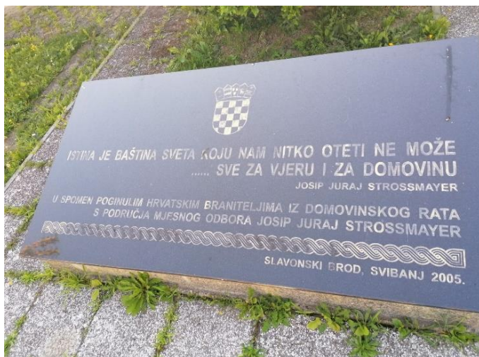
Fotografija 12: Spomen ploča poginulim braniteljima s područja mjesnog odbora J.J. Strossmayer, Slavonski Brod