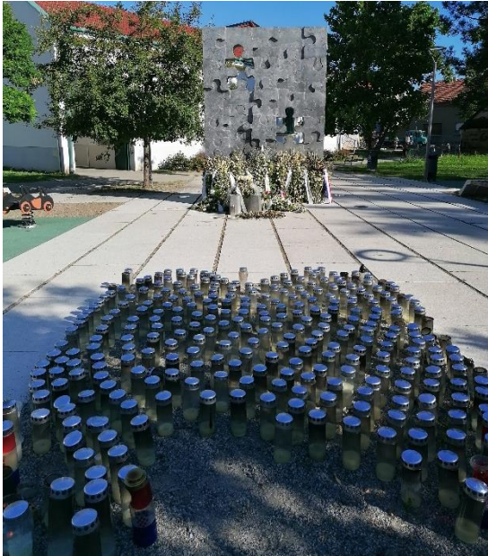
Fotografija 21: Sjećanje na stradalu djecu u Domovinskom ratu u spomen-parku „Prekinuto djetinjstvo“, Slavonski Brod, nekoliko tjedana nakon obilježavanja sjećanja 2022. godine

Sljedeći dan održana je misa i polaganje vijenaca za obljetnicu osnutka 3. bojne 3. gardijske brigade „Kune“, kada je mjesto sjećanja nakon mise ponovno bio spomenik „Poginulim braniteljima“ kod kazališno-koncertne dvorane „Ivana Brlić-Mažuranić“. Iako su „Kune“ dobile svoj spomenik nedaleko od spomenika „Poginulim braniteljima“, mjesto sjećanja nije se prebacilo, vijenci i lampioni i dalje se polažu na istom mjestu. 106