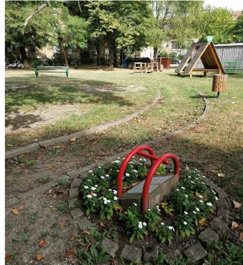
Fotografije 5 i 6: Spomen ploča na dječjem igralištu i pogled na igralište, Slavonski Brod

Osim djeci, u Slavonskom Brodu postoji i nekoliko spomen-obilježja posvećenim poginulim borcima u ratu. Najznačajnije takvo spomen-obilježje je spomenik „Poginulim braniteljima Hrvatske“ otkriven u svibnju 2004. godine. Spomenik kipara Ante Brkića isprva je postavljen u gradskom parku „Klasije“ 89 , no kasnije je prebačen u park u strogom centru grada koji se nalazi između Vukovarske ulice i Trga Stjepana Miletića. Spomen-obilježje stoji ograđeno i uzdignuto na stepenastom platou, a sastoji se od brončanog kipa i obeliska (slika 5 i 6). Kip prikazuje ženu, odnosno majku koja klečeći drži dijete i pruža ga spomeniku - obelisku s hrvatskim grbom – majka svoje dijete predaje svojoj domovini. Na kipu ne stoji nikakav sadržaj u obliku teksta, dok spomenik nasuprot njemu sadrži imena 399 branitelja. Na vrhu obeliska stoji simbol hrvatske šahovnice, a ispod šahovnice stoje stihovi: