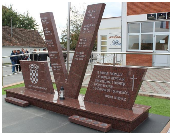
Fotografija 17: Spomenik poginulim i stradalim braniteljima s područja Općine Bukovlje

Općina Bukovlje podigla je 2016. godine spomen-obilježje stradalim braniteljima Bukovlja i okolice. 94 Spomen-obilježje nalazi se ispred same zgrade Općine Bukovlje, a sastoji se od tri mramorne spomen ploče koje stoje na istom postolju. S lijeve strane stoji spomen ploča s hrvatskim grbom ispod kojeg su ispisani stihovi hrvatske himne: LIJEPA NAŠA DOMOVINO! . Središnja ploča u obliku slova V sadrži imena i godine rođenja i smrti 9 branitelja iz Bukovlja, a ploča s desne strane sadrži posvetu braniteljima i križ. Ispod postolja nalaze se dva manja postolja namijenjena postavljanju lampiona.