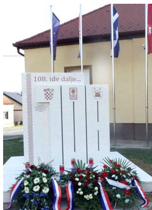
Fotografija 18: Spomenik pripadnicima 108. brigade u Podcrkavlju

U radu je već spomenuto da je 108. brigada osnovana krajem lipnja 1991. godine kao dragovoljačka postrojba ZNG. Njena 1. pješačka bojna tada je osnovana u selu Podcrkavlje, a 2. pješačka bojna u selu Sibinj. Na 31. godišnjicu njezina nastanka otkriven je spomenik poginulim i nestalim pripadnicima 108. brigade u Podcrkavlju. 95 Bijeli kameni spomenik sadrži grbove Republike Hrvatske, ZNG-a i 108. brigade, a na vrhu stoji poruka: 108. ide dalje... Osim grbova, na spomeniku se nalazi i simbol hrvatskog pletera koji se proteže cijelim