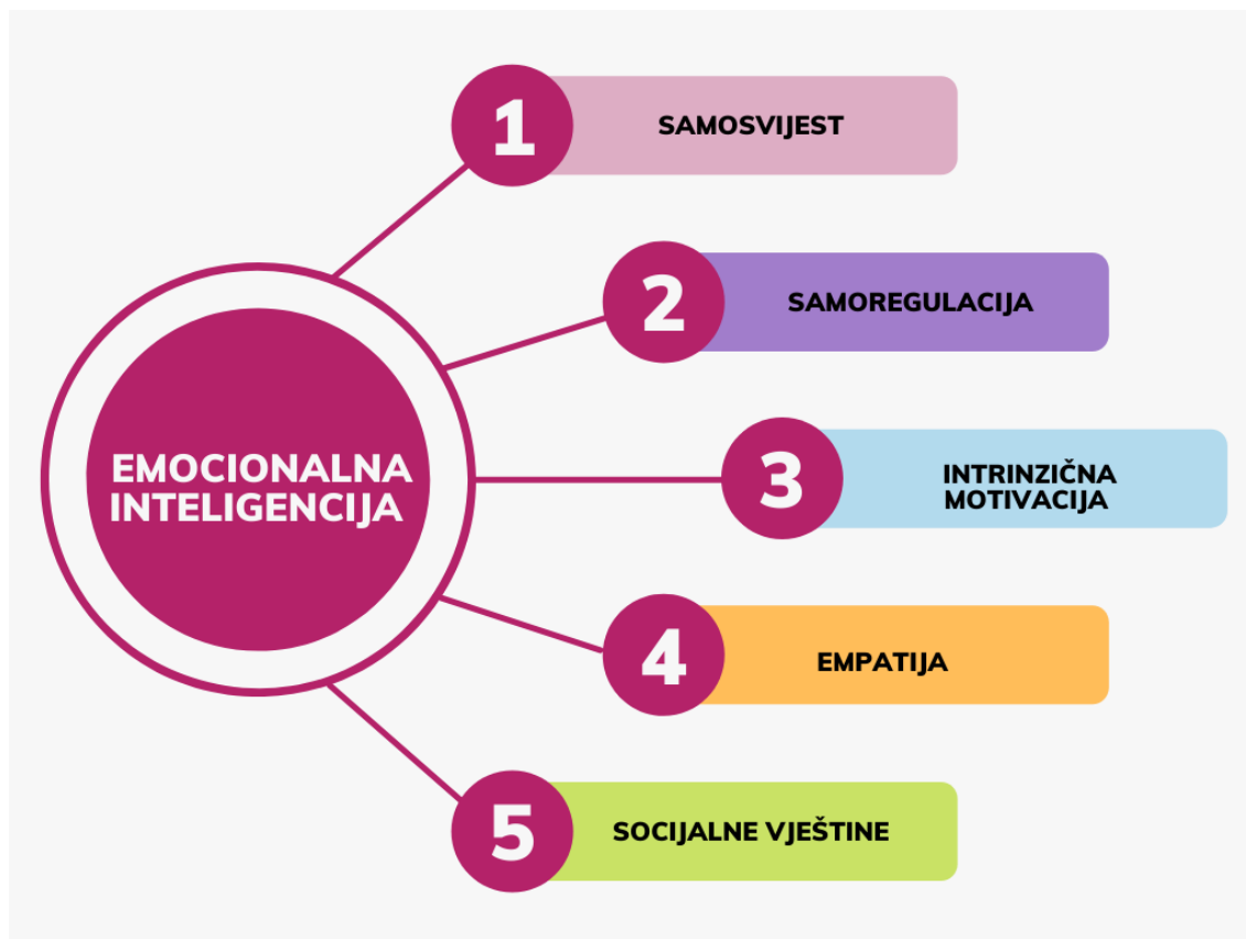
Slika 1 Prikaz Golemanove teorije emocionalne inteligencije 13

Goleman u govori o važnosti emocionalne inteligencije naspram kvocijenta inteligencije, oblikujući ovih pet komponenata kao komplementarnu jednadžbu koja oplemenjuje čovjeka. Emocionalno inteligentna osoba ukomponira svih pet komponenata samim time gledajući na sebe kao potpuna osoba koja je zadovoljna sama sa sobom. Iz vlastitog zadovoljstva proizlazi i empatija prema drugome. Što samo dokazuje kako se svih pet komponenata međusobno nadopunjava i isprepliće. Samosvjestan čovjek spoznaje samoga sebe i odnose s emocijama. Jednom kada osoba razlikuje vlastite emocije važno je znati kako ih prezentirati drugima. „Samoregulacija je sposobnost upravljanja i davanja smisla vlastitim emocijama i ponašanjima, u skladu sa zahtjevima neke situacije.“ 14 Pojavom stresne situacije u životu, bilo da se radi o teškoj dijagnozi ili smrti bližnje osobe, čovjek mora znati reagirati na mjestu, promišljeno se nositi s novonastalom situacijom. Pojavom novoga doba, djecu se od malih nogu uči samokontrolom vlastitih emocija kako ne bi došlo do nezgodnih situacija. Motivacija kod čovjeka ima veliku ulogu u radu i učenju, potiče na mentalnu ili tjelesnu aktivnost. Jednaki