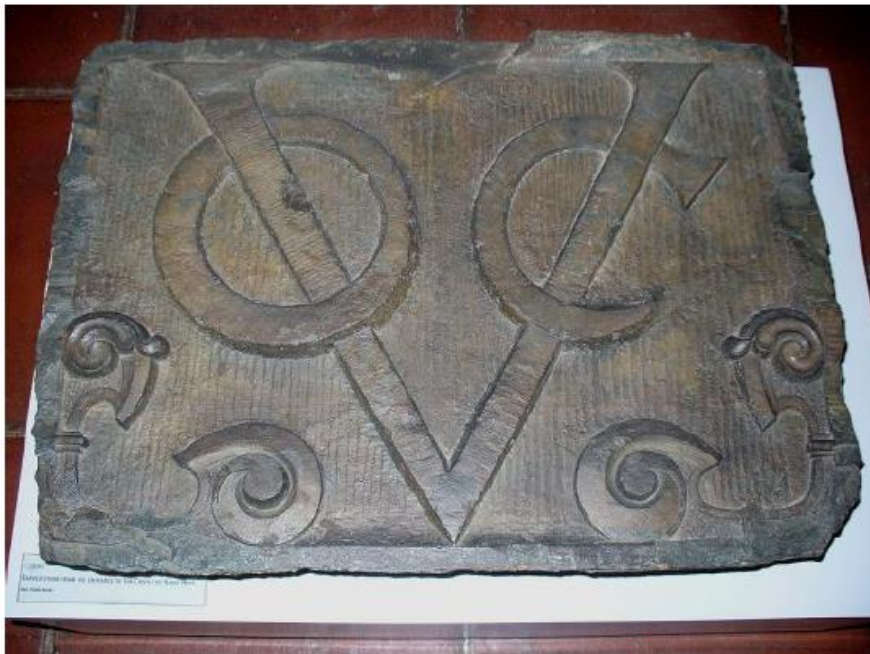
Slika 5- Monogram VOC