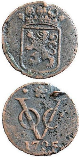
Slika 4- Kovanica VOC