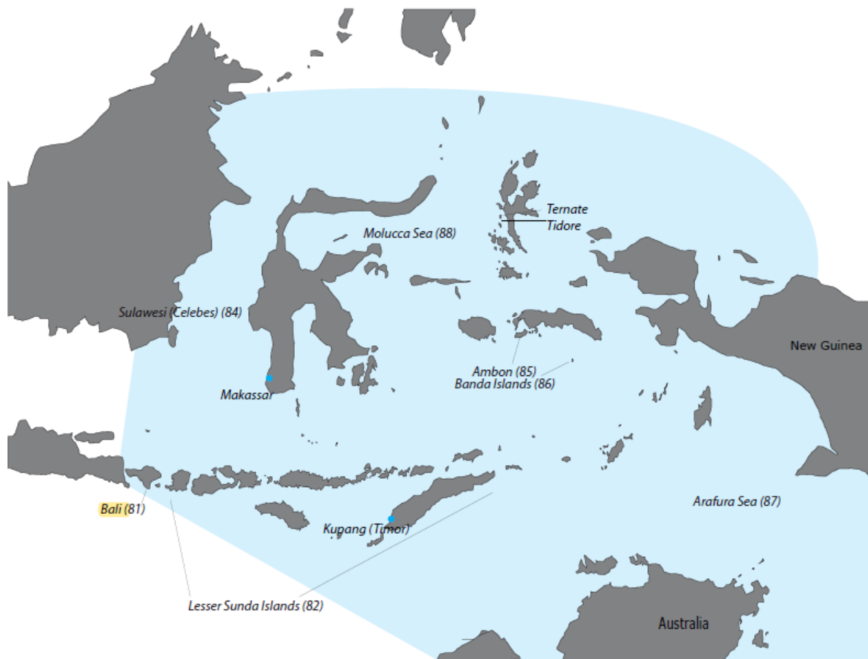
Slika 1- Na Karti vidimo današnja Indonezijska otočja ili regija koja se nekada nazivala Istočne Indije. Od velike će važnosti VOC-u predstavljati otočja poput Banda i otok Ambon te mnogi drugi otoci u ovoj regiji.

Putovanje je potaknulo druge bogate nizozemske trgovce da i sami krenu na isti put. Iste godine, 1597., Još jedna skupina nizozemskih trgovaca osnovala je vlastitu tvrtku. Nazvali su je "Nieuwe Compagnie te Amsterdam (Nova kompanija iz Amsterdama)". Do 1599. godine, osnovano je 6 novih tvrtki iz Rotterdama, Delfta i Zeelanda od kojih je jedna „Nieuwe Brabantse Compagnie“ ili NBC. Sve navedene tvrtke osnovane su s istim ciljem trgovanja začinima na istoku. Sljedeće godine, NBC-u je dopušteno da se udruži s Expert Compagnie, formirajući novo ujedinjenu „Verinigde Compagnie te Amsterdam“ (United Amsterdam Company). Osam velikih naoružanih