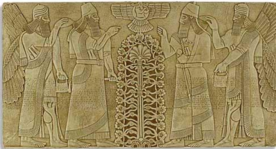
Asirsko Drvo Života,

Tako, primjerice, gnostički mitovi stvaranja tvrde kako je svijet stvorila Boginja koja je zatim svrgnuta s vlasti, zatočena u ljudsko tijelo i osuđena na zaboravljanje vlastite moći. lxxv Demonologije i hereze, s te strane, mogu biti shvaćene kao svojevrsne kulture sjećanja, odnosno, nosioci prežitaka nekog traumatičnog mitološko-duhovnog događaja, na sličan način na koji određeni narodi njeguju legende o njima nekoć nanesej povijesnoj nepravdi. No, gdje god postoji nepravda, postoji i iredentizam, pokušaj povrata nekadašnjeg teritorija, što ovdje također ne izostaje, u obličju brojnih novih religijskih pokreta.