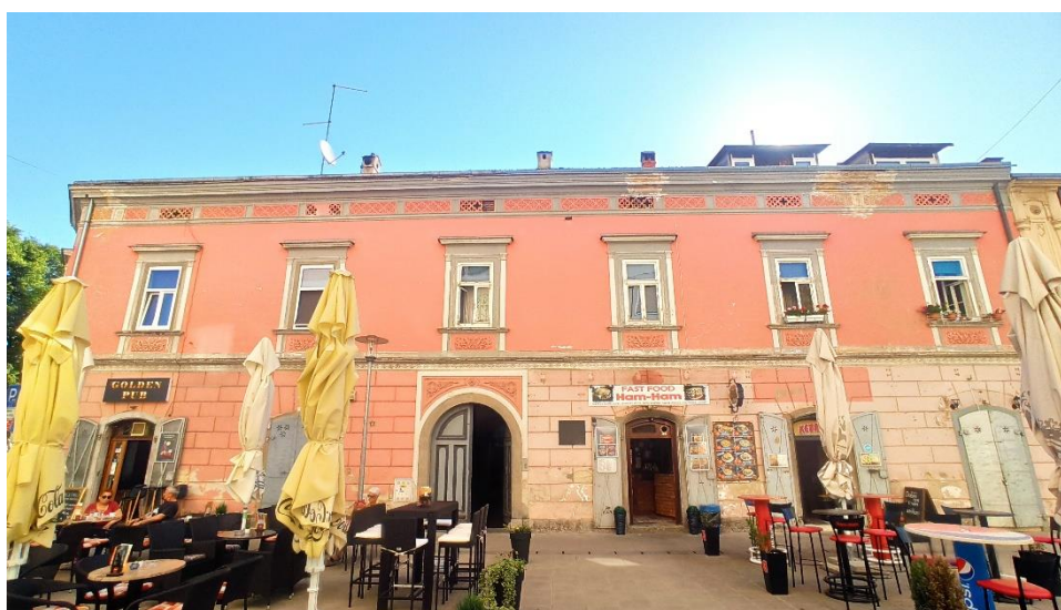
Uglovnica u Šebetićevoj ulici 4 (Kuća Bunete), 1880ih

Uglovnicu je sagradila nakon velikog požara 1866. godine obitelj Buneta na mjestu starije drvene kuće u kojoj je osnovana Narodna čitaonica „Ilirskog čitanja društvo“. Kuća ima očuvanu stariju konstrukciju, a pročelje bogatim detaljima profilacije ostvaruje klasifikaciju stila romantičnog historicizma. 186 Raščlamba pročelja u prizemnoj zoni ostvarena je pravokutnim žbukanim poljima glatke plohe. Polje iznad glavnoga polukružnoga ulaza dekorirano je simetričnim elementima vitica i medaljonima. Između prizemne zone i zone kata označeno je dvama vijencima, od kojih je niži dekoriran reljefnim četverolistima, a gornji je vijenac profiliran. Zona kata raščlanjena je pravokutnim prozorima koji su dodatno naznačeni reljefno dekoriranom pravokutnom plohom ispod prozorske klupe. Bočne su strane prozora omeđene uskim pilastrima koji imitiraju funkciju nosača širokog arhitrava čiste plohe iznad prozora, a ispod profiliranog nadstrešnika. Horizontalna traka ispod krovnoga vijenca dekorirana je pravokutnim reljefno razrađenim poljima koja slijede u paru, a između njih je postavljen uski pravokutni otvor s rešetkom koja imitira tranzenu. Zgrada ima prostorije poslovne namjene u prizemlju, dok se na katu nalaze stanovi. 187