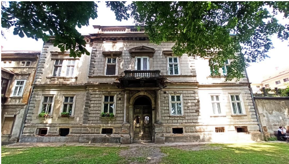
Jednokatnica na Šetalištu dr. Franje Tuđmana 5 (Stan i knjižara Ive Goldsteina), 1880ih

polukružnoga oblika istaknut lezenama pravokutnog profila s polukružnim žbukanim dijelom iznad vrata. Iznad ulaza je balkon s balustradnom ogradom nošen konzolama. Zona je kata odijeljena profiliranim vijencem, a raščlanjena je također žbukanim pravokutnicima. Iznad prozora na katu istaknuti su trokutasti zabat nad središnjim prozorom i nadstrešnici nad bočnim prozorima. Ispod krovišta vidimo kordonski vijenac, a nad središnjim se rizalitom diže atika s balustradama. Bočni dijelovi zgrade slijede sličnu obradu kao i rizalitni dio. Ugaoni dijelovi rizalita i bočnih strana dodatno su naglašeni žbukanom imitacijom ugaonih kamena (njem. Ortsstein , eng. Quoin ). Zgrada ima prostorije današnje stambene namjene. 103