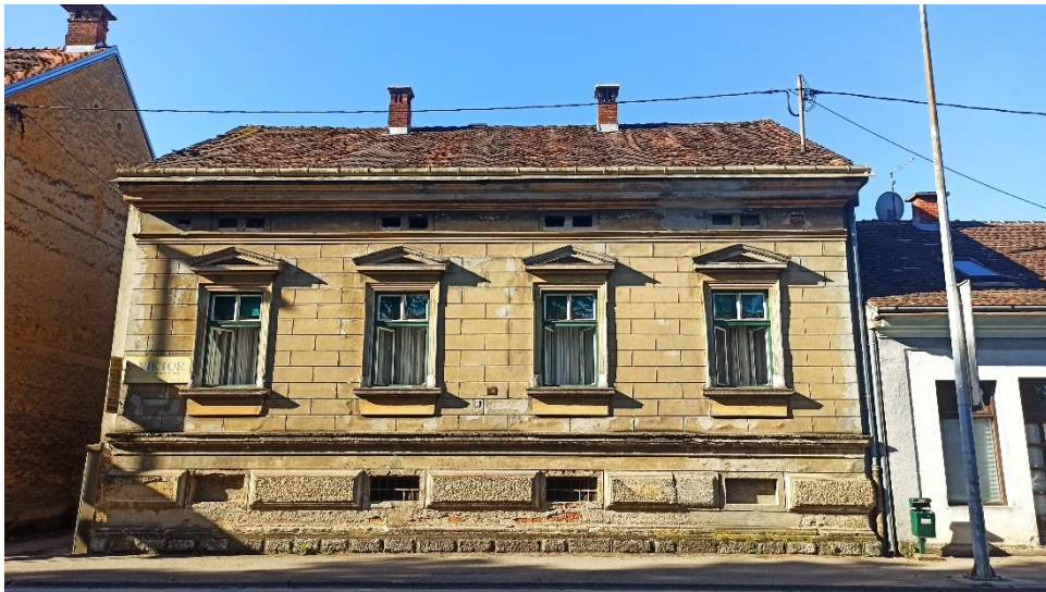
Neorenesansna prizemnica u Riječkoj/Mačekovoj ulici na br. 29 (1. 7. 2022.)

Prizemnice na brojevima 43 i 45 odlikuju se skromnijom dekoracijom pročelja i glatkom plohom zidnoga plašta. Izgrađene su na prijelazu stoljeća. Prizemnica na broju 43 u bazi je prekrivena grubo klesanim kamenom. Simetriju određuje središnji položaj ulaznih vrata prema ulici (vrata s lijeve strane vjerojatno su dodana naknadno), a sa svake strane su po tri prozora uokvirena kamenim okvirima iznad kojih se nalaze prozorske krune (njem. Fensterverdachung ). Ispod prozorskih otvora po cijeloj dužini kuće slijedi reljefni vijenac. U gornjoj je zoni uska horizontalna traka određena plitkim reljefnim vijencima, a raščlanjena uskim pravokutnim otvorima koji slijede otvore u donjoj zoni, od kojih je nekoliko u središnjoj zoni zazidano. Prizemnica na broju 45 sličnih je odlika kao i kuća na broju 43, osim izostalih prozorskih okvira, a krovni je vijenac s dentima. Obje su zgrade u privatnom vlasništvu. 91 Prizemnice slične tipologije nalazimo i u Ulici Dubovac na brojevima 6 i 18.