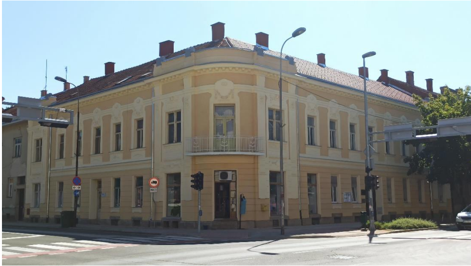
Neobarokna uglovnica u Domobranskoj ulici na broju 3, 1905./1907.

kordonski vijenac s dentima. Ugaona se zona dodatno ističe svojom dekoracijom u vidu reljefno razrađenih lezena s florealnim motivima, ženskim glavama i profiliranim konzolama u potkrovnoj zoni i krovnom atikom s izbočenim i bojom naglašenim dijelovima koji podsjećaju na jonske volute. Središnji dio ugla u zoni kata čini balkon s rešetkom od kovanoga željeza sa secejskim motivima. Zgrada ima danas poslovnu namjenu u prizemlju, dok su u prizemlju i prvome katu stanovi. 196