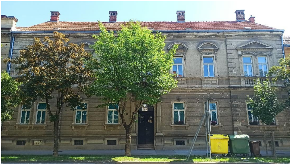
Neorenesansna jednokatnica Della Marina u Domobranskoj ulici 7, 1900ih