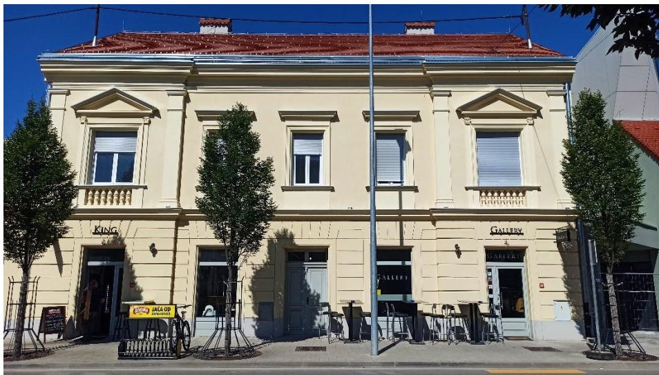
Zrelohistoricistička jednokatnica u Ulici Rakovac 8 (1. 7. 2022.)