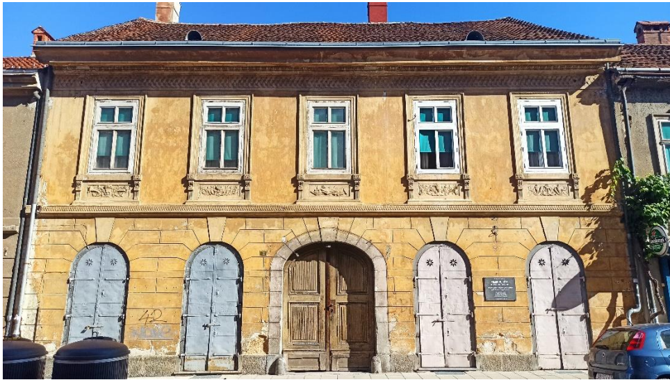
Jednokatnica u Preradovićevoj ulici 12, 1866.

(nešto šire od donjega vijenca) i gornja koja imitira jonski kimation (njem. Eierstab-Ornament ). 192 Zgrada ima danas poslovno-stambenu namjenu. 193