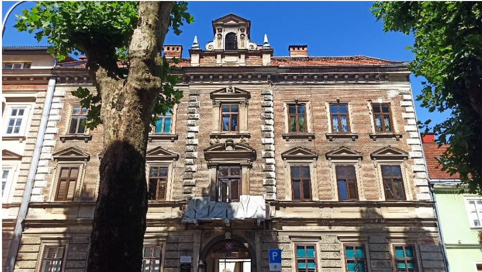
Dvokatnica u Ulici V. Nazora 6, 1884. (1. 7. 2022.)