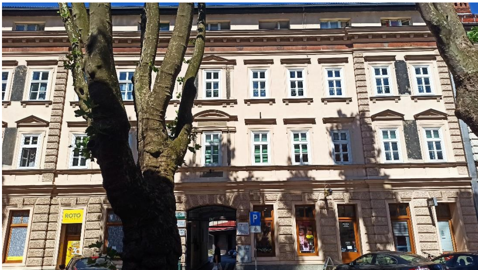
Dvokatnica u Ulici V. Nazora 8, 1884. (1. 7. 2022.)