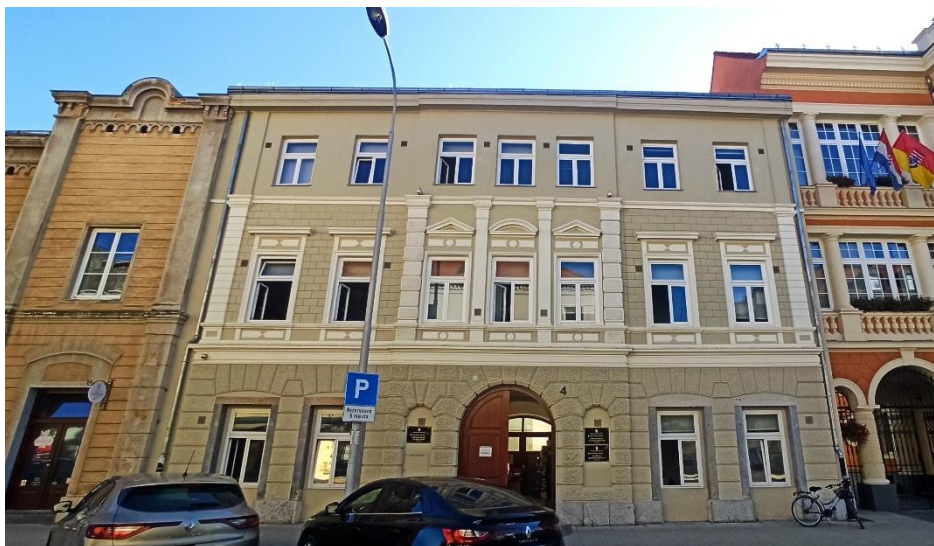
Vranyczanyjeva kuća u Vranyczanyjevoj ulici 4, stanje danas (1. 7. 2022.)