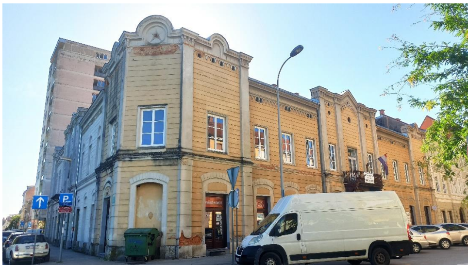
Palača Barako, stanje danas (1. 7. 2022.)