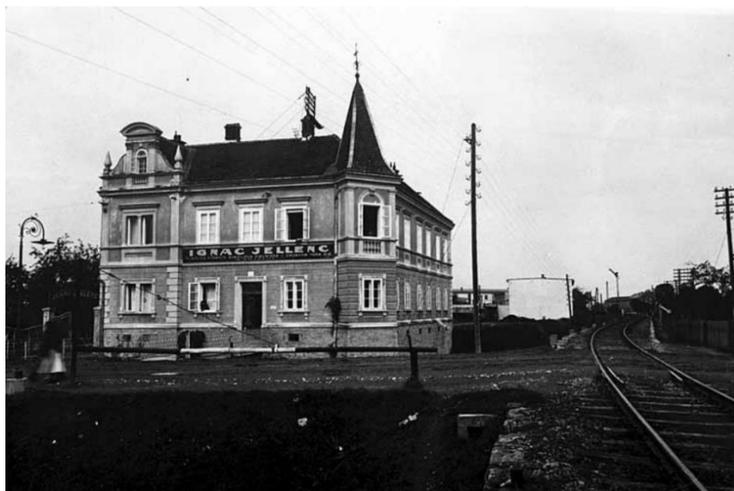
Upravna zgrada Tvornice Ignac Jellenc, 1908.

Iako ne pripada ovoj kategoriji, ovdje će biti navedena kao zgrada isključivo poslovne namjene. Upravna jednokatna zgrada tvornice limenih štednjaka, bravarske i željezne robe vlasnika Ignaca Jellenca jedinstven je primjer historicističke gradnje iz 1908. godine koja podsjeća na uglovnice Radićeve i Kukuljuvićeve ulice s uglovnim tornjem. Upravnu zgradu daje graditi njegov sin Rudolf koji umire 1927. godine, a tvornicu 1931. preuzima norveški koncern „Mustad d. d.“. 200 Zgrada svojim istaknutim rizalitima, jednim na ugaonom dijelu i drugim na bočnoj strani pročelja prema Mačekovoj ulici, podsjeća na historicističke dvorce. Zgrada je nakon u donjoj zoni nakon kamenoga sokla, u prizemlju raščlanjena glatko žbukanim horizontalnim nizovima. Prozori u prizemlju naglašeni su žbukanim profiliranim okvirima s naglašenim nadstrešnikom i zonom ispod prozorske klupe. Zona između prizemlja i kata razdvojena je frizom koji je raščlanjen pravokutnim žbukanim oblicima koji se nižu ispod prozorskih klupa gornje zone. Prozori su u zoni kata natkriveni nadstrešnikom. Dekoracijom se izdvajaju rizalit u zoni drugoga kata koji završava polukružnim lukom s bočnim ukrasima u obliku obeliska, polukružnim prozorom s balustradom ispod prozorske klupe, pilastrima i nadstrešnikom prozora u obliku luka. Ugaoni dio s tornjastim završetkom dekoriran je sličnim repertoarom u zoni kata. Zgrada ima danas poslovnu namjenu. 201