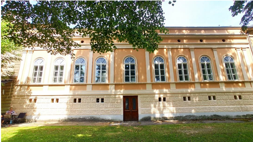
Visoka prizemnica na Šetalištu dr. Franje Tuđmana 3, 1880ih