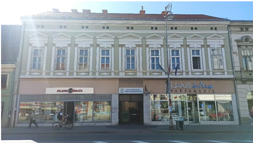
Kuća Banjanin na Zrinskom trgu 5, 1880ih (1. 7. 2022.)

izduženim rombovima u žbuci, a gornji je dio naznačen elementom koji podsjeća na ključni kamen. Pilastri imitiraju nosače koji nosi dvostruki grednjak na vrhu kojega je trokutni zabat. Iznad zabata slijedi profilirani vijenac. Ispod krovnooga se vijenca nalazi uska horizontalna traka u kojoj su otvorene male kvadratne bifore. Jednokatnice u nizu na brojevima 17 i 19 primjeri su klasicističke arhitekture prve polovine 19. st. građene za bogatiji karlovački sloj, od kojih ona na broju 17 ima nadogradnje iz 1860. godine, no skromnijeg repertoara historicističke razrade. Zgrada ima prostorije poslovne namjene u prizemlju, dok je na prvome katu jedan trosobni stan u privatnom vlasništvu. 182