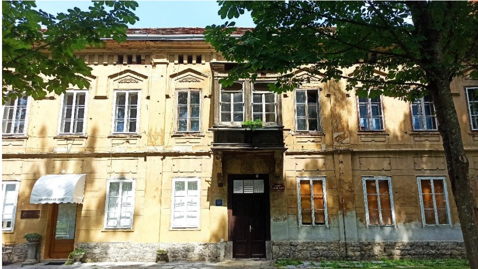
Jednokatnica Lopašić na Šetalištu dr. Franje Tuđmana 2, 1868.

na vijenac s dentima. Središnji je ulaz okrenut prema Šetalištu, a pročeljem dominira drveni erker koji se nalazi na dvjema konzolama iznad glavnoga ulaza. Drveni su elementi reljefno razrađeni. Pročelje zgrade, kao i njena stolarija i erker, u lošem su stanju. U zgradi se nalazi jedan stan u privatnom vlasništvu, dok je ostatak zgrade u državnom vlasništvu pod zaštitom. 100