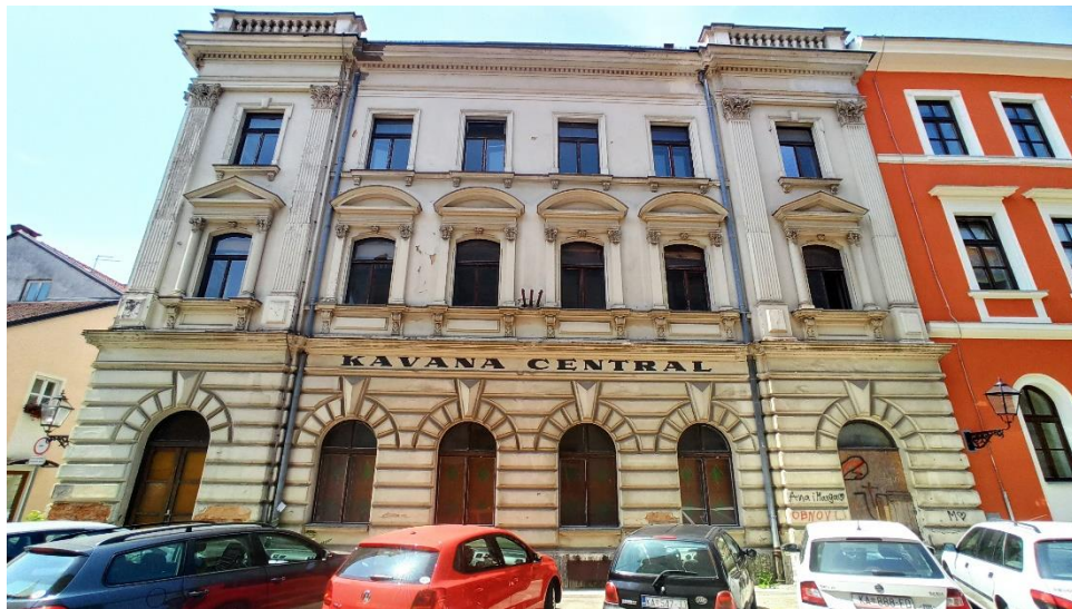
Hotel „Central“ na križanju Samostanske ulice i Ulice J. Haulika, 1894. (29. 6. 2022.)