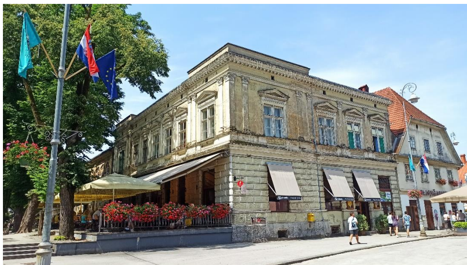
E. Mühlbauer, Kuća Purebl (Velika kavana) , 1874., Šetalište dr. Franje Tuđmana 1

građevine. Zgrada se nalazi na Listi zaštićenih nepokretnih kulturnih dobara (Z-257). 177 Namjene je zgrade poslovna, no ima i dva stana na prvome katu. 178 Općenito, Velika promenada ili današnje Šetalište formiralo se 1781., nakon što su dopuštene gradnje uz tvrđavski šanac. Od poč. 19. st. dopušteno je građenje čvrstim materijalima (prije se smjelo graditi isključivo u drvu). 179