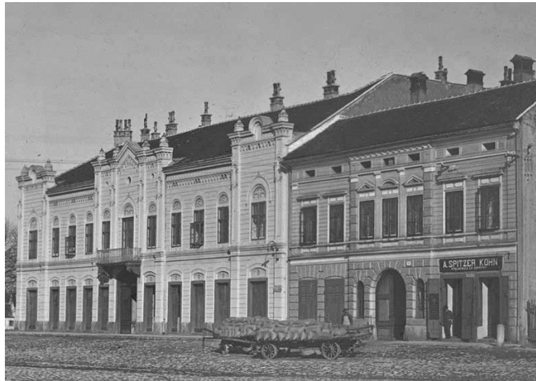
Palača Kosta-Barako u Vranyczanyjevoj ulici 6 (lijevo) i Vranyczanyjeva kuća u Vranyczanyjevoj ulici 4 (desno), slika iz 1870ih

ukrasa. U zgradi se danas nalazi Ured državne uprave Karlovačke županije, poslovni prostor vezan za Palaču Fröhlich.