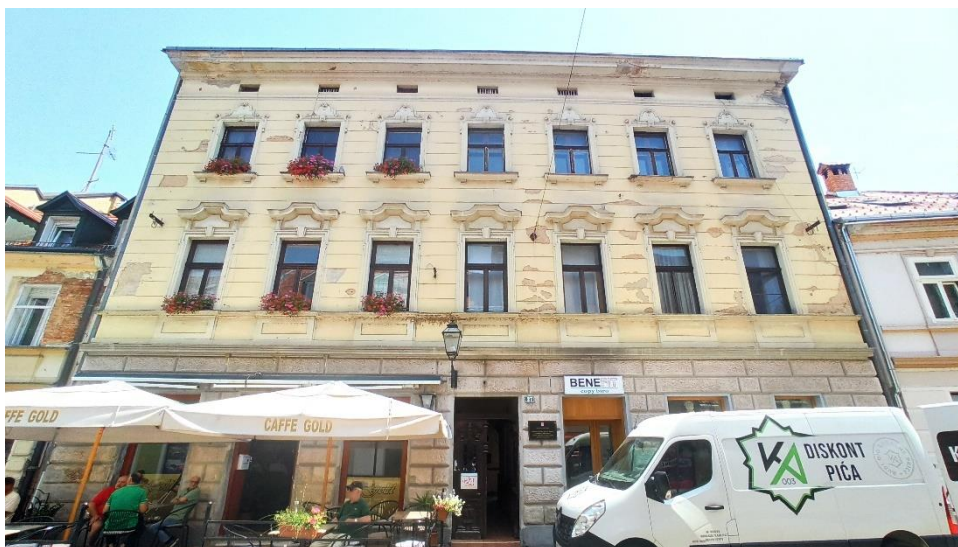
Kuća Strahinjščak u Radićevoj ulici 27, 1902. (29. 6. 2022.)