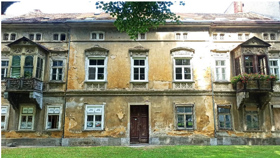
Jednokatnica na Šetalištu dr. Franje Tuđmana 6, 1870. (29. 6. 2022.)

vrata te dekoracijom. Zidni plašt prizemne zone izveden je u glatkoj žbuci koja je raščlanjena jedino u vidu profiliranih okvira prozora. Dekorativni friz između zone prizemlja i kata razrađen je motivom romba koji je ispunjen reljefima četverolista. Zona kata raščlanjena je prozorskim otvorima i dekorativnim reljefima ispod prozora (kvadratna polja s rešetkom koje podsjećaju na tranzene, geometrijske gotičke ornamentike) i reljefnim zonama ispod prozorskih nadstrešnika (polja su ispunjena vegetabilnim motivima lišća i vitica). Potkrovnna zona završava uskim profiliranim vijencem iznad koje su smještene bifore s rešetkama koje podsjećaju na tranzene. Pročeljem svakako dominiraju dva erкера na bočnim stranama zgrade. Erkeri su smješteni na dvije konzole i izvedeni u drvu te imaju dvoslivni krov. U dekoraciji prevladavaju reljefne drvene ploče s motivima vitica i lišća, kako u donjoj zoni, tako i u gornjoj, na koje se u gornjoj zoni nastavlja trokutni zabat s reljefnom rozetom. U repertoaru dekoracije se koristi i motiv kaneliranog stuba s kapitelom (očuvan je na lijevom primjeru erкера). Zgrada ima danas prostorije stambene namjene. 106