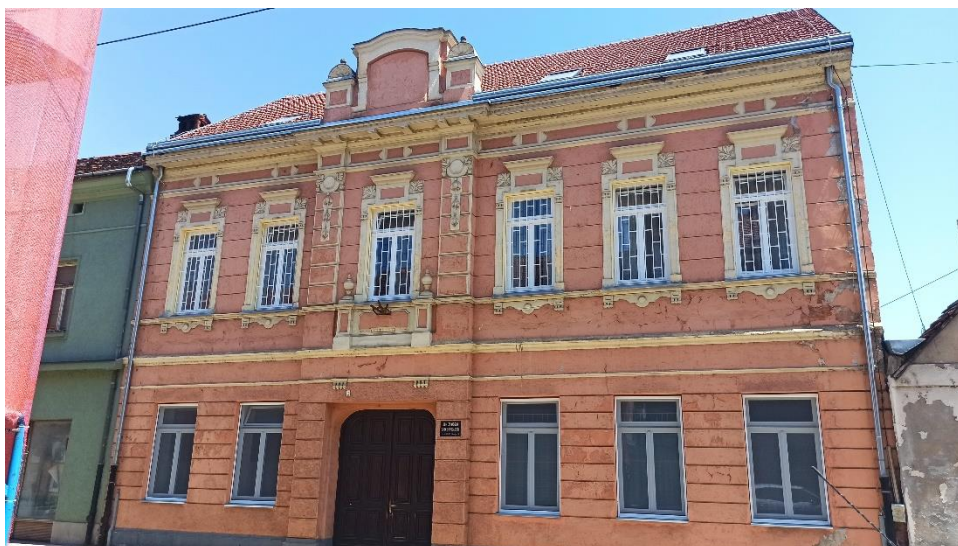
Stambeno-poslovna jednokatnica u Ulici Banija 14 (Hotel i gostionica „K veselom Hrvatu“), poč. 20. st.