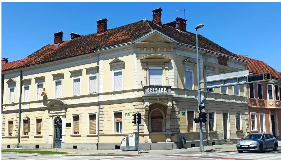
Kuća Modrušan, križanje Ulice Banija i Ulice A. Starčevića, kraj. 19. st.

Krovna je atika oblikovana u obliku trokutnog zabata, nošena ukošenim konzolama. Zgrada ima danas stambenu namjenu. 132