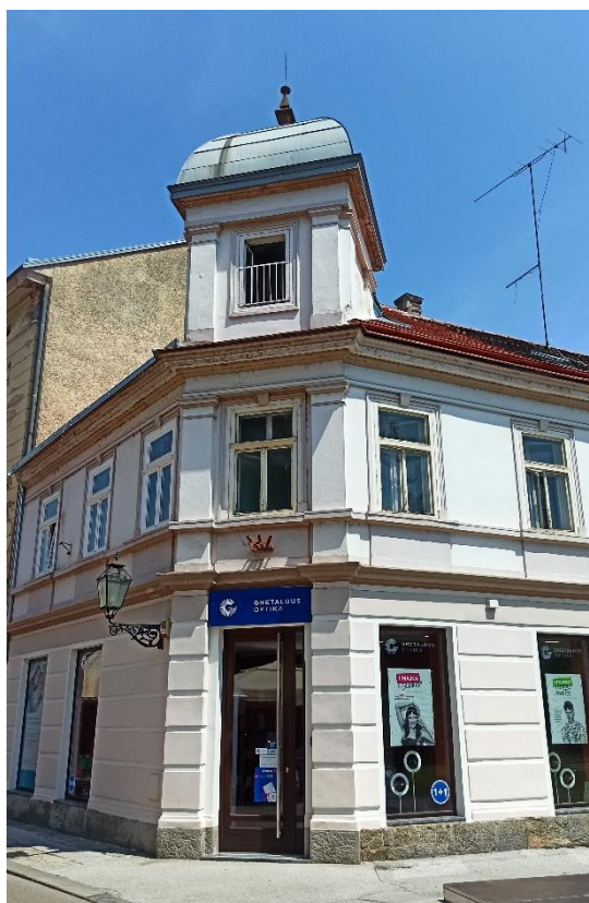
Uglovnica na adresi Ulica I. K. Sakcinskog 1, kraj 19. St. (29. 6. 2022.)