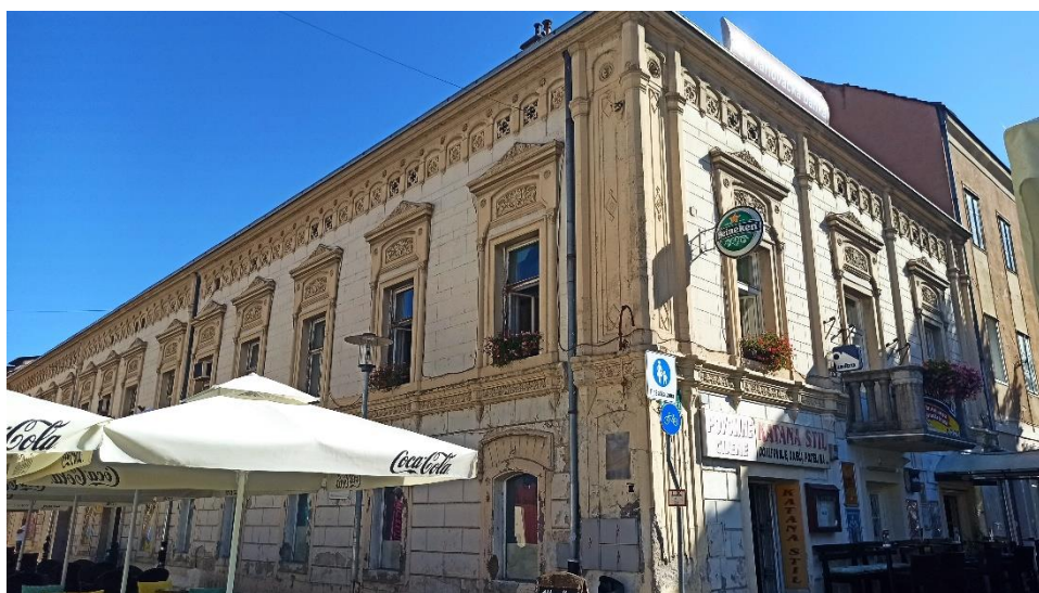
Uglovnica u Šebetićevoj ulici 2 (Nova kuća Türk), 1880ih

otvori prozora i vrata uokvireni su profiliranim okvirima. Prozori imaju dodatno raščlanjene gornje zone okvira s vertikalno usmjerenim pravokutnicima. Prizemna zona završava dekorativnim frizom motiva lišća omeđenim profiliranim vijencima. Zona kata razrađena je plitko žbukanim pravokutnicima glatke plohe. Najznačajnija dekoracija vezana je uz obradu reljefnih ukrasa oko prozora na katu. Prozori su, osim profiliranim okvirom, omeđeni pilastrima koji u donjoj zoni završavaju poligonalnim i stožastim ukrasom koji podsjeća na gotičke ukrasne elemente fījala. U zoni iznad prozora vidimo reljefno razrađena polja s florealnim motivima. Iznad nadstrešnika prozora nalazi se simetrični reljefni ukras s motivima vitica i lišća. Potkrovnja je zona, ispod krovnoha vijenca, razrađena visećim lukovima između kojih se nalaze otvori s umetnutom rešetkom koja podsjeća na tranzenu. Na uglu zgrade prema Trgu Matije Gupca, zgrada ima istaknuti element koji se sastoji od istaknutih poligonalnih pilastara, geometrijskih polja zidne plohe i kružnih otvora s četverolistom koji podsjećaju na gotički repertoar dekoracije. Zgrada ima poslovnu namjenu, a u vlasništvu je Srpskog narodnog vijeća. 185