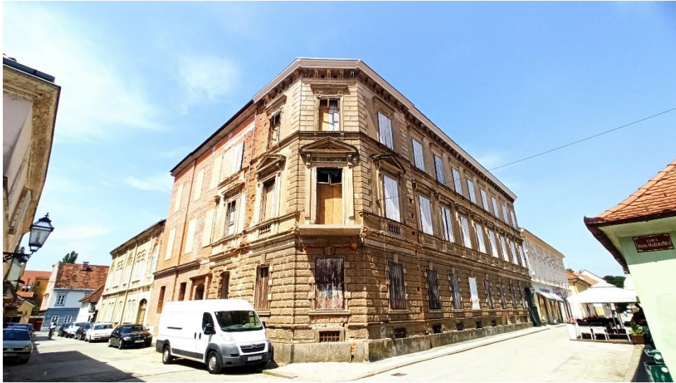
Zgrada Srpske pravoslavne općine u Radićevoj ulici 14, 1882. (29. 6. 2022.)