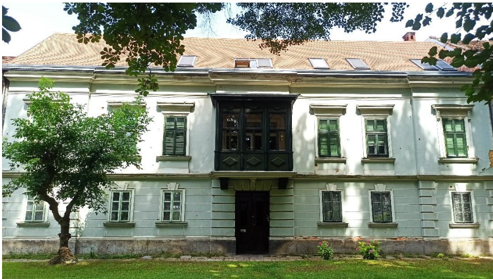
Jednokatnica na Šetalištu dr. Franje Tuđmana 7, 1897. (29. 6. 2022.)

nepokretne zaštićene kulturne baštine (Z-262). Prema konstruktivnim i arhitektonskim oblicima, građevina je karakteristična gradnja zadnje četvrtine 19. st., odnosno zreloga historicizma. 107 Simetriju građevine uspostavlja središnji ulazni dio s erkerom u zoni kata, raspodjela prozora i bočni rizaliti. U prizemnoj zoni iznad kamenog sokla vidimo raščlambu zidnoga plašta žbukanim pravokutnim oblicima u horizontalnom nizu. Zone središnjeg i bočnih rizalita dodatno su naglašene žbukanim dijelovima koji imitiraju ugaone kamene. Prozori su uokvireni žbukanim profiliranim okvirima, imaju prozorsku klupu i trodijelni ključni kamen tipa G-glatt . 108 Profilirani vijenac omeđuje zonu prizemlja i kata. Središnji je erker smješten na dvjema konzolama i izrađen je od drva. Središnji su elementi ispod prozora erkera dekorirani motivima romba prazne ispune. Prozori u zoni kata također su uokvireni žbukanim okvirima, ispod kamene klupe su prazna pravokutna polja glatke plohe, a nadstrešnik je profiliran. Okviri prozora na bočnim rizalitim imaju dekorirane konzole koje nose nadstrešnik. Potkrovni dio započinje uskim profiliranim vijencem, praznom horizontalnom trakom i profiliranim krovim vijencem. Iako je zgrada recentnije obnovljena (vidljivo po žbuci), vidimo oštećenja žbuke na desnom rizalitu. Zgrada ima danas poslovno-stambenu namjenu. 109