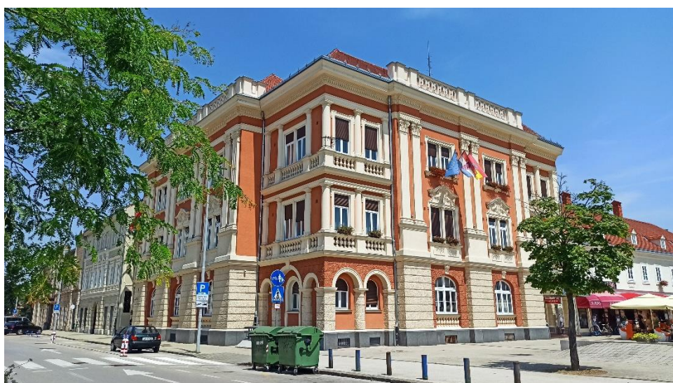
Palača Fröhlich, 1918., stanje danas (29. 6. 2022.)