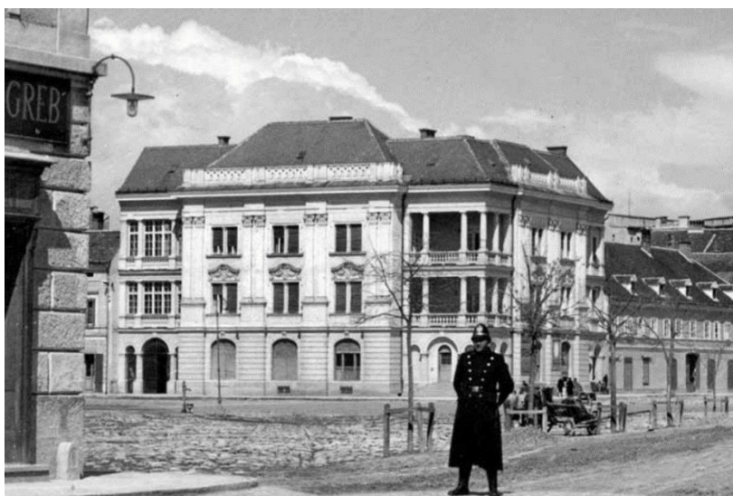
Palača Fröhlich nakon izgradnje

zaštićenih nepokretnih kulturnih dobara (Z-7414). 148 Na starijoj fotografiji vidimo kako je došlo do preinaka u oblikovanju bočnih strana palače jer su nakon izgradnje palače postojali balkoni na prvom i drugom katu. Oni su danas zazidani i otvoreni prozorima s balustradama. Danas se u palači nalazi sjedište Karlovačke županije. U unutrašnjosti palače, kao i u ostale dvije (Palača Vranyczany i Palača Barako), ostali su sačuvani detalji iz vremena u kojem su građene: podne pločice, zidni oslici ulaznog predvorja, stubišne ograde, ukrasne skulpture stepeništa, ali i namještaj interijera.