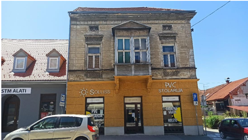
Kuća Balaš na uglu Ulice Banija i Ulice A. K. Miošića, 1874.