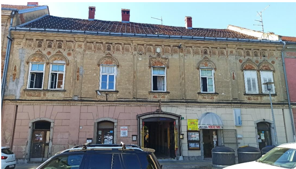
Jednokatnica u Preradovićevoj ulici 5, 1870.