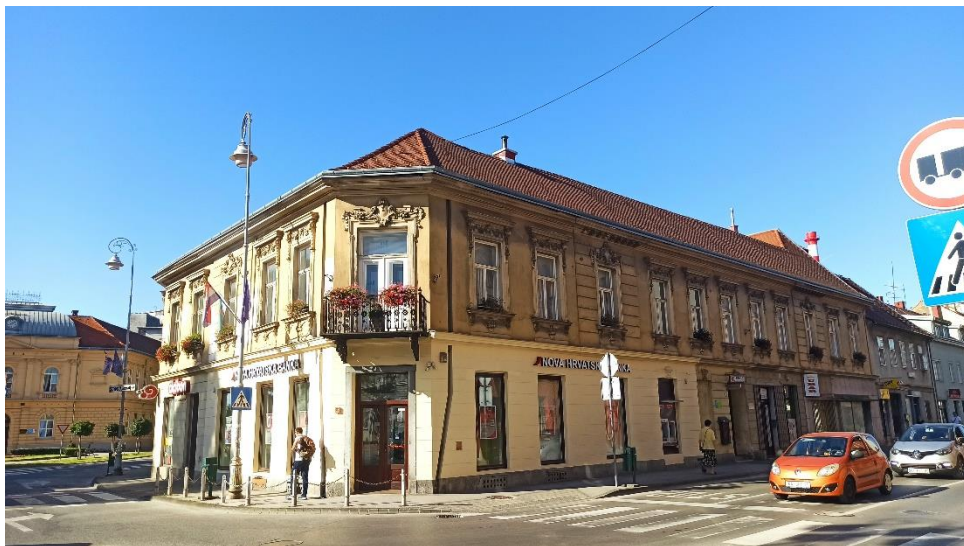
Trokrilna uglovnica u Ulici dr. Vladka Mačeka 1, 1858.