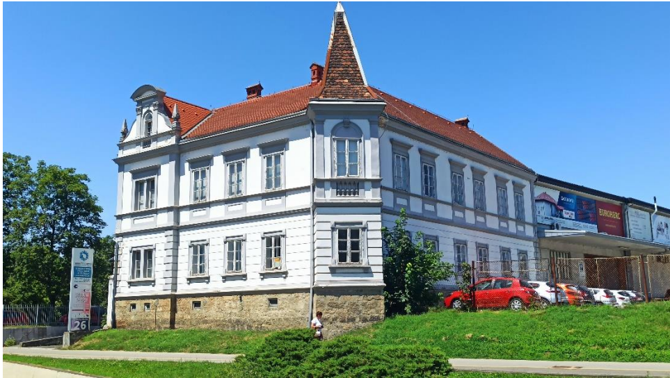
Upravna zgrada Tvornice Ignac Jellenc, 1908., stanje danas (1. 7. 2022.)