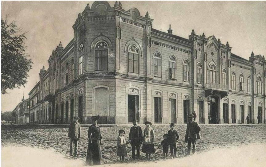
Palača Barako s članovima obitelji, preuzeto s KaFotka