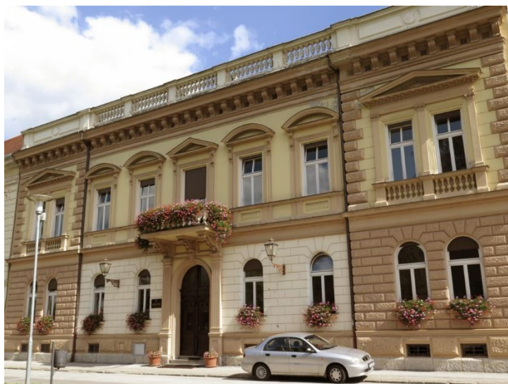
Đuro Carnelutti, Palača Reiner (danas Glazbena škola), 1890., Ulica Augusta Cesarca 3