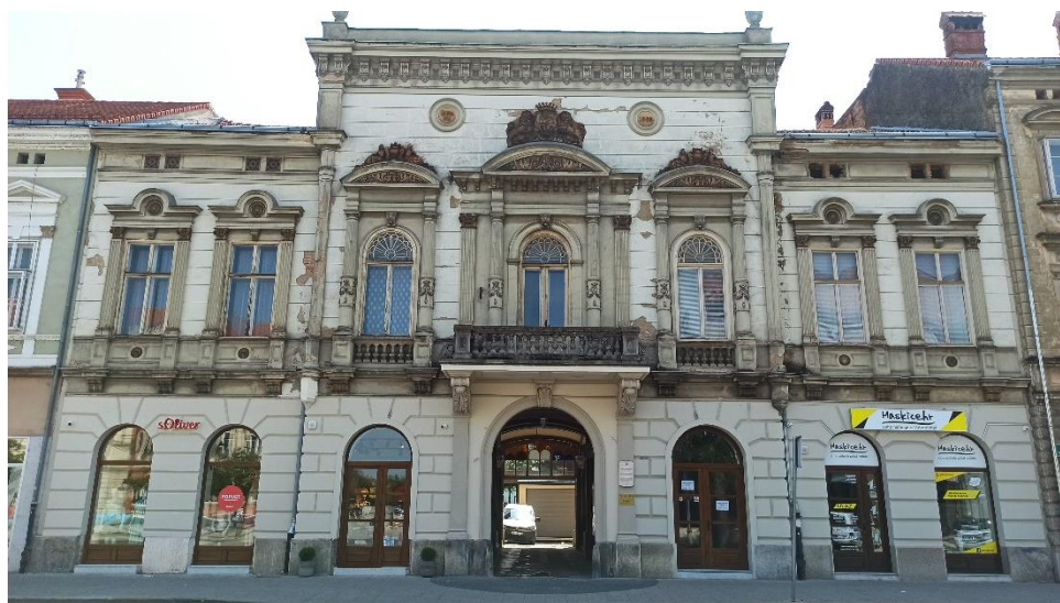
Palača Vranyczany danas, nakon preinaka iz 1935./1937. (1. 7. 2022.)