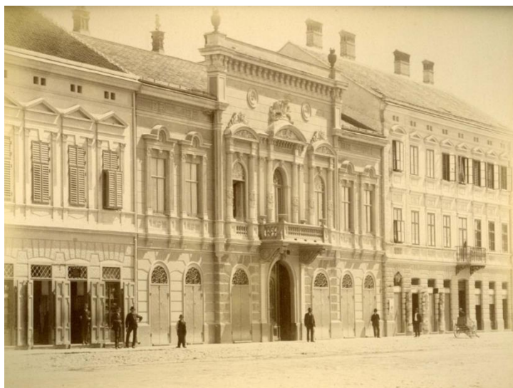
Palača Vranyczany u središtu niza, zgrada originalno zamišljenog projekta