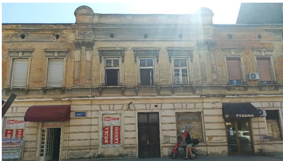
Zrelohistoricistička jednokatnica u Ulici Rakovac 19 (1. 7. 2022.)