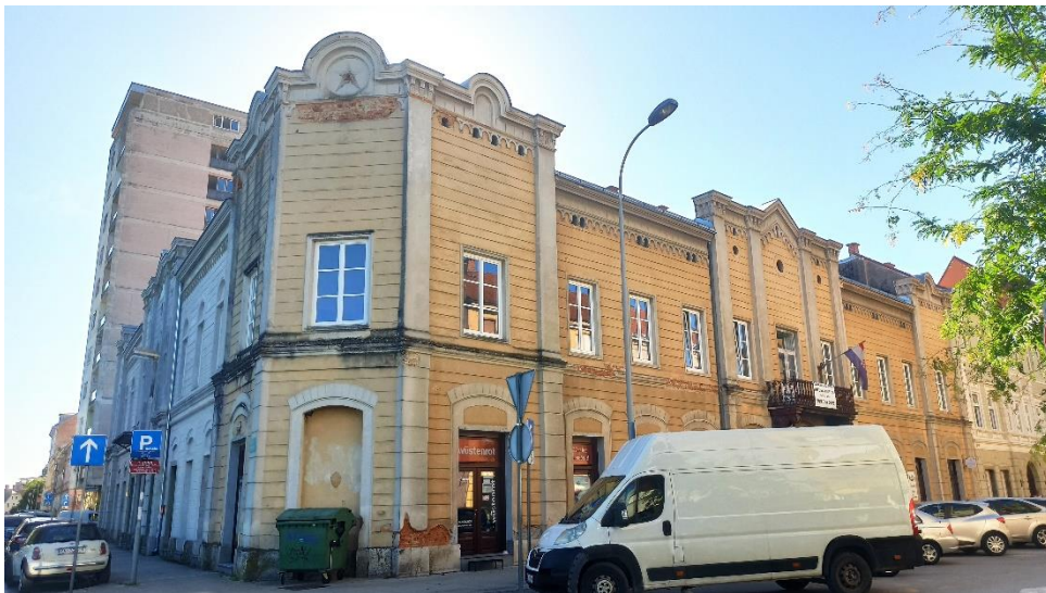
Palača Barako, stanje danas (1. 7. 2022.)