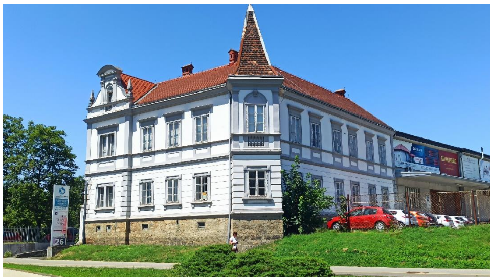
Upravna zgrada Tvornice Ignac Jellenc, 1908., stanje danas (1. 7. 2022.)