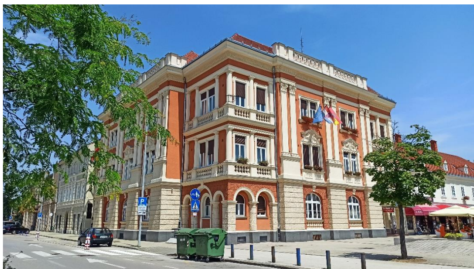
Palača Fröhlich , 1918., stanje danas (29. 6. 2022.)