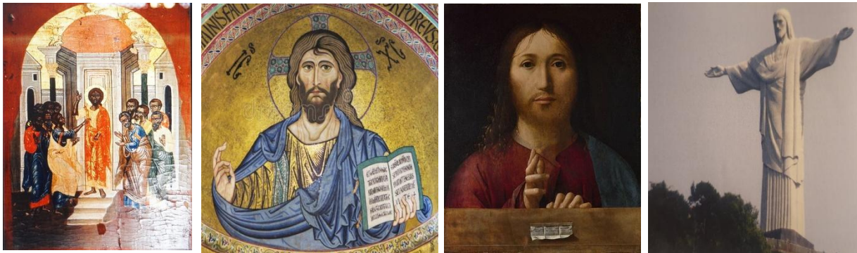
Slika 1. Najstariji prikaz Isusa Krista crne puti; slika 2: Prikaz Isusa Krista iz 12. stoljeća; slika 3: Slika Kristov Blagoslov; slika 4: Kip Krista Otkupitelja u Rio de Janeiru iz 1931. godine.

U zadatku se od učenika očekuje da promotre sva četiri prikaza Isusa i samostalno pokušaju zaključiti zašto se Isus Krist u različitim povijesnim razdobljima različito prikazuje. Nadalje, od učenika se očekuje da samostalno procjene koji prikaz je najobjektivniji te da obrazlože svoja stajališta. Ovakvim zadatkom omogućuje se učenicima da proučavaju određen fenomen ljudskog stvaralaštva kroz duži period te time bolje razumiju nastavno gradivo i stječu sposobnost stavljanja fenomena u povijesni kontekst kojeg potom mogu interpretirati i ocijeniti. Putem zadatka usporedbe učenici imaju mogućnost uočavanja sličnosti i razlika određenog fenomena te njihov utjecaj. Uspoređivanjem učenici lakše samostalno formuliraju opće zaključke. 118