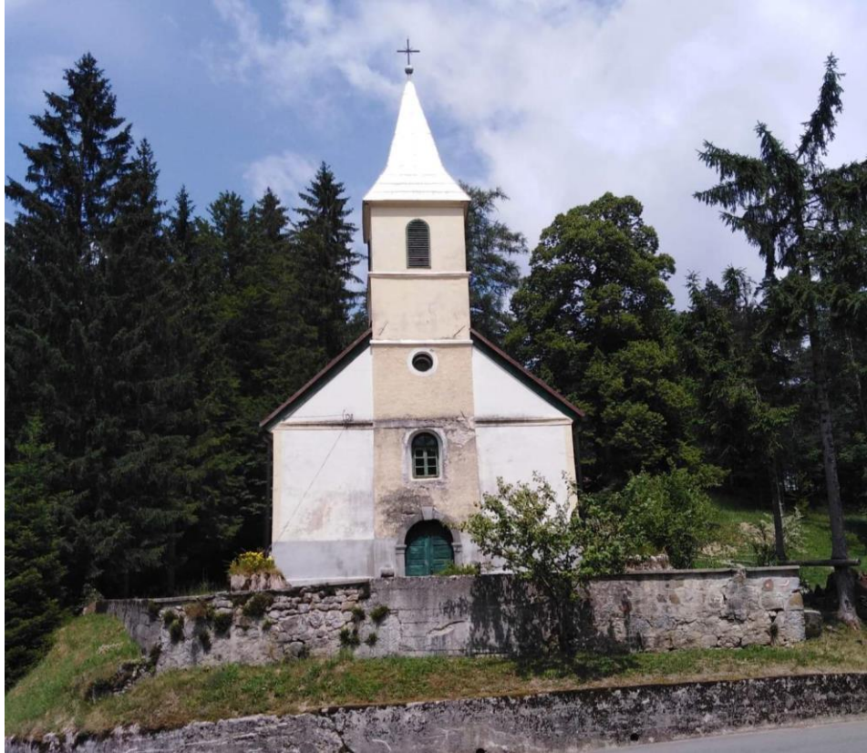
Slika 21. Crkva sv. Antuna Padovanskog u Staroj Sušici