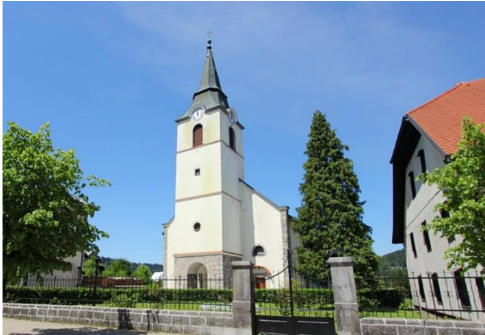
Slika 7. Crkva sv. Ivana Krstitelja u Delnicama