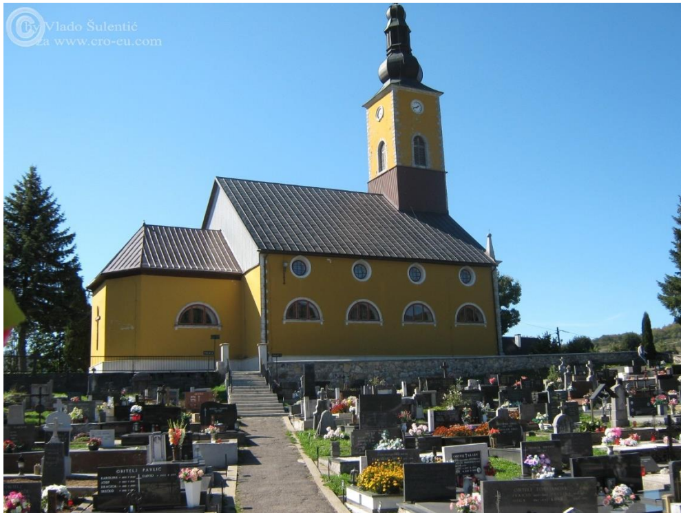
Slika 19. Crkva Majke Božje od sedam žalosti u Mrkoplju