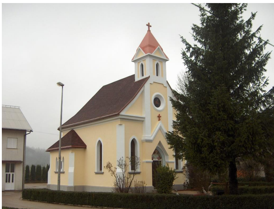
Slika 18. Crkva Majke Božje Lurdske u Vratima