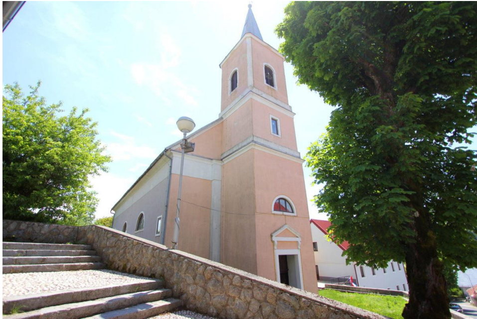
Slika 9. Crkva sv. Antona Padovanskog u Fužinama