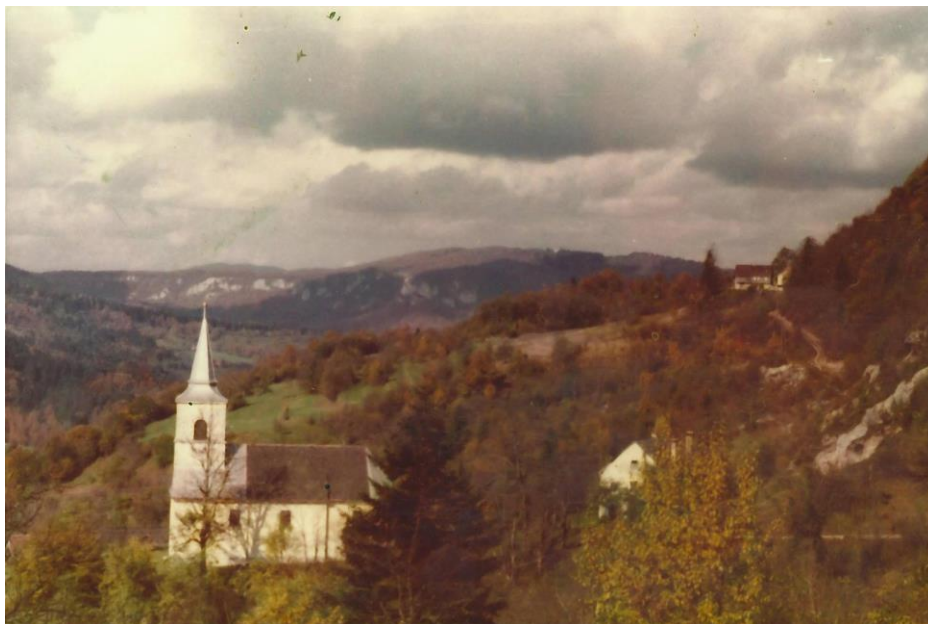
Slika 12. Crkva sv. Petra i Pavla u Podstenama