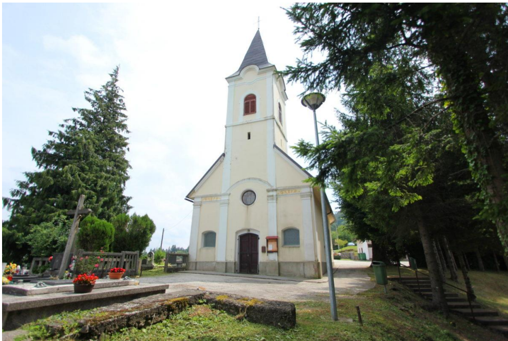
Slika 20. Crkva sv. Antuna Padovanskog u Skradu