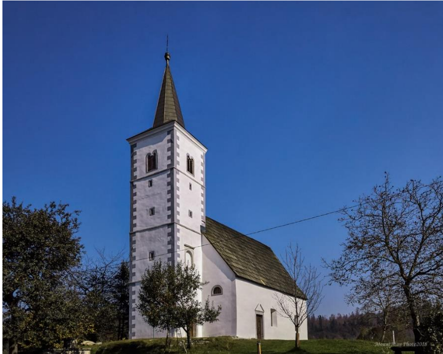
Slika 11. Crkva Majke Božje Škapularske (Karmelske) u Moravičkim Selima