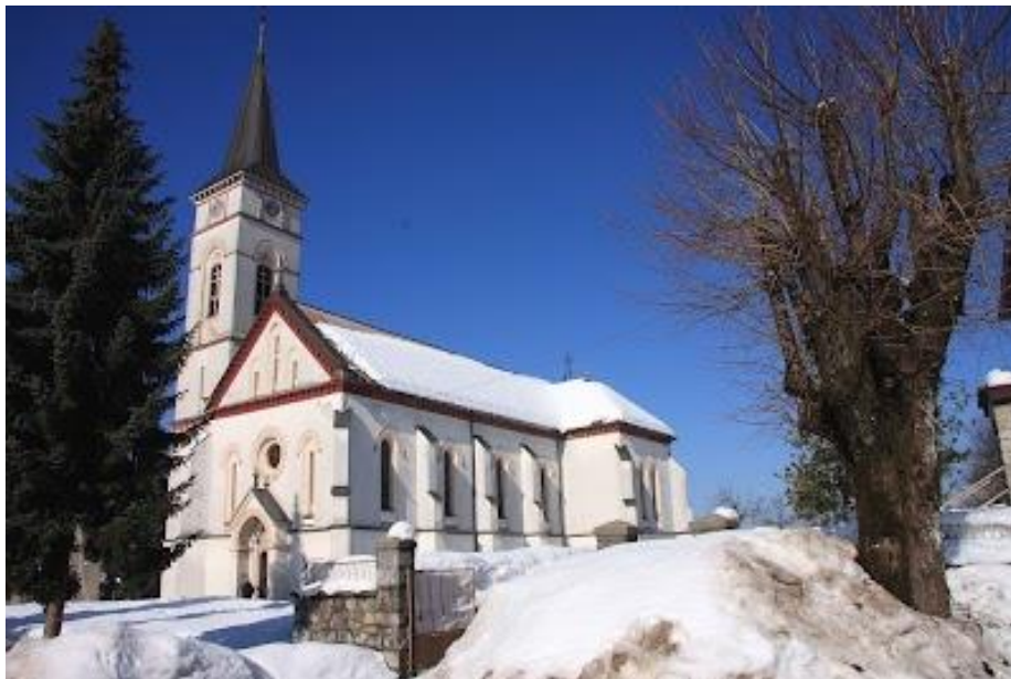
Slika 17. Crkva sv. Ivana Nepomuka u Vrbovskom