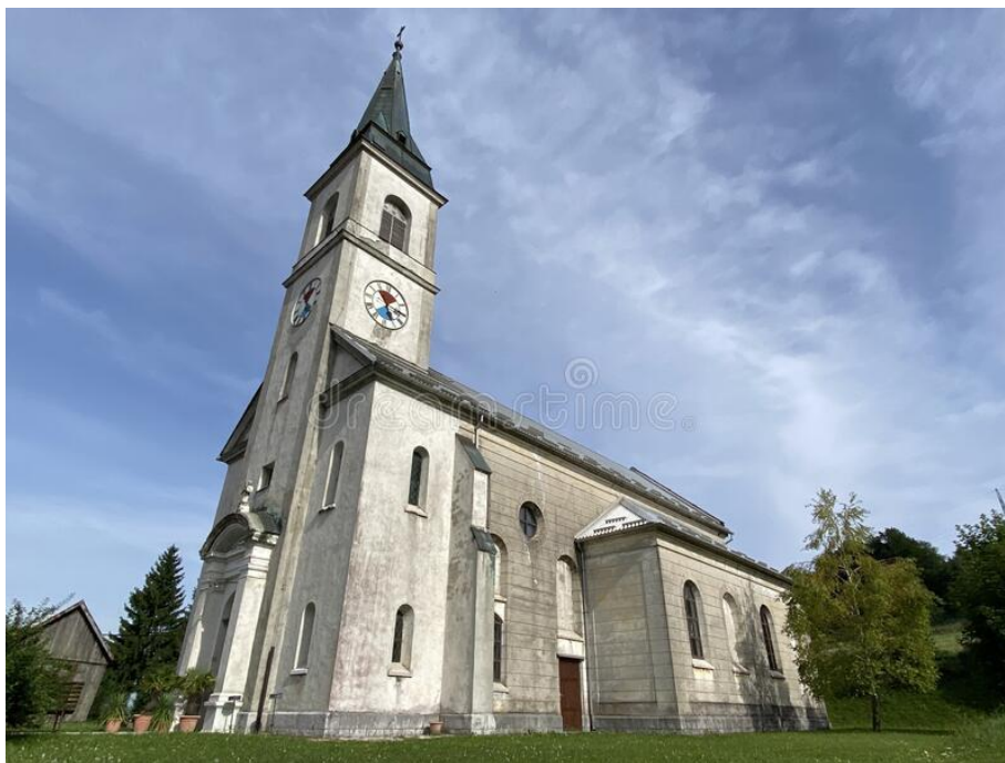
Slika 16. Crkva sv. Terezije Avilske u Ravnoj Gori