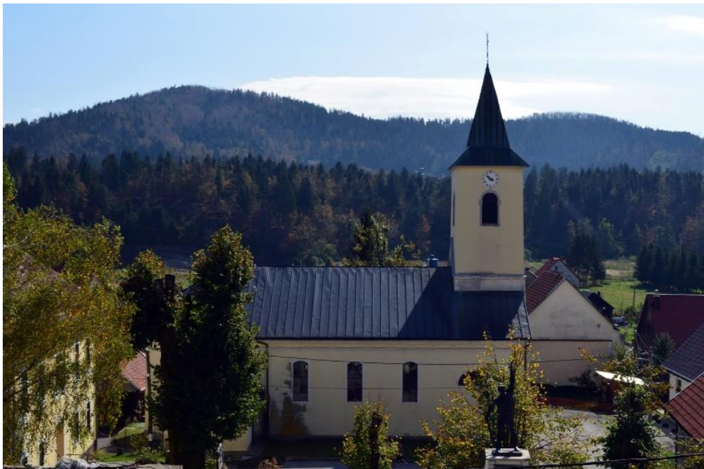
Slika 8. Crkva sv. Katarine u Lokvama