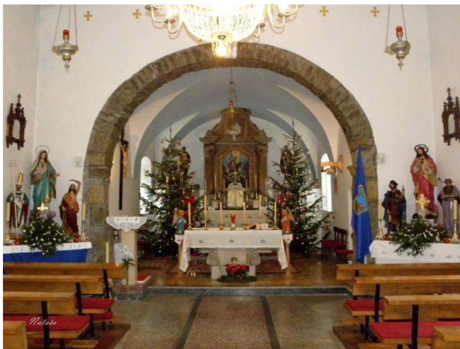
Slika 4. Sv. Juraj, Lič, unutrašnjost