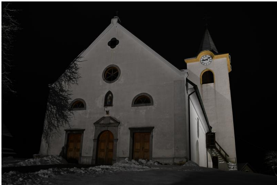
Slika 10. Crkva sv. Nikole u Brod Moravicama