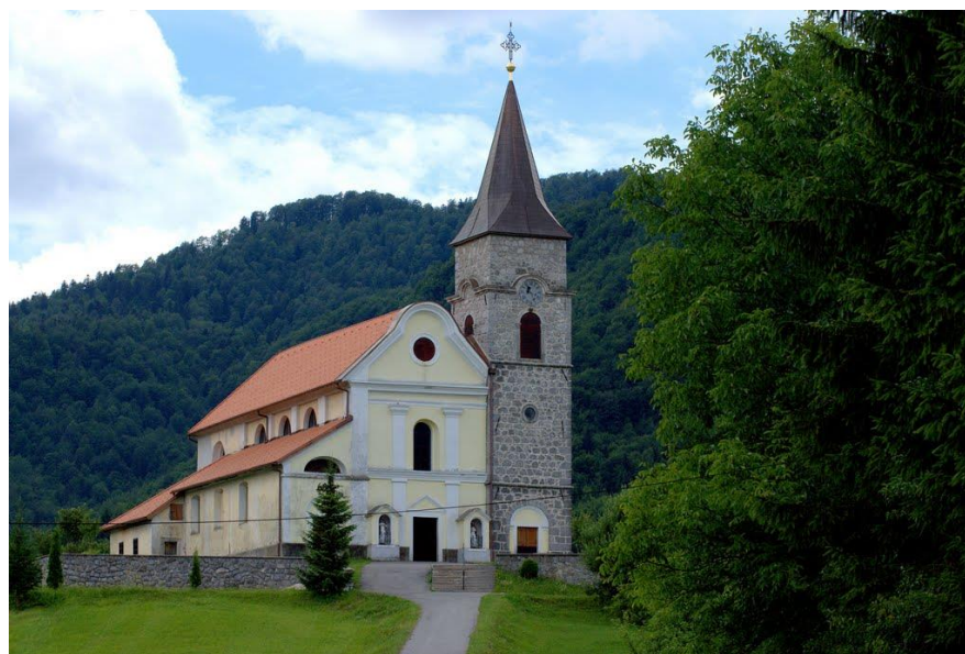
Slika 14. Crkva sv. Hermagore i Fortunata u Gerovu