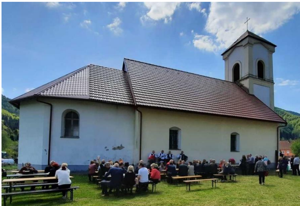
Slika 5. Crkva sv. Marije Magdalene u Brodu na Kupi