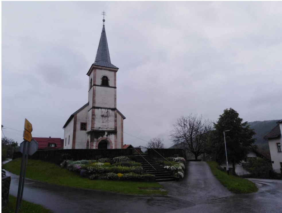
Slika 6. Crkva sv. Marije u Lukovdolu