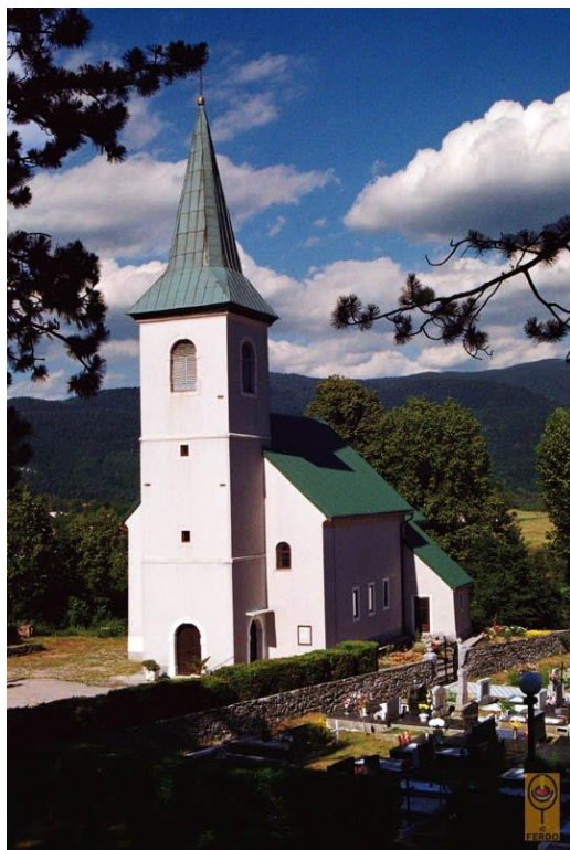
Slika 3. Sv. Juraj, Lič, zapadno pročelje i zvonik