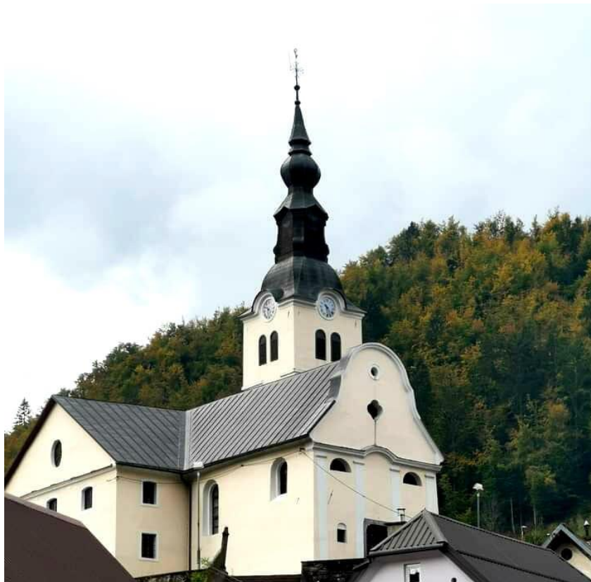
Slika 13. Crkva sv. Antuna Padovanskog u Čabru