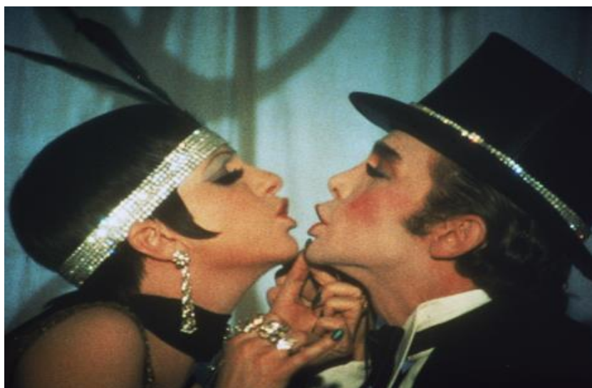
Slika 12 Money money - Cabaret (1972.)