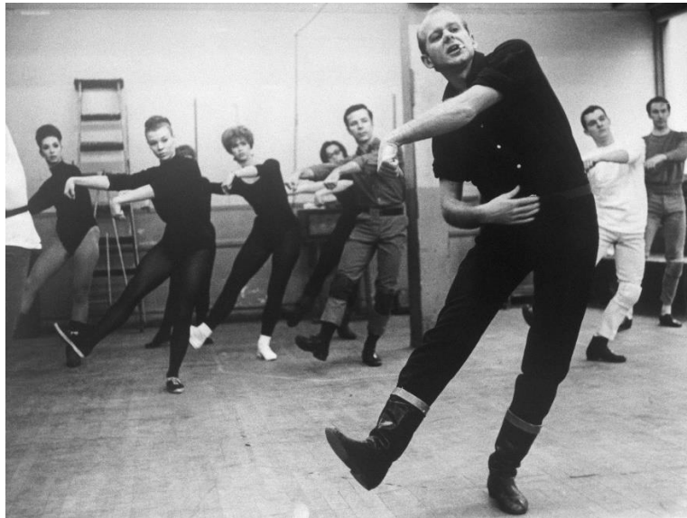
Slika 5. Bob Fosse