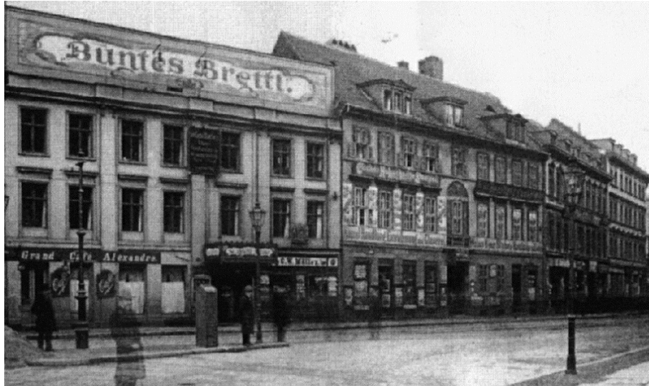
Slika 3. Überbrettl

O slabljenju popularnosti kabareta Biskupović piše sljedeće: