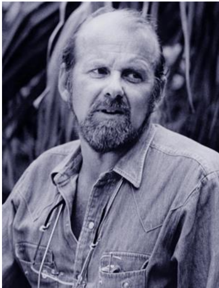
Slika 4. Bob Fosse

Godine 1969. po prvi se puta okušao u filmskom redateljstvu s filmom Sweet Charity . Uslijedio je, za njegovu redateljsku karijeru najznačajniji i najuspješniji Cabaret 1972. godine, Lenny 1974. godine, poluautobiografski All that Jazz 1979. i naposljetku Star 80 iz 1983. godine.