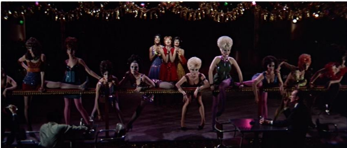
Slika 6 Hey. Big Spender - Sweet Charity (1969.)

The minute you walked in the joint I could see you were a man of distinction, a real big spender Good looking, so refined Say, wouldn't you like to know what's going on in my mind? So let me get right to the point I don't pop my cork for every gay I see Hey big spender! Spend a little time with me Wouldn't you like to have fun, fun, fun? How's about a few laughs, laughs? I can show you a good time Let me show you a good time