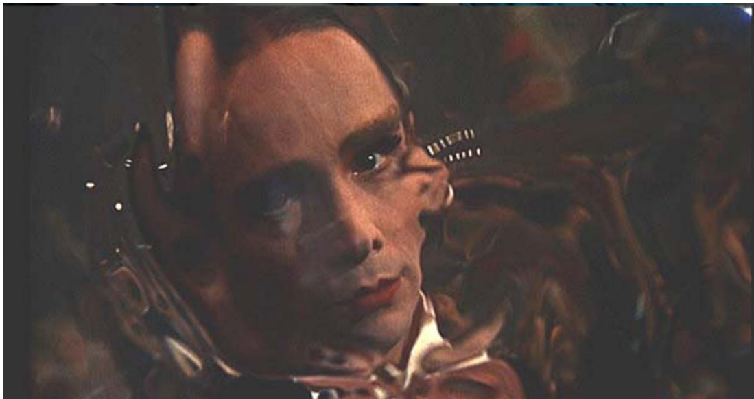
Slika 8 Willkommen - Cabaret (1972.)