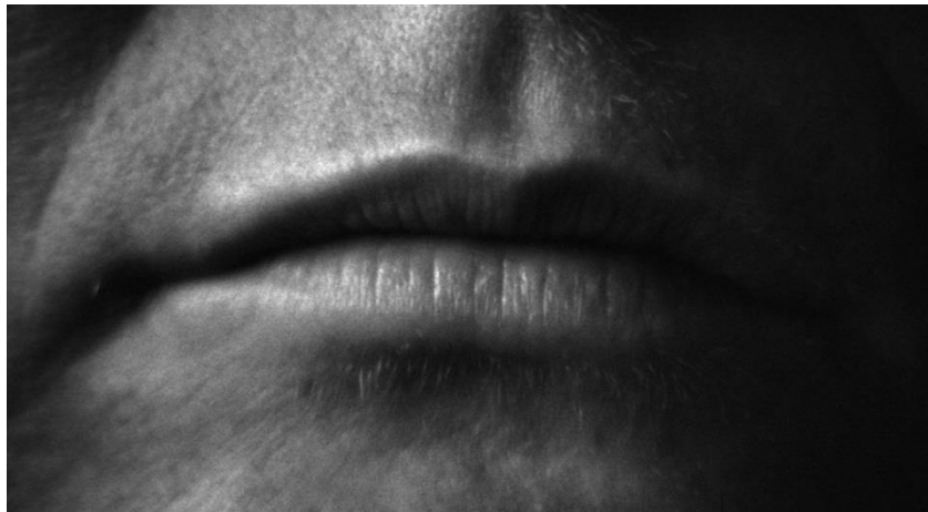
Slika 13 Lenny (1974.)

Već prvi kadar filma, detalj usana, podsjeća na film Građanin Kane i donosi zanimljiv preokret gdje kao gledatelj postajemo svjesni da te usne ne pripadaju Lennyju već Honey. Moguće da je Fosse takvim postupkom htio aludirati na moć izgovorenih riječi, ali i predstaviti Honey kao seks simbol. Isto tako, Fosse je izvršio svoju uobičajenu kontrolu nad svim elementima filma pa i posegao za strukturnim stilom Građanina Kanea , intervjuiranjem osoba bliskih Lennyju.