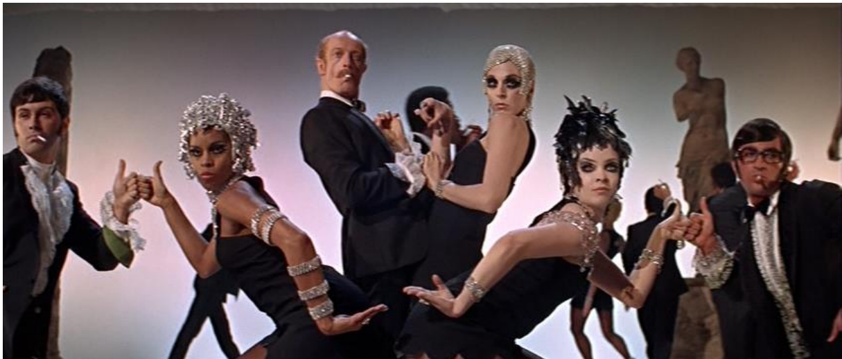
Slika 7 The Rich Man's Frug - Sweet Charity (1969.)

U najbizarnijoj i najliberalnijoj izvedbi The Rich Man's Frug , sve su djevojke obučeno slično no imaju individualne detalje. Uz poneke odjevne komade, bizarna je i šminka koja naglašava oči velikim umjetnim trepavicama te upotreba perika od ptičjeg pera i konfetnih vrpca.