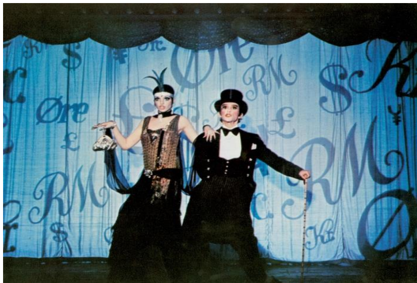
Slika 11 Money money - Cabaret (1972.)

And you need a companion You can ring (ting-a-ling) for the maid If you happen to be rich And you find you are left by your lover And you moan and you groan quite a lot You can take it on the chin Call a cab and begin to recover On your 14-karat yacht! What!?