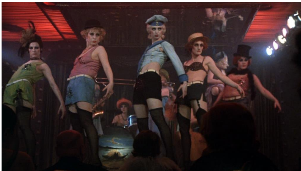
Slika 9 Kabaret djevojke - Cabaret (1972.)

Brojem se veselo pozdravlja publika Kit Kat Kluba gdje će se odvijati veći dio radnje, ali i publika Cabaret mjuzikla iza ekrana. Publika se pozdravlja na tri jezika: njemačkom, francuskom i engleskom. Spomenuti jezici odgovaraju kozmopolitskoj klijenteli u klubu te može dati naslutiti buduća neprijateljstva između triju nacionalnosti tijekom rata koji se približava. Izvedba se ponavlja i na samom kraju filma, ali na nešto ironičniji i manje veseo način, kada se daje dobrodošlica novoj Njemačkoj te pjesma biva nedovršenom. Prva sekvenca filma upoznaje nas s majstorom ceremonije, androgini simbolom dekadencije. Krupnim kadrom odaje se dojam važnosti njegove uloge i specifična izgleda. Sitne je građe, zalizane kose, jarkocrvenih usana Kupidova luka s teškim umjetnim trepavicama i rumenim obrazima. Kao majstor ceremonije, sposoban je angažirati svoju publiku i dovesti je do blještavila i nadolazeće propasti narušenog podzemlja weimarskog Berlina. Emcee u filmu predstavlja različite aspekte ljudske prirode i izlaže priče o hedonizmu i seksualnom oslobođenju.