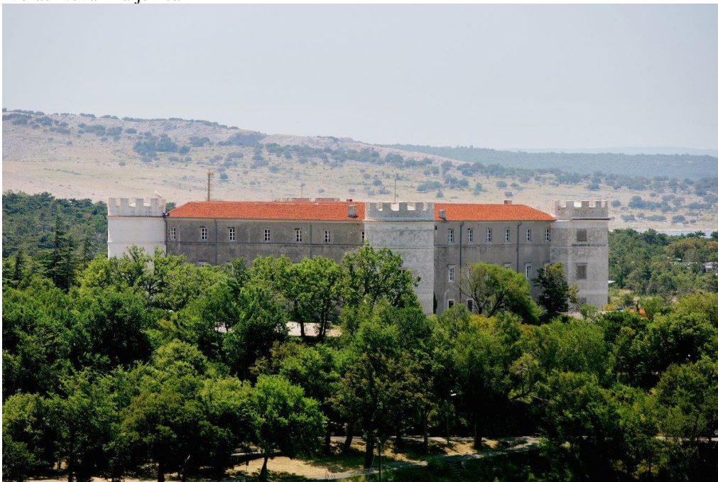
Slika 5. Dvorac Nova Kraljevica