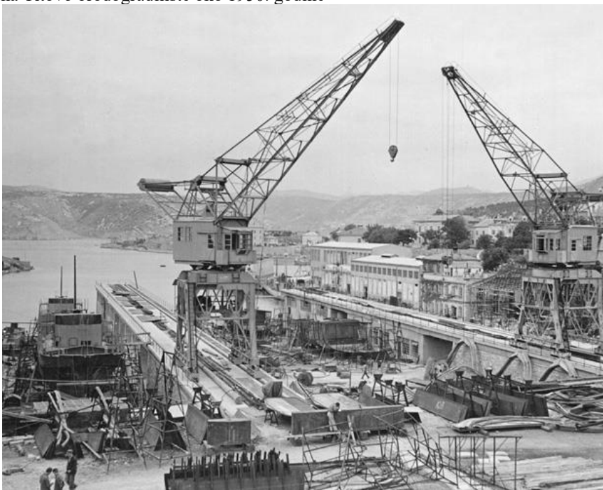
Slika 2. Pogled na Titovo brodogradilište oko 1950. godine