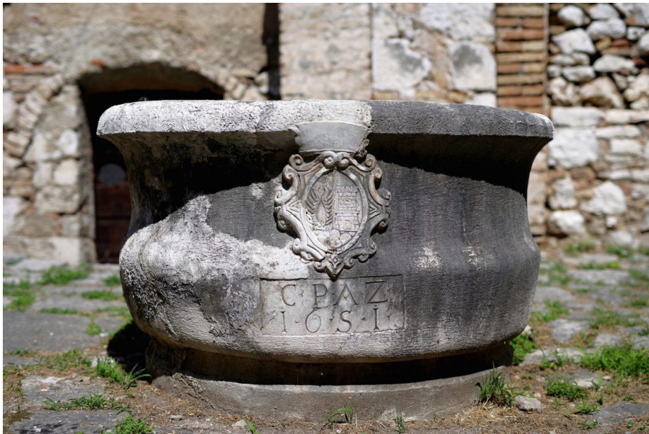
Slika 4. Bunar u starom kaštelu