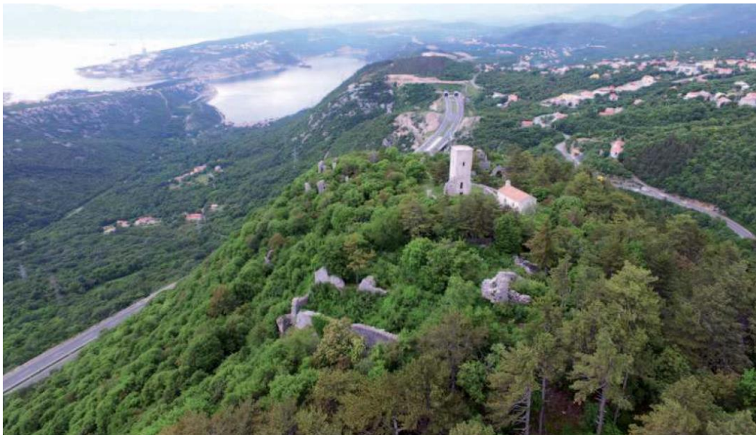
Slika 3. Hreljin