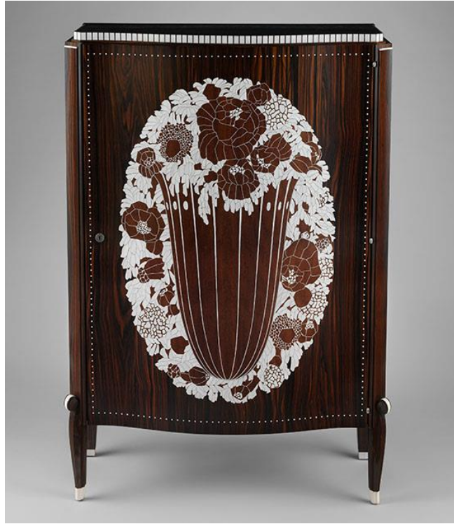
Slika 1. Emile Jacques-Ruhlmann, „Etat“ Cabinet, 1925.-26.

( https://www.thecollector.com/french-art-deco-furniture/ preuzeto 23.7.2022.)