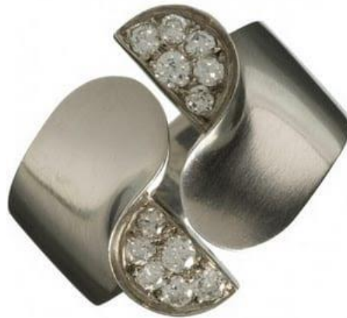
Slika 3., Bijoutiers-Artiste Jean Dupres, Dijamantni prsten (

koristili drago kamenje na skulpturalan način dodajući dijamante i druge dragulje kao detalj, ali ne i kao glavni fokus (Slika 3.).