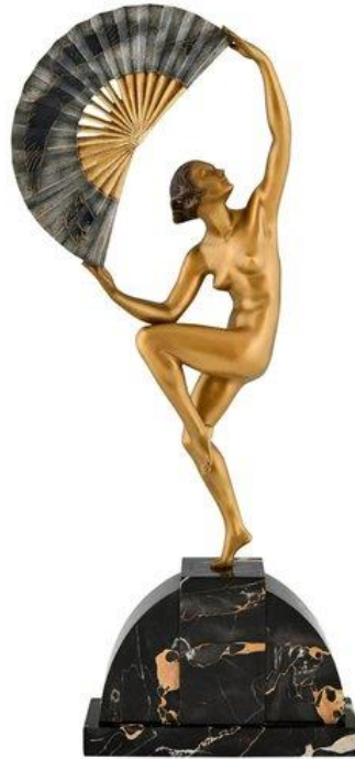
Slika 5. Marcel Bouraine, plesačica sa lepezom, 1930.

tip skulptura upotrebljavao bila je slonovača i hladno obojana bronca. 30 S tim da su tematski Njemački umjetnici preferirali subjekte koji prikazuju tropske, atletske i sportske figure. Dok su Francuzi preferirali subjekte prikazane u neozbiljnim i teatralnim pozama. 31 Jedan od umjetnika koji je za svoja djela koristio kombinaciju slonovače i bronce bio je Marcel Bouraine. Karakteristika njegovog stvaralaštva bilo je prikazivanje amazonki, plesačica te figura iz kazališta. 32