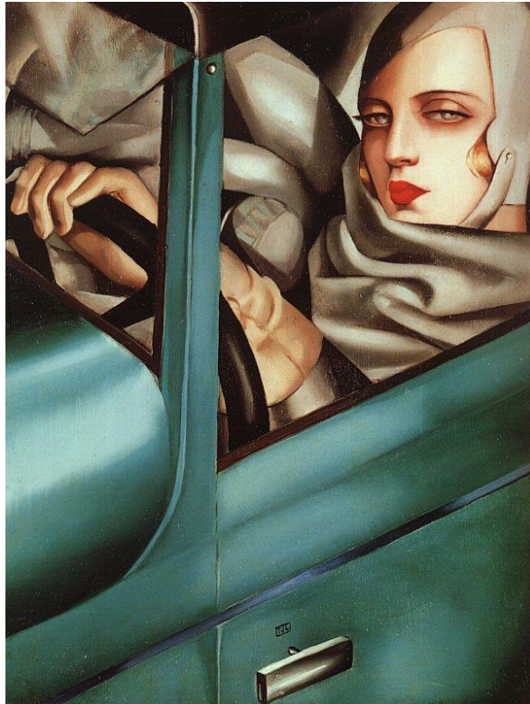
Slika 4. Tamara de Lempicka, Autoportret (Tamara u zelenom Bugattiu), 1929., privatna kolekcija ( http://www.avantartmagazin.com/tamara-de-lempicka-glamurozna-zvezda-medjuratnog-perioda/tamaradelempicka-self-portrait-in-green-bugatti-1925/

učitelji Maurice Denis te francuski kubistički slikar i kipar Andree Lhote. 26 Slikala je razno razne teme pod snažnim utjecajem kubizma i neoklasicizma. 27 Sudjelovala je na Pariškoj izložbi 1925. koja je osim za naziv art décoa i za stvaralaštvo Tamare de Lempicke bila izuzetno bitna. Izložba označava prekretnicu u njezinom životu, zahvaljujući izložbi stiče popularnost unutar krugova Pariške elite, te postaje jedna od vodećih slikarica art décoa. 28