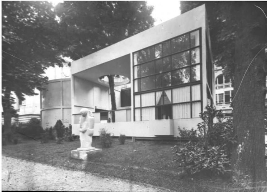
(Slika 6.) Le Corbusier, L'esprit Nouveau, 1920.

preuzela vodeću ulogu u ostalim umjetničkim područjima art décoa, arhitektura je bila predvođena Američkim građevinama. Paviljoni i druge arhitektonske strukture, izrađene za Parišku izložbu 1925., stvorene su kao privremene strukture što je rezultiralo u tome da su ih kasniji arhitekti i dizajneri poznavali isključivo sa fotografija i crteža. 35 Jedan od bitnijih paviljona bio je Le Corbusierov L'esprit Nouveau (Slika 6.). Paviljon je popunio sa elementima masovne proizvodnje te oduzeo sve elemente koji su prije bili vidljivi u arhitekturi, a koje je on smatrao ne potrebnom dekoracijom. 36