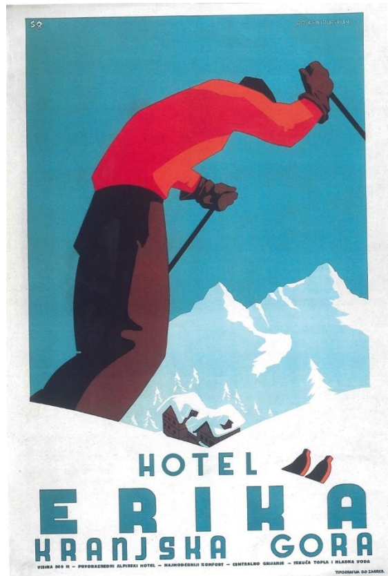
Slika 12., Sergije Glumac, plakat za „Hotel Erika“, 1935.