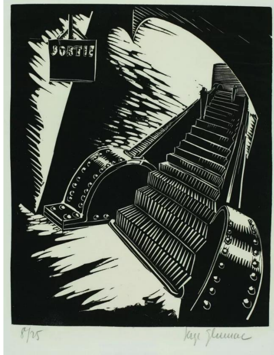
Slika 11. Izlazne stepenice metroa, grafička mapa „Le Metro“, Muzej suvremene umjetnosti, Zagreb, 1928. ( https://grazia.hr/retrospektiva-sergije-glumac-galerija-klovicevi-dvori/

linorezima prikazuje situacije u metrou poput čekanja vlaka, dolaska vlaka na stajalište te kontuktera koji stoji na vratima. Pojedini prikazi sadrže likove poput konduktera ili putnika no karakteristično za Glumca ni na jednoj grafici nije prikazana gužva već se radi o malom broju likova. Kod nekih linoreza iz mape „Le Metro“ likovi su izostavljeni u potpunosti i prikazane su scene poput praznih stuba (Slika 11). 76