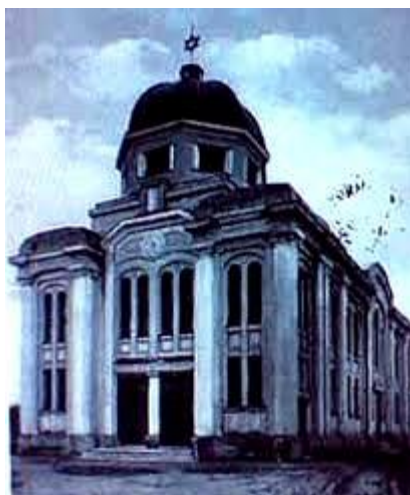
Slika 24., Fran Funtak, Nova sinagoga u Vinkovcima, pročelje, razglednica iz međuratnog razdoblja