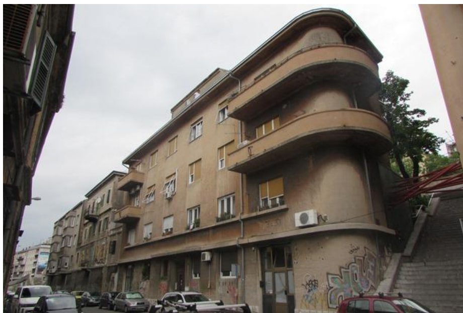
Slika 22., Boreno Emili, stambeno-poslovna trokatnica Emili, Šetalište 13. divizije 9., Rijeka ( https://www.rijeka.hr/mjesni-odbori/pecine/zanimljivosti/stambena-arhitektura-pecina/

Zagreb i zagrebački arhitekti igraju veliku ulogu u arhitekturi Sušaka međuratnog razdoblja. Arhitekti koji su bili najaktivniji na području Sušaka bili su Zlatko Prikriilo, David Bunette i Boreno Emili. Osim navedenih arhitekata bitno je i pouzće Ferobetton te Društvo Kvarner za podizanje Primorja. 129 Pluralistički utjecaj koji je uočljiv na Sušačkim zgradama širi se područjem putem, tada talijanske, Rijeke.