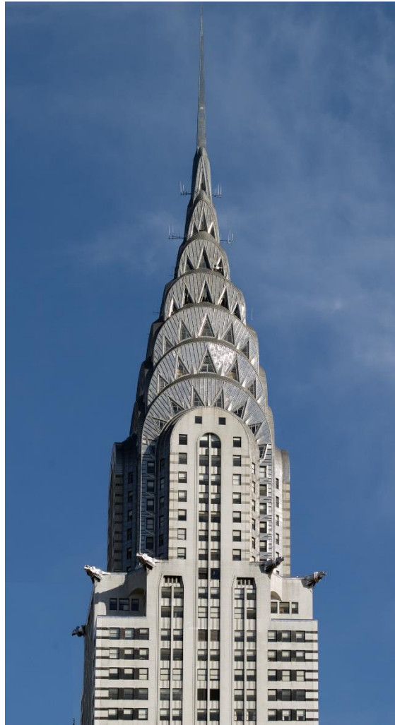
Slika 7., William Van Alen, Chrysler Building, 1927., Manhattan, New York ( https://study.com/academy/lesson/architect-william-van-alen-chrysler-building-works-biography.html Preuzeto: 26.7.2022.)

umjetnosti Azteca, Maja te Afričke kulture. 38 Možda najbitniji te reprezentivni primjer nebodera koji su nastali u ozračju art décoa bio bi Chrysler Building u Manhattenu (slika 7.).