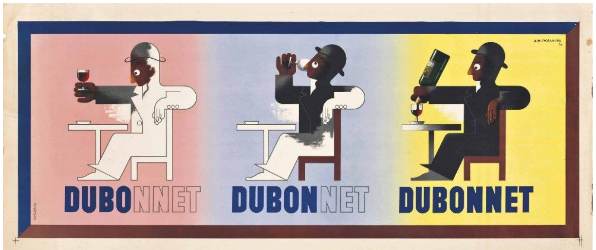
Slika 2. A.M. Cassandre, Dubo-Dubon-Dubonnet, 1932.

( http://www.artnet.com/artists/am-cassandre/dubo-dubon-dubonnet-WYdYeSKmyCgaT_4yZwSF2g2 preuzeto 23.7.2022.)