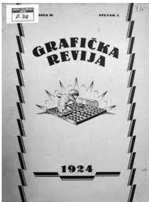
Slika 13., Eugen Sekler, naslovnica Grafičke revije, 1., 1924.

najizraženije su značajke art décoa. 79 Među prvim radovima koje izvodi za vrijeme boravka u Zagrebu je naslovnica za časopis Grafička revija koja se datira u 1924. godinu. Grafička revija bio je strukovni časopis čija je naslovnica bila dizajnirana svaki put od drugog umjetnika. Seklerov dizajn za naslovnicu prvog sveska časopisa prikazuje nagog dječaka koji je leđima okrenut od promatrača, a prikazan je klečeći ispred kutije tipografskog materijala (Slika 13). Dječaka uokviruju nazubljeni dekorativni elementi što odgovara stilu ekspresionizma. Idžojić kao art déco elemente u djelu izdvaja ukošen kut gledanja, udaljenost prikaza od gledatelja te oštre linije. Dinamični prikaz koji je dodatno izražen zbog crnim otiskom koji se nalazi na podlozi žuto zelene boje također je karakteristika art déco stila. 80