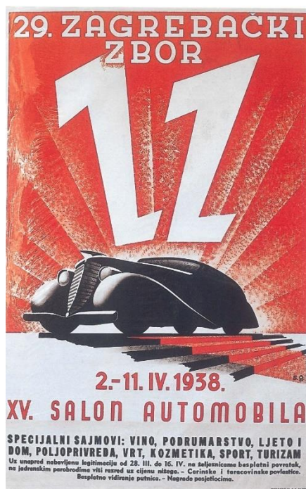
Slika 10. Sergije Glumac, XV. Salon automobila, 1938.

( https://mrezadizajna.com/katalog/plakat-za-29-zagrebacki-zbor-xv-sajam-automobila