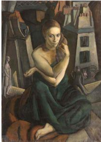
Slika 20., Milivoj Uzelac, Sfinga velegrada, 1922.

Gogha. 116 No za Šumanovićevo slikarstvo bitniji je kasniji period školovanja koji se odvija u Francuskoj kod Andrea Lhotea. 117 U djelima oba umjetnika vidljiv je odmak od kubizma i pomak ka postkubističkoj dekorativnosti koja je početkom 20.-ih godina vladala u Parizu. 118 Uzelac u to doba stvara slike sa neobičnim temama, za Hrvatsko slikarstvo, s prikazima poput cirkusa, dinamičnog urbanog života, rasvjeta i reklama. 119