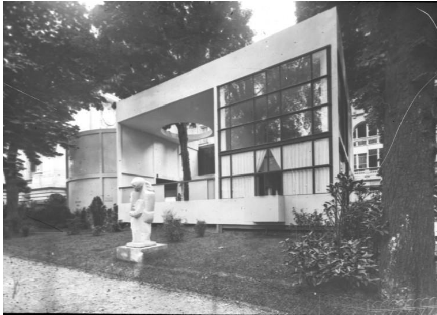
(Slika 6.) Le Corbusier, L'esprit Nouveau, 1920. ( https://www.archdaily.com/883336/le-corbusiers-pavillon-de-lesprit-nouveau-named-one-of-20-designs-that-defined-the-modern-worl Preuzeto: 26.7.2022.)

preuzela vodeću ulogu u ostalim umjetničkim područjima art décoa, arhitektura je bila predvođena Američkim građevinama. Paviljoni i druge arhitektonske strukture, izrađene za Parišku izložbu 1925., stvorene su kao privremene strukture što je rezultiralo u tome da su ih kasniji arhitekti i dizajneri poznavali isključivo sa fotografija i crteža. 35 Jedan od bitnijih paviljona bio je Le Corbusierov L'esprit Nouveau (Slika 6.). Paviljon je popunio sa elementima masovne proizvodnje te oduzeo sve elemente koji su prije bili vidljivi u arhitekturi, a koje je on smatrao ne potrebnom dekoracijom. 36