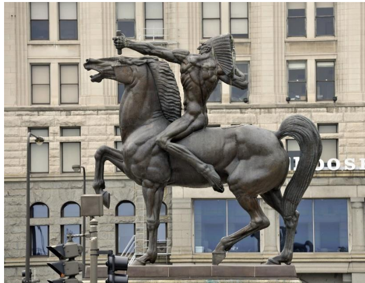
Slika 19., Ivan Meštrović, Indijanac s kopljem, 1928., Chicago, SAD

Osim na izložbi u Parizu velik uspjeh postigao je Meštrović i u SAD-u, u vidu 15 samostalnih i skupnih izložbi. 106 Veliku narudžbu osigurao je u Chicagu 1925. kada je nakon održavanja izložbe dobio narudžbu za Indijanca (Slika 16). 107