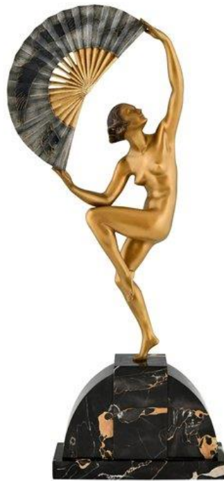
Slika 5. Marcel Bouraine, plesačica sa lepezom, 1930.

tip skulptura upotrebljavao bila je slonovača i hladno obojana bronca. 30 S tim da su tematski Njemački umjetnici preferirali subjekte koji prikazuju tropske, atletske i sportske figure. Dok su Francuzi preferirali subjekte prikazane u neozbiljnim i teatralnim pozama. 31 Jedan od umjetnika koji je za svoja djela koristio kombinaciju slonovače i bronce bio je Marcel Bouraine. Karakteristika njegovog stvaralaštva bilo je prikazivanje amazonki, plesačica te figura iz kazališta. 32