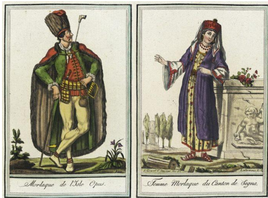
Prilog 2: Primjer nošnje Morlaka i Morlakinje ( https://povijest.hr/drustvo/narodi/tko-su-bili-morlaci-u-sluzbi-mletacke-vojske/ )

Talijanima koji su ju ismijavali. Također se spominje da se odjeća Morlaka razlikuje od mjesta do mjesta. 72