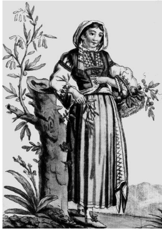
Prilog 3: Morlakinja iz okolice Zadra, gravura iz 18. st. ( https://www.enciklopedija.hr/Ilustracije/HE7_0996.jpg )