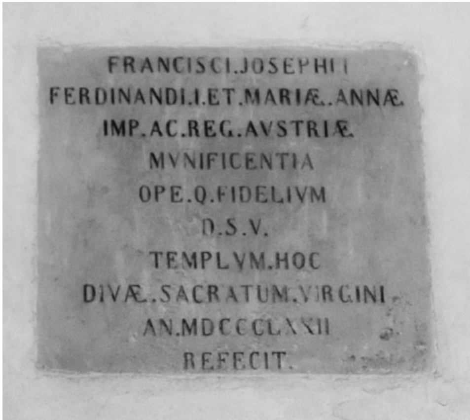
Sl. 5. Posvetna ploča crkve Rođenja BDM (1872.)

Bosco (5. ožujka 1860.). 52 Tijekom obnove 1870. godine, 53 a koju je na molbu župnika Šime Valkovića financijski potpomogao u iznosu od 100 forinti austrijski car i hrvatsko-ugarski kralj Franjo Josip I., na crkvu je postavljena posvetna ploča (1872.) s »novim« titularom, odnosno od toga je vremena crkva posvećena Blaženoj Djevici Mariji (Sl. 5).