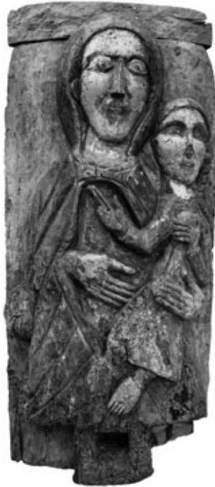
Sl. 1. Anonimni drvorezbar, reljef Bogorodice s Djetetom, crkva Rođenja BDM, Lopar

Jednobrodna crkva Rođenja Blažene Djevice Marije u Loparu s istaknutom pravokutnom apsidom i zvonikom dozidanim uz pročelje mjesto je okupljanja i slavljenja blagdana Rođenja Marijina svake godine na dan 8. rujna. Zavjetna se crkva u puku naziva crkvom Male Gospe ili U Gospoje , a na njezinu se središnjem oltaru, u gornjem dijelu oltarne atike, čuva drveni rezbareni polikromirani reljef s prikazom majke i djeteta (Sl. 1).