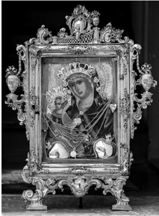
Sl. 6. Čudotvorna Gospa Rapska, crkva samostana sv. Andrije, Rab