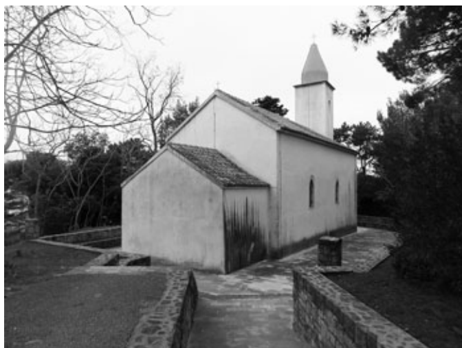
Sl. 2. Crkva Rođenja Blažene Djevice Marije, Lopar

Navedene je zaključke, a koji se temelje na propitivanju ikonografije prikaza na reljefu, bilo nužno provjeriti sustavnim istraživanjem povijesti titulara crkve u Loparu. Posebice s obzirom na to da izvori jednoznačno upućuju da danas zavjetna marijanska crkva u srednjem vijeku ipak nije bila posvećena Rođenju Blažene Djevice Marije (Sl. 2).