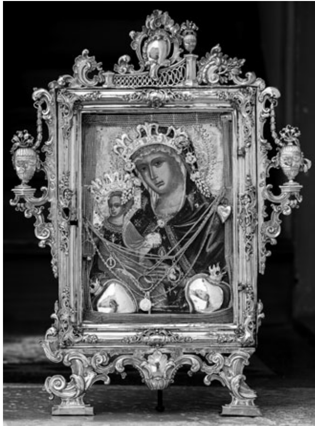
Sl. 6. Čudotvorna Gospa Rapska, crkva samostana sv. Andrije, Rab