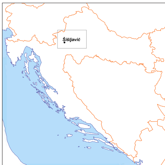
Karta 1: Šišljavić na karti Republike Hrvatske.