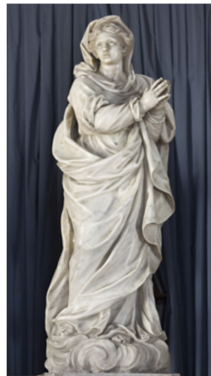
5. Orazio Bonetti, Bogorodica s Djetetom , salezijanski samostan, San Vito al Tagliamento