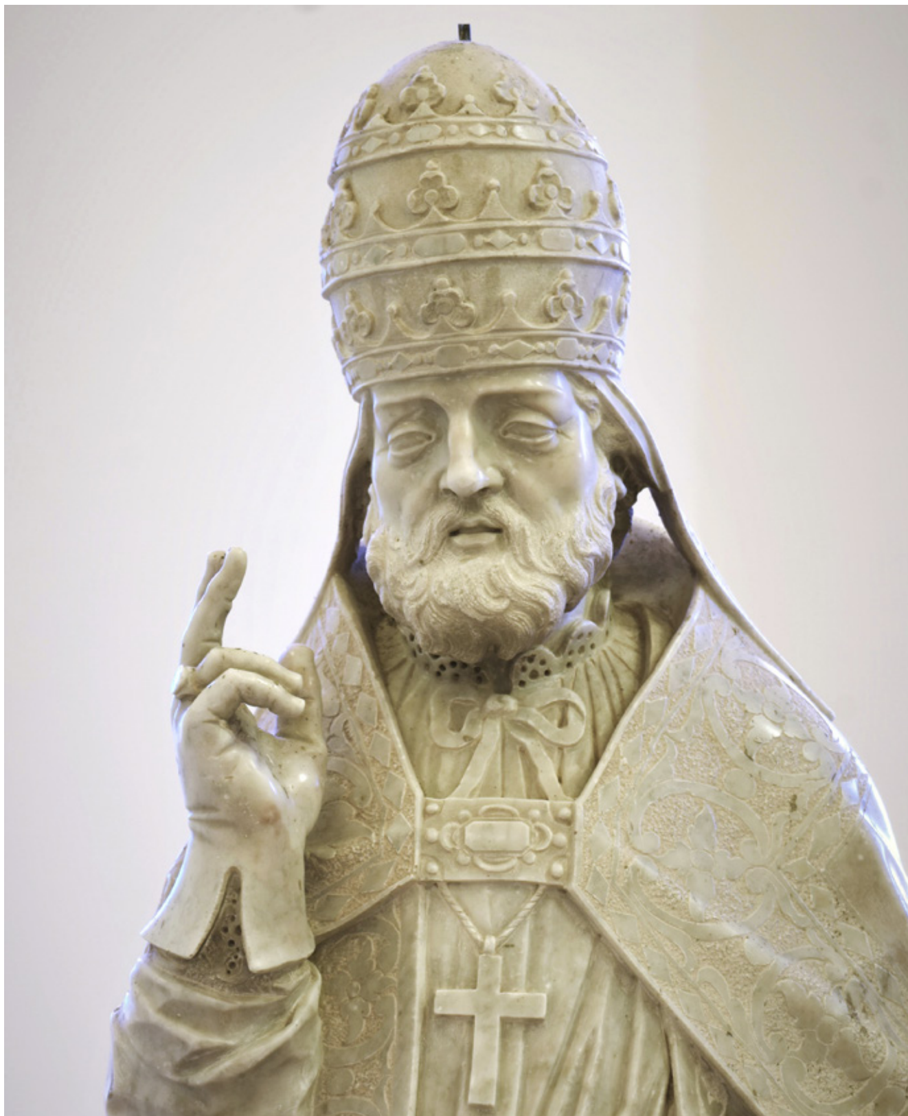
22. Orazio Bonetti, Sveti Silvestar , župna crkva, Lovreć pokraj Imotskog, detalj, (foto: D. Tulić) Orazio Bonetti, Saint Sylvester , parish church, Lovreć near Imotski, detail