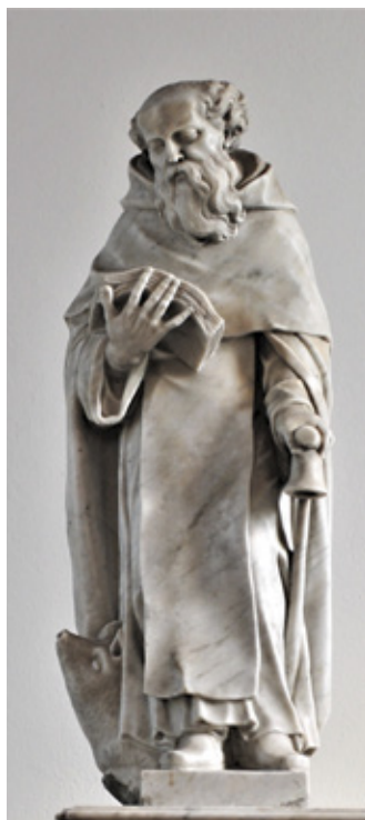
17. Orazio Bonetti, Sveti Antun opat , župna crkva, Orlec (Cres)

Orazio Bonetti, Saint Anthony the Abbot , parish church, Orlec (Cres)