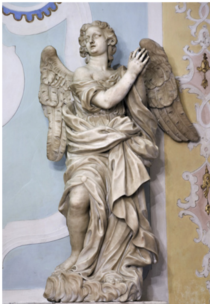
1. Orazio Bonetti, Anđeo , župna crkva, Talmassons

Orazio Bonetti, Angel , parish church, Talmassons