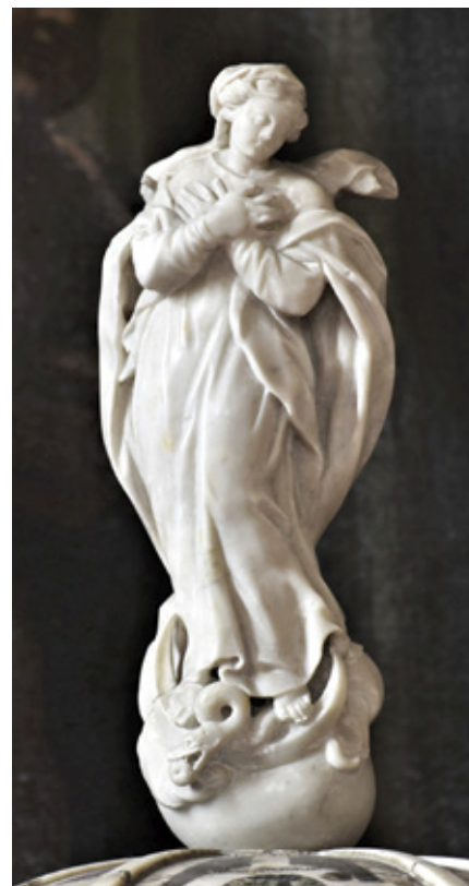
23. Orazio Bonetti, Anđeo , samostanska crkva Svetog Mihovila, Zadar

Orazio Bonetti, Angel , monastery church of Saint Michael, Zadar