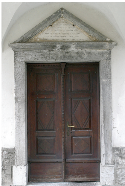
Slika 8. Delnice, portal s posvetnim natpisom biskupa Ivana Krstitelja Ježića i župnika Nikole Cara, 1829. godina, foto: Damir Krizmanić