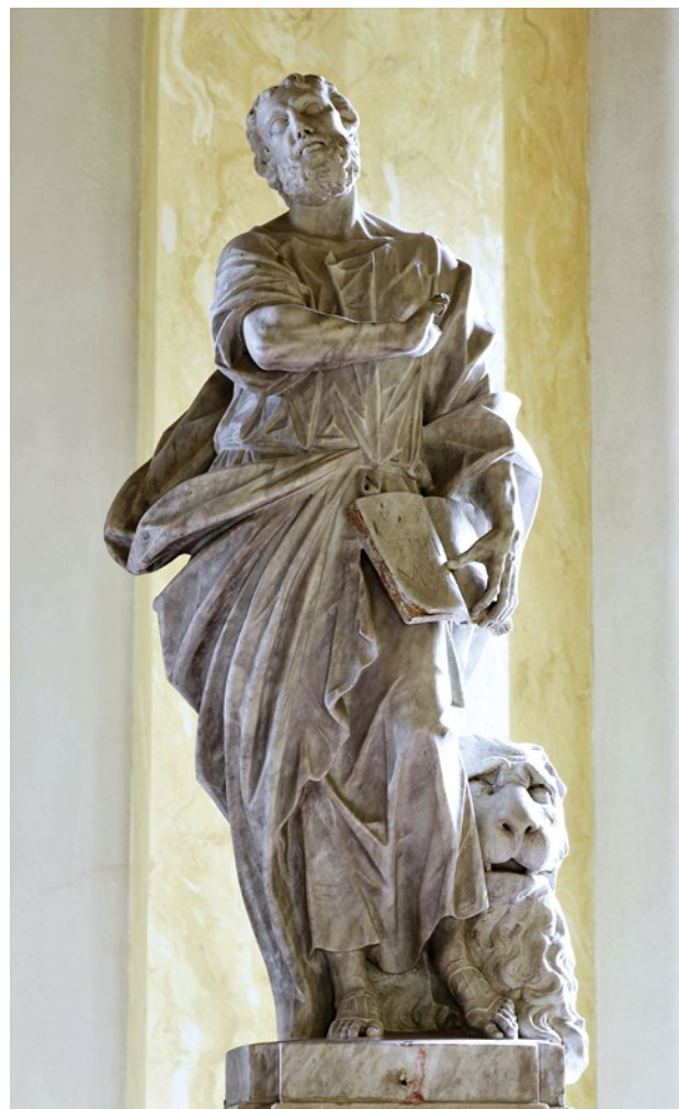
2. Antonio Michelazzi, sveti Ivan Krstitelj , župna crkva, Cinto Caomaggiore

Antonio Michelazzi, Saint John the Baptist , parish church of Cinto Caomaggiore