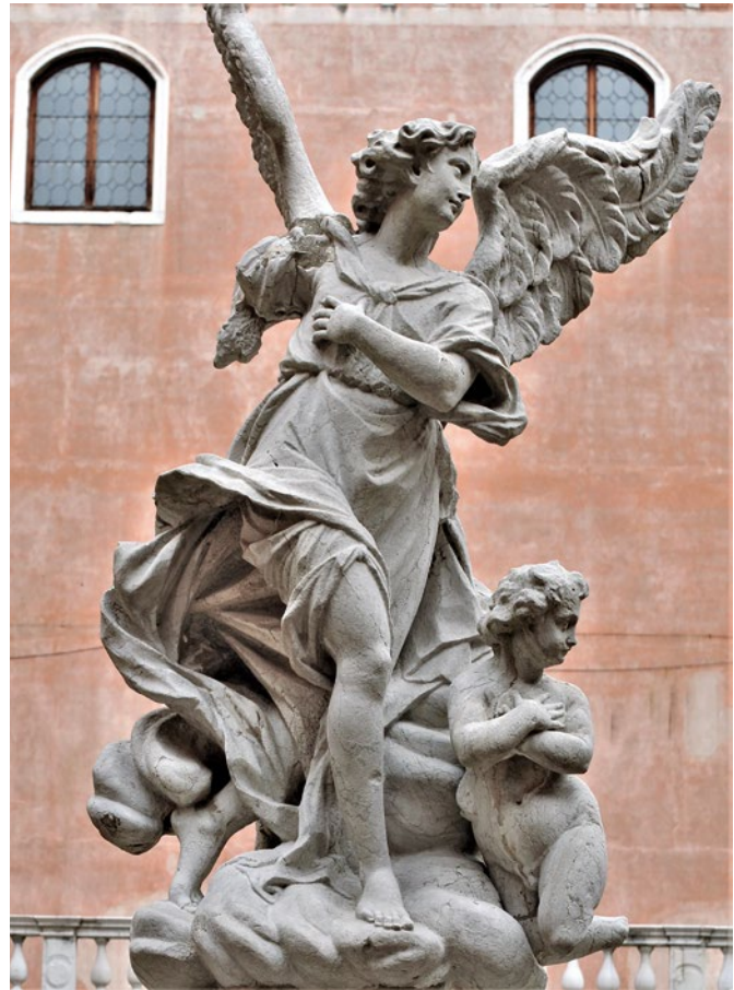
23. Francesco Cabianca, Anđeo , Sveti Šime, Zadar

Francesco Cabianca, Angel , St Simeon, Zadar