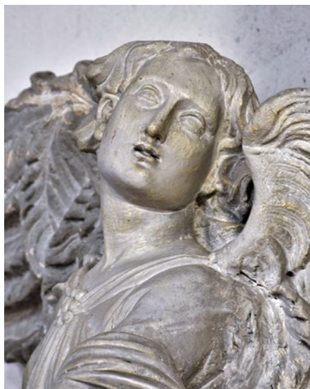
Francesco Cabianca, Angel , St Simeon, Zadar