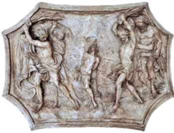
28. Francesco Cabianca, terakotni model za reljef Bičevanje svetog Tripuna , Aartsbisschoppelijk Museum, Utrecht (SUSANNA ZANUSO /bilj. 19/, 304)

Francesco Cabianca, terracotta model for the relief Flagellation of Saint Tryphon , Aartsbisschoppelijk Museum, Utrecht