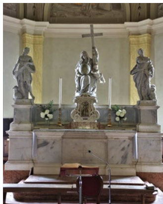
High altar, parish church of Cinto Caomaggiore