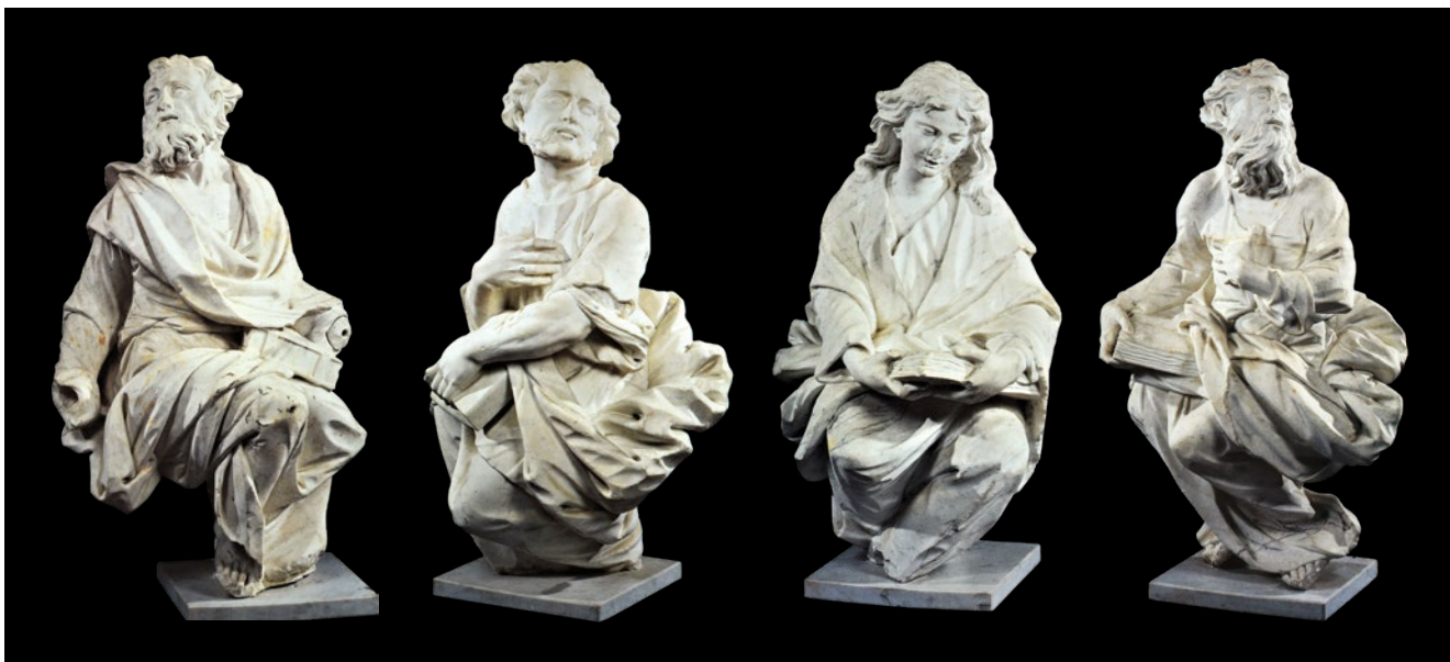
16. (a, b, c, d) Francesco Cabianca, Evangelisti , aukcijnska kuća Semenzato (izvor: Semenzato /bilj. 31/ lot 118)

Francesco Cabianca, The Evangelists , Semenzato auction house