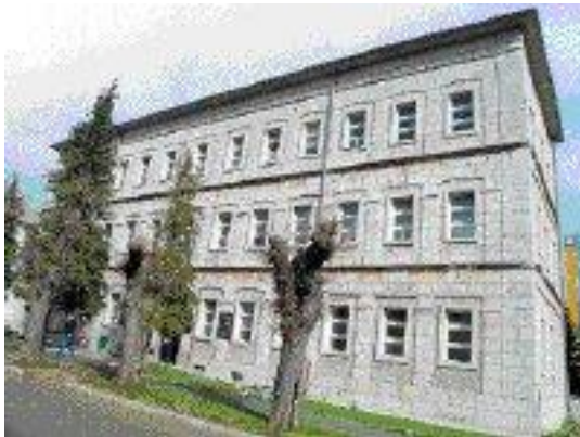
Slika 3. Đački dom u Gospiću