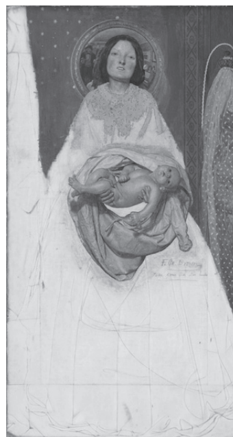
Sl. 1. Gore: Jenna Coleman kao kraljica majka, Viktorija , 2. sezona, 6. epizoda, ITV, 2017. Screenshot (DVD). Dolje: Ford Madox Brown, Take your Son, Sir! (Uzmite svoga sina, gospodine!) , 1851. (izvor: Tate Britain online).

Povijesni izvori također pokazuju kako je niz irskih uglednika pokušavao utjecati na vladu putem otvorenih pisama kraljici u kojima su joj se obraćali, poput tuamskog katoličkog nadbiskupa Johna MacHalea, kao “brižnoj majci svoga naroda” (Murphy, 2001: 68), apelirajući na njezine majčinske osjećaje. Nedostatak pravovremene reakcije same kraljice (istočnu, gladu najmanje načetu, Irsku prvi puta će posjetiti tek sredinom 1849, i to brodom, držeći se na sigurnoj udaljenosti od potencijalno opasne gomile) i neadekvatan odgovor londonske vlasti postupno su stvorili irsku nacionalističku sliku o kraljici Viktoriji kao “kraljici gladi” (eng. the Famine Queen ), sliku koju će na efektan način iskoristiti irska aktivistica i Yeatsova muza Maude Gonne. U, od britanske vlade ekspresno zabranjenom, polemičkom članku naslovljenom “Kraljica gladi” povodom Viktorijinog drugog državnog posjeta Irskoj 1900. upriličenog prvenstveno kako bi se Irce vrbovalo za britanski rat s Burima u Južnoj Africi, Gonne jetko izjavljuje: