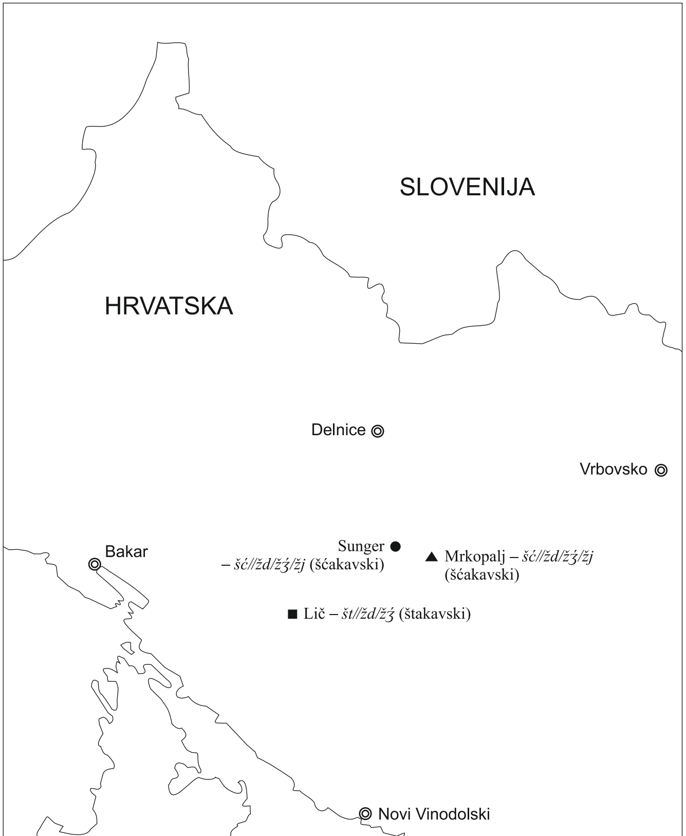
Štakavizam/šćakavizam u štokavskim ikavskim govorima Gorskoga kotara