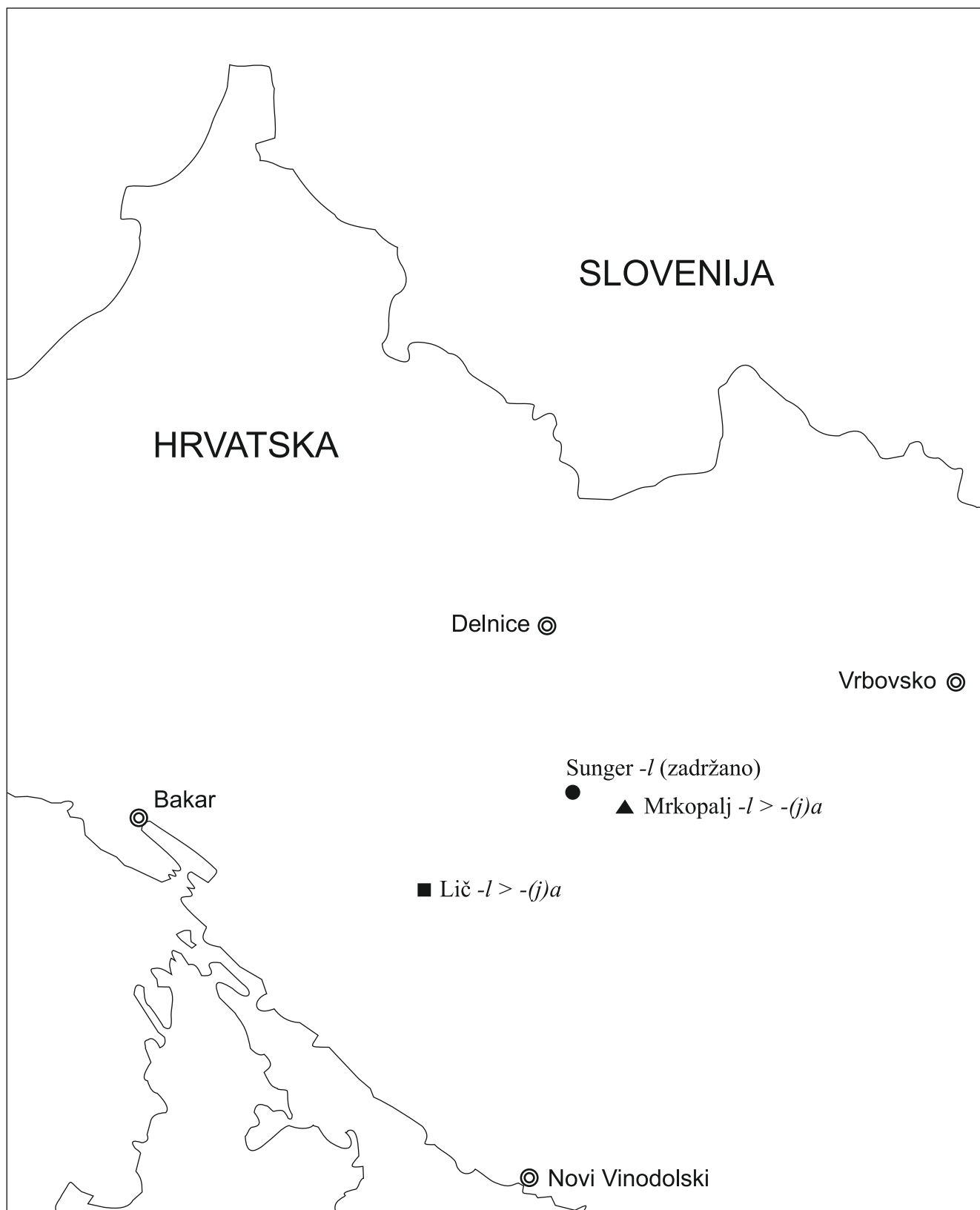
Dočetno -l u štokavskim ikavskim govorima Gorskoga kotara