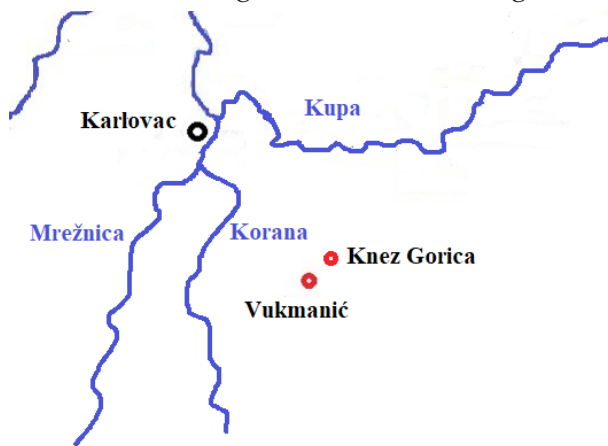
Karta 2. SmjeŹtaj Vukmanića i Knez Gorice

na i Banovine, Vojničem, Gornjom Trebinjom, Sjeniĉakom, Źivković Kosom (Petrović 1978:7–20). Osim Źtokavskoga Tušilovića, prema zapadu ih u meĉurijeĉju Korane i MreŹnice omeĉuju govori Ladvenjka, Barilovića i okolnih zaselaka, odnosno govori »kajkavsko-ikavskoga narjeĉja, koje je nastalo na ĉakavskoj bazi« (TeŹak 1959:456). Sa sjeverne strane graniĉe taĉoĉer s govovima razliĉitih osnovica: sa Źtokavskim Popović Brdom i mi-jeŹanim, kajkavsko-ĉakavskim govovima karlovaĉkoga Pokuplja.