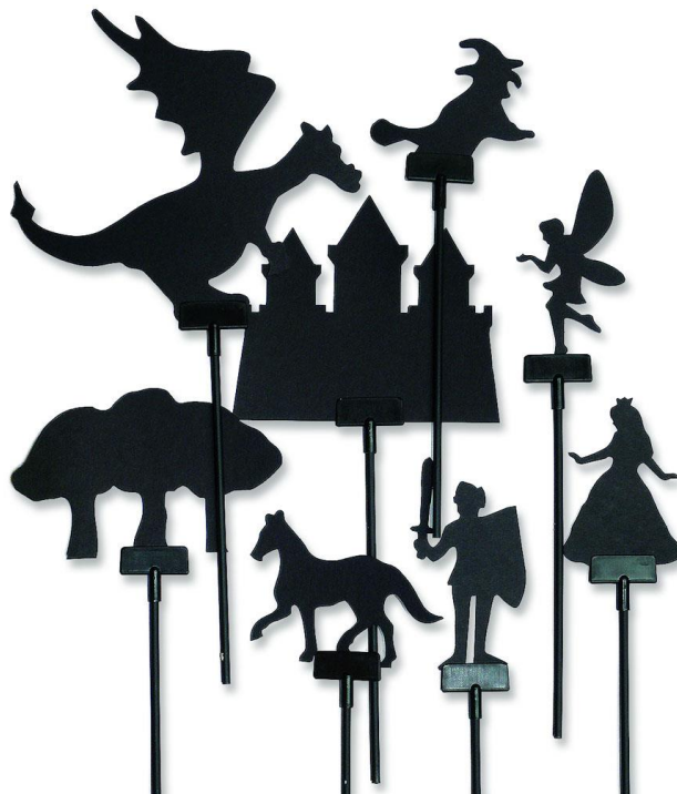
Slika 4. Lutke sjene