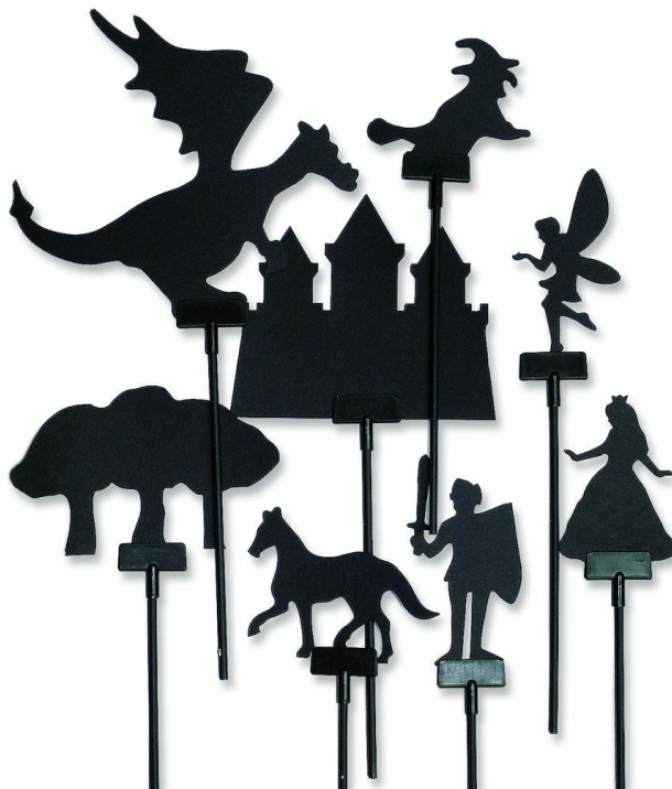
Slika 4. Lutke sjene