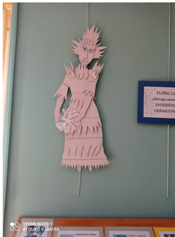
Slika 3. Plošne lutke (izvor: https://knjiznica-bjelovar.hr/obavijesti/plosne-lutke-otkrivaju-zanimljivosti-andersenovih-i-grimmovih-bajki/ , preuzeto 7.12.2022.)