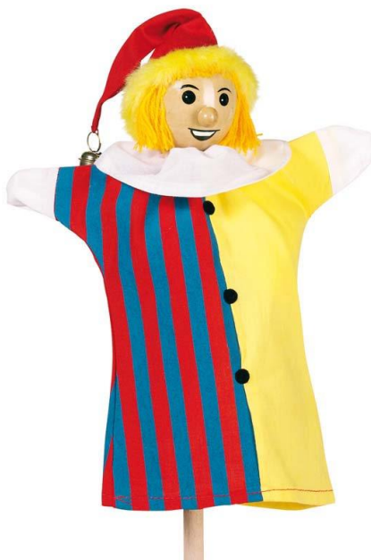
Slika 2. Lutka na štapu