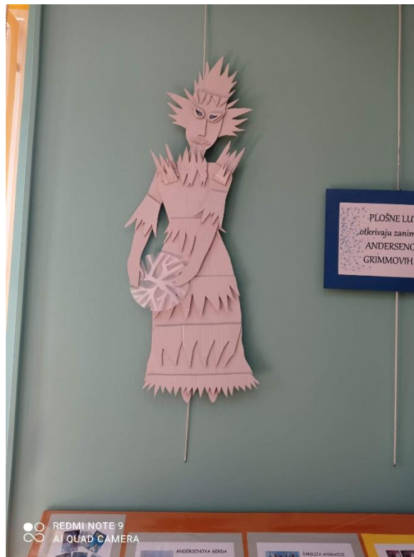
Slika 3. Plošne lutke (izvor: https://knjiznica-bjelovar.hr/obavijesti/plosne-lutke-otkrivaju-zanimljivosti-andersenovih-i-grimmovih-bajki/ , preuzeto 7.12.2022.)