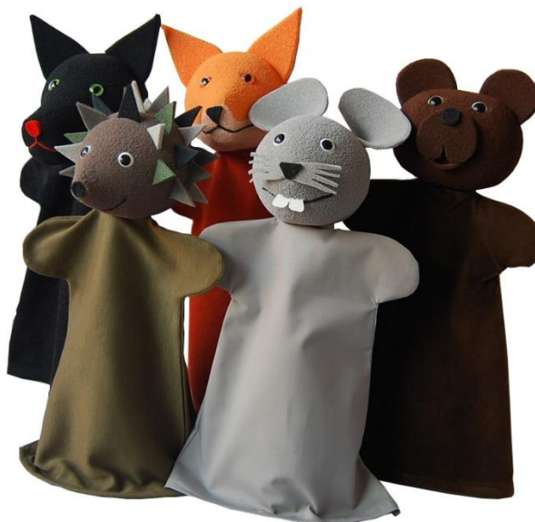
Slika 5. Ginjol lutke (izvor: https://www.astrejaplus.hr/proizvod/lutke-ginjol-sumske-zivotinje-5-likova/ , preuzeto 7.12.2022.)