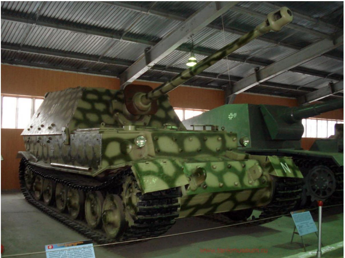
Slika 25.: Lovac na tenkove proizveden na šasiji Porscheova Tigera Ferdinand. 91 Svi primjerci sudjelovali su u ofenzivnoj operaciji kod Kurska 1943. godine. Nakon Kurska preostala vozila modernizirana su i upućena u defenzivne borbe u Italiji. 92

riješeni. Sada pod nazivom Elefant vozila su nastavila službu u oklopnim formacijama, ali užasne performanse osigurale su završetak proizvodnje i prenamijene Porscheova Tigera. 90