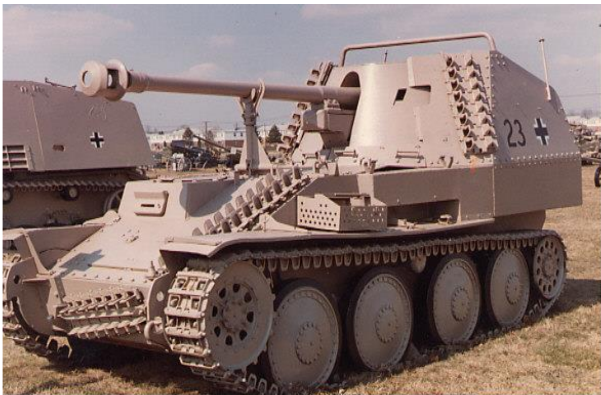
Slika 10.: Jedna od varijanti lovca na tenkove Marder III naoružana njemačkim topom od 75 mm, ali s promijenjenim smještajem posade. Taj lovac na tenkove sudjelovao je u borbama na svim važnijim europskim bojišnicama Drugoga svjetskog rata od 1943. do 1945. godine. 30

Jedan od najbrojnijih i možda najuspješnijih lovaca na tenkove bio je Jagdpanzer 38 (t) poznatiji pod imenom Hetzer . Po uklanjanju kupole i modificiranjem šasije na istu je montirana potpuno oklopljena struktura za zaštitu posade i vozilo je naoružano protutenkovskim topom od 75 mm. To vozilo moglo je svojim topom uništiti sve osim najteže oklopljenih savezničkih tenkova na udaljenosti od 800 metara. Na krovu vozila postavljena je strojica za borbu protiv pješastva, no pri upravljanju strojnicom vojnik je bio izložen neprijateljskoj vatri. Kako bi se otklonila opasnost za vojnika, strojnicom se moglo upravljati iz unutrašnjosti vozila. Sama debljina oklopa nije bila velika, no njegova kosina od 75 stupnjeva predstavljala je debljinu od 90 mm što je impresivno poboljšanje za vozilo koje je prethodno posjedovalo 35 mm oklopa na čeonj strani. Vozilo je prerađeno s isključivo protutenkovskom ulogom i njegova visina, jedva preko 2 m te širina od 2,6 m omogućila je napade iz zasjede. U slučaju da neprijatelj otkrije vozilo, ono se moglo udaljiti brzinom od 42 km/h ako su uvjeti to dopuštali. U relativno kratkom razdoblju od 1944. do 1945. godine