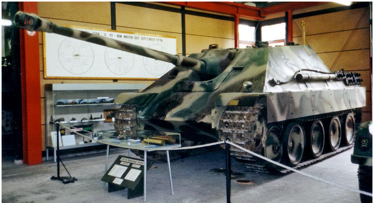
Slika 23.: Lovac na tenkove na bazi tenka Panther-Jagdpanther sudjelovao je u velikom broju u borbama na istočnom bojištu 1944. godine. Do kraja rata 1945. godine Jagdpanther je sudjelovao u defenzivnim borbama na području Njemačke protiv Crvene armije i zapadnih saveznika. 81

dugi top od 75 mm. U kolovozu 1942. godine njemačke su tvrtke dobile zapovijed za razvoj lovca na tenkove naoružanog dugim protutenkovskim topom od 88 mm. Testiranja su potrajala do 1944. godine kada je započeta serijska proizvodnja. Na šasiju Panthera nadograđen je oklopljeni prostor u koji je montiran top od 88 mm pretvorivši Panther u lovca na tenkove pod nazivom Jagdpanther. 79 Nakošeni čeonni oklop od 80 mm pružao mu je dobru zaštitu, a za obranu od pješništva montirana je strojnica. Iako težak više od 45 tona Jagdpanther je mogao dosegnuti brzinu od 46 km/h i tako držati korak s ostalim oklopnim postrojbama. Unutrašnjost tenka bila je prostrana za smještanje posade i dovoljne količine streljiva. Problem se pojavio u proizvodnji jer je Jagdpanther bio skuplji od Stuga III, IV i ostalih modificiranih tenkova pa je proizvedeno tek nešto više od 400 primjeraka. Uz to njemačka je vojska dobila još jedno vozilo koje je morala opskrbljivati i održavati 1944. godine. 80