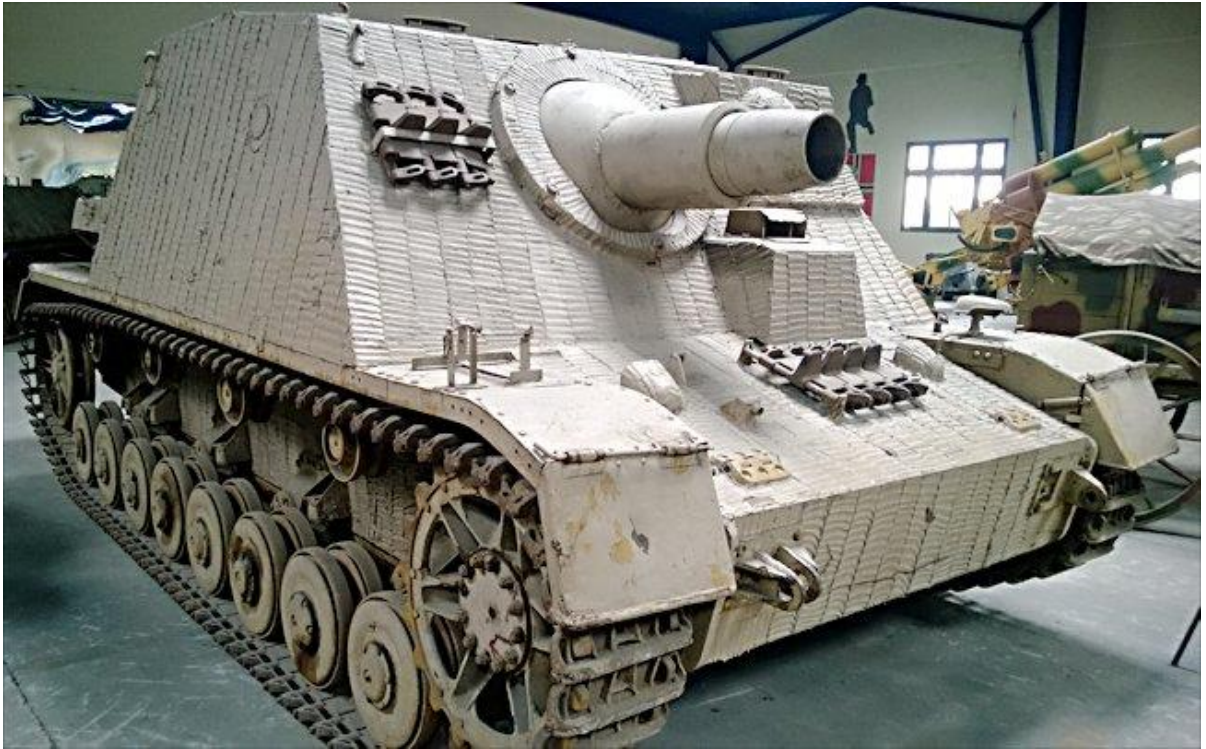
Slika 21.: Jurišna haubica Stupa ili Brummbär imala je ulogu pružanja direktne vatrene potpore pješaštvu prilikom ofenzivnih borbi. Korištena je u defenzivnim borbama od sredine 1943. do 1945. godine na istočnom, zapadnom i talijanskom bojištu. 71

mogle su zaustaviti jedino pješačko naoružanje pa je posada bila ranjiva, pogotovo kada bi ploče bile rastavljene u platformu prilikom borbe. Potreba za tim vozilom više svjedoči o lošem stanju njemačkog zrakoplovstva 1944. godine kada se to vozilo počelo proizvoditi. 70