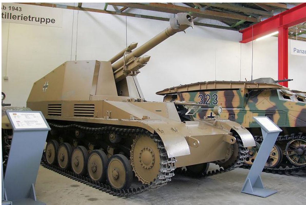
Slika 5.: Wespa , samohodna haubica na šasijsi Panzera II. Krajem 1942. godine započela je proizvodnja toga borbenog vozila kako bi oklopne formacije i pješništvo dobili indirektnu vatrenu potporu. Velik broj Wespi djelovao je na istočnom bojištu, a manji broj korišten je prilikom ofenzive u Ardenima u zimi 1944./1945. godine. 17