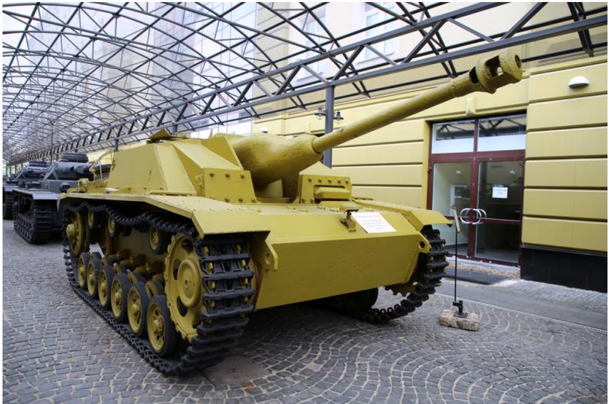
Slika 15.: Jurišni top na bazi Panzera III od 1940. godine do kraja rata sudjelovao je u borbama na svim bojištima, s manjim brojem vozila koja su poslana na bojište sjeverne Afrike. Mogao je pružati vatrenu potporu pješastvu i služiti kao lovac na tenkove. 54

Kako bi pješastvo dobilo vozilo za blisku vatrenu podršku i nešto za urbanu borbu Panzer III modificiran je u još jednu vrstu borbenog vozila. Umjesto protutenkovskog topa vozilo je bilo naoružano dugom lakom haubicom od 105 mm za protupješačko i protutenkovsko djelovanje. To vozilo, nazvano Sturmhaubitze ili StuH III više je djelovalo kao topništvo nego kao tenk. Haubica je ispaljivala kumulativne projekte, pogubne za neprijateljske tenkove te obične eksplozivne projekte za borbu protiv pješastva. Iako je vozilo nosilo naziv jurišna haubica, ono je bolje djelovalo u defenzivnoj nego ofenzivnoj ulozi prilikom borbe protiv tenkova i ponekad protiv pješastva. Oklop od 50 mm nije mogao zaustaviti protutenkovske projekte proizvedene sredinom Drugoga svjetskog rata, stoga nije bilo poželjno poslati vozilo u izravan sukob. 55