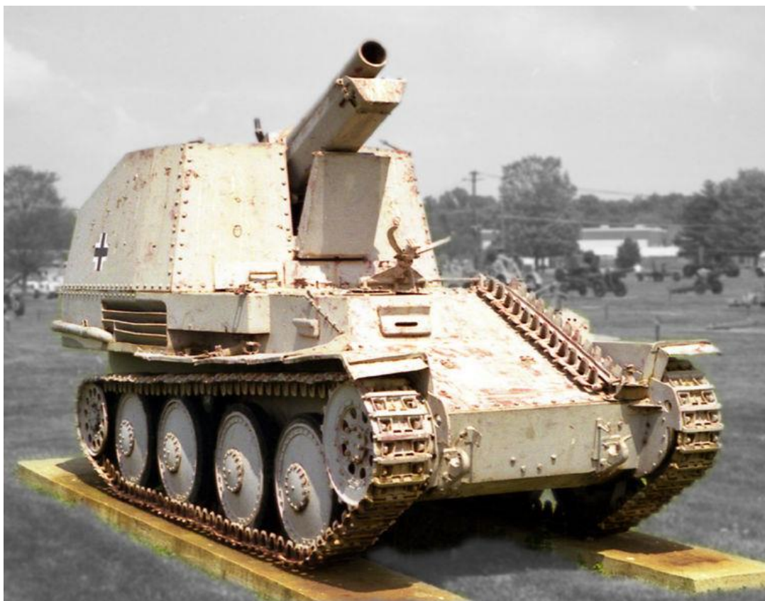
Slika 12.: Samohodna haubica Grille proizvodila se od 1943. do 1945. godine tijekom borbi na istočnom, zapadnom i talijanskom bojištu u ulozi pružanja vatrene potpore pješastvu i oklopnim formacijama. 36

Panzer 38 (t) korišten je prilikom invazije na Poljsku, Beneluks, Francusku, Jugoslaviju, Grčku i Sovjetski savez. Od 1939. do 1942. godine korišten je za borbu protiv neprijateljskih tenkova i pružanje potpore ostalim njemačkim tenkovima sa slabijim naoružanjem. Do 1942. godine nije pojačana proizvodnja izvornog tenka unatoč gubicima na bojištu no proizvodnja drugih inačica tenka osigurala je njegovu službu unutar njemačkih oklopnih formacija. Hetzer i Grille sudjelovali su u borbama na Europskom kontinentu do kraja Drugog svjetskog rata, a neke inačice poput Mardera III korištene su u borbama na sjeveru afričkog kontinenta. 37