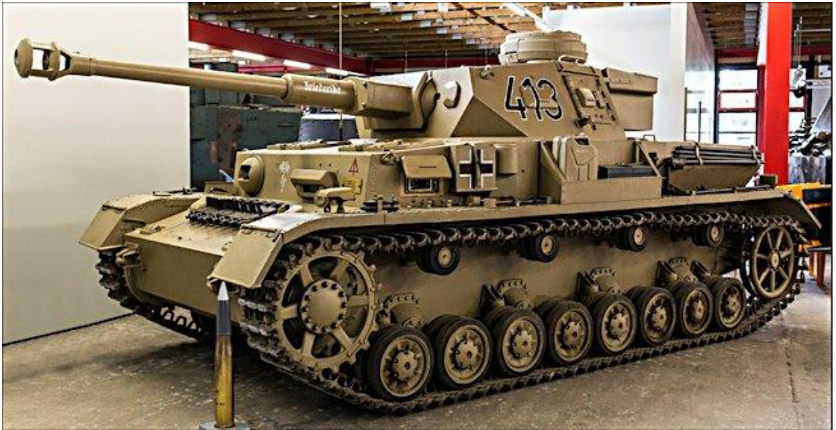
Slika 17.: Panzer IV proizveden sredinom Drugoga svjetskog rata. Ta varijanta naoružana je dugim topom od 75 mm za borbu protiv neprijateljskih tenkova. Prvotne varijante koje su imale ulogu potpore pješastvu tijekom rata nadograđivane su. Taj je tenk sudjelovao u borbama na svim europskim bojištima od 1939. do 1945. godine. Manji je broj tenkova sudjelovao u borbama u sjevernoj Africi. 60

Panzer III ne može nositi jači top od 50 mm, započela je proizvodnja Panzera IV s naoružanim dugim protutenkovskim topom od 75 mm, pretvorivši tenk za potporu pješastva u tenk za borbu protiv ostalih tenkova. Međutim, tenk nije posve izgubio ulogu potpore pješastvu jer su eksplozivni projektili koje je top ispaljivao bili sasvim dovoljni za uništavanje određenih obrambenih pozicija. Oklopno probijajući projektili nisu imali poteškoće pri probijanju sovjetskih i savezničkih tenkova, ali su isto tako bili ranjivi u borbi protiv istih tenkova. 59