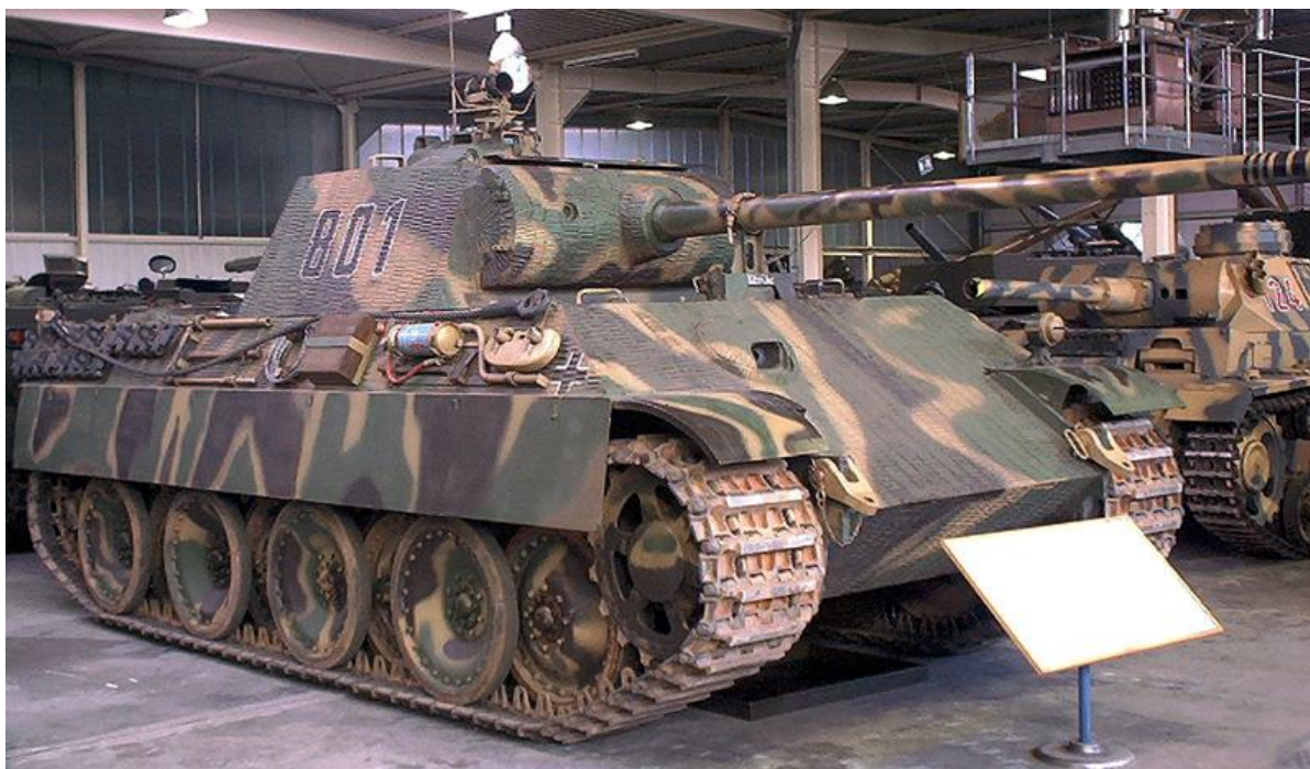
Slika 22.: Panther, možda najbolji njemački tenk Drugoga svjetskog rata. Dizajniran kao tenk za borbu protiv drugih tenkova s taktičkom ulogom probijanja neprijateljske crte obrane zbog preokreta na istočnom bojištu nakon 1943. godine; često je morao djelovati defenzivno. Panther je sudjelovao u ofenzivnim i defenzivnim borbama na svim europskim bojištima Drugoga svjetskog rata od 1944. do 1945. godine. 75