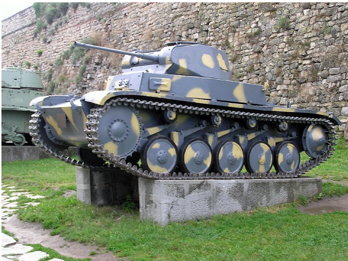
Slika 3.: Panzer II naoružan topom od 20 mm. Velik broj tih tenkova sudjelovao je na svim europskim bojištima do 1942. godine. Određeni broj korišten je i na bojištima sjeverne Afrike. 13

Prema svojoj brzini Francuzi i Britanci te bi tenkove klasificirali kao konjičke tenkove, ali njemačka vojska uvijek je pokušavala jednoj vrsti tenka pridodati višestruku ulogu. Ti tenkovi mogli su biti nagomilani u jednu snažnu i brzu oklopnu formaciju i služiti za proboj neprijateljske bojišnice. Njihove karakteristike odgovaraju ulozi „pucaj i manevriraj” uz ulogu potpore pješastvu kada je to situacija zahtijevala. Izvorna uloga tih tenkova potpuno se promijenila kada su njihovu ulogu preuzeli prethodno spomenuti tenkovi Panzer III i IV što je njemačku vojsku natjeralo da napravi prenamjenu nekih „zaostalih” tenkova. 14