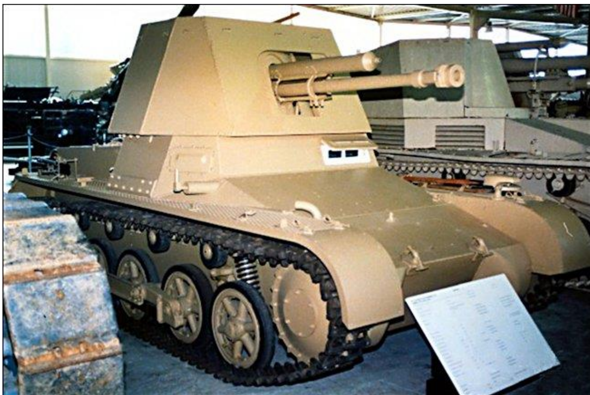
Slika 2.: Jedini očuvani primjerak Panzera I kojem je uklonjena kupola kako bi tenk imao bolju protutenkovsku ulogu (Panzerjäger). Korišteni su u borbama u Poljskoj, Francuskoj, sjevernoj Africi i u početnoj fazi operacije Barbarossa kao lovci na tenkove. 8

Panzer I korišten je u ofenzivnim operacijama na mnogim bojišnicama Drugog svjetskog rata do 1942. godine kada je postalo očito kako ne zadovoljava svoju prvotnu ulogu. Veliki brojevi ovih tenka sudjelovali su u napadu na Poljsku, Norvešku, Dansku, napadu na Francusku, Benelux, Jugoslaviju, Grčku i u borbama u Sjevernoj Africi. Njihova zadaća bila je probijanje neprijateljske obrambene crte svojom brojčanom nadmoći i opkoljavanjem protivnika. 9