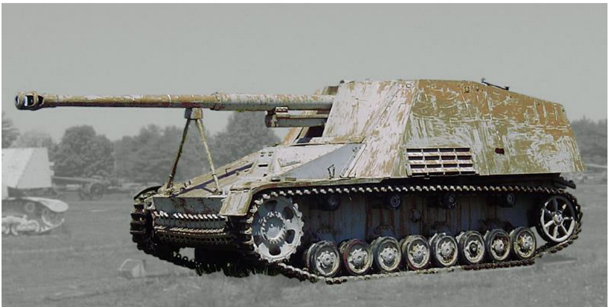
Slika 19.: Lovac na tenkove Nashorn naoružan topom od 88 mm. U defenzivi mogao je uništiti bilo koji saveznički tenk na većoj udaljenosti, no zbog slabog oklopa bio je ranjiv u bliskoj borbi. Većina tih vozila proizvedena je nakon 1943. godine i djelovala je na istočnom bojištu protiv sovjetskih tenkova. 66

oklopno borbeno vozilo što je dovelo do razvoja vozila pod nazivom Nashorn . To je vozilo po dizajnu bilo nalik prethodno spomenutom Marderu III s izduženom šasijom njemačkog Panzera III ili IV i oklopnim štitom montiranim na stražnji dio tenka. Vozilo je posjedovalo slabi oklop od 30 mm koji bi odolijevao lakom pješačkom naoružanju i visoki profil, no prednost topa od 88 mm koji je mogao uništiti bilo koji tenk Drugoga svjetskog rata opravdavala je većinu nedostataka. Za obranu od pješastva na vozilo je montirana strojnica MG-34, a posada se sastojala od četiri člana: strijelac, punilac, zapovjednik i vozač. Taj visoko mobilni lovac na tenkove oslanjao se na element iznenađenja i na preciznost topa kako bi na velikoj udaljenosti uništio neprijateljske tenkove. Svoju protutenkovsku ulogu obavljao je dovoljno dobro da se proizvodnja započeta 1943. godine nastavi do kraja rata. 65