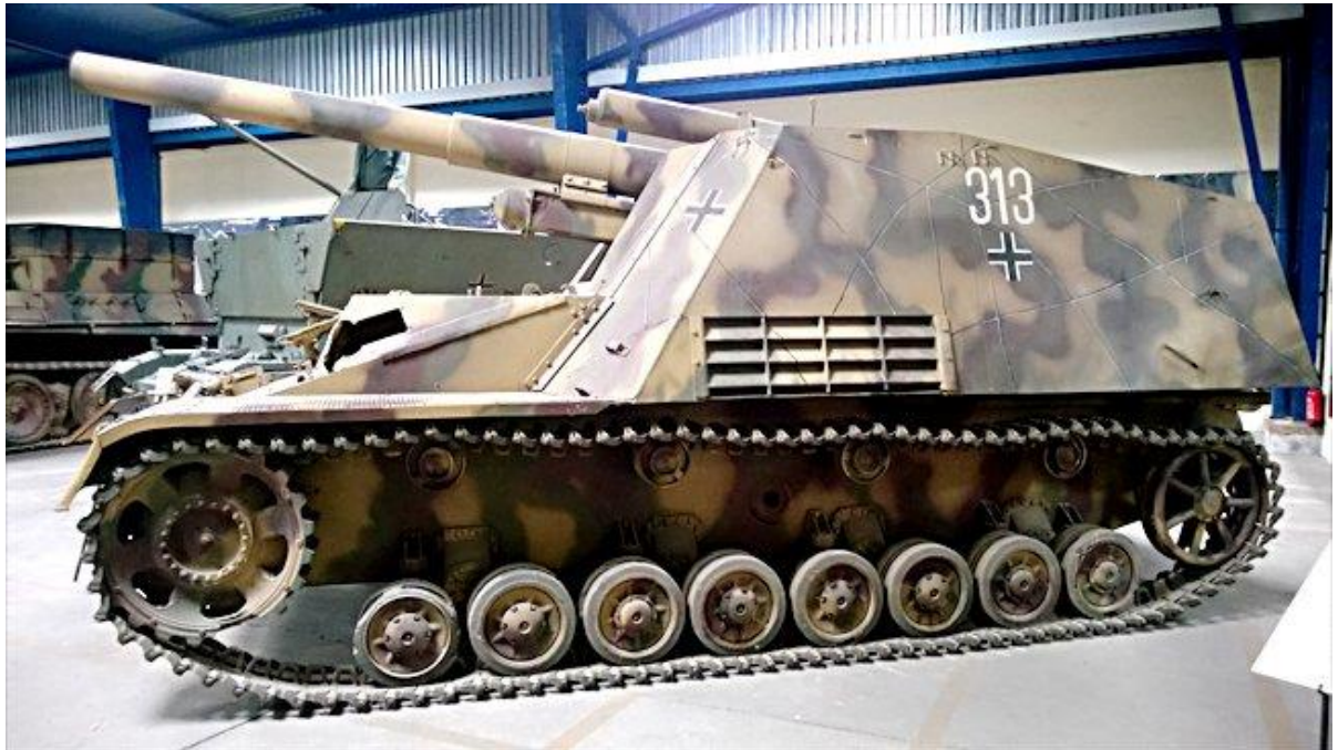
Slika 20.: Samohodna haubica Hummel imala je ulogu pružanja indirektno vatrene potpore pješastvu i oklopnim formacijama. Korištena je u toj ulozi od 1943. do 1945. godine prilikom ofenzivnih i defenzivnih borbi na istočnom bojištu. Manji broj vozila sudjelovao je od 1944. do 1945. godine na zapadnom bojištu. 68

rukovođenja protutenkovskim topom. Maksimalan domet toga samohodnog topa iznosio je 13 km, što je vozilu omogućavalo da djeluje iz pozadine. Proizveden u približno 670 primjeraka Hummel se pokazao dostojnim svoje uloge, no nedostatak je bio manjak streljiva jer je u borbu mogao ponijeti samo 18 projektila. 67