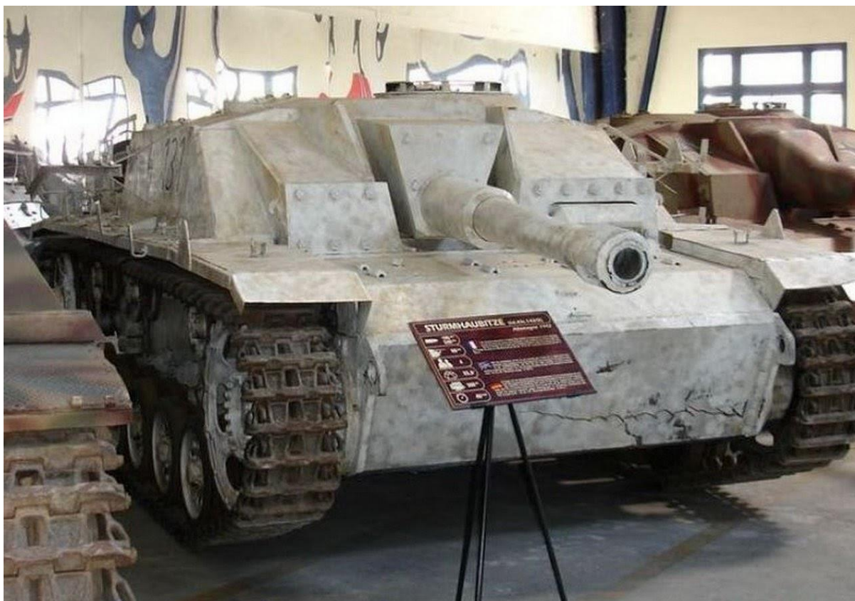
Slika 16.: Jurišna haubica Stuh 42 imala je ulogu pružanja bliske vatrene potpore pješastvu, pogotovo u urbanim borbama na istočnom bojištu. Proizvodnja je trajala od listopada 1942. do kraja rata 1945. godine. 56

Budući da je proizvodnja svih varijanti Panzera III trajala do sredine Drugoga svjetskog rata i da su njegove inačice rađene sve do kraja rata, može se zaključiti da je Panzer III bio jako dobro dizajniran tenk svojeg doba. Iako je razvoj bio odužen, konačni proizvod bio je gotovo izvrstan. U prilog tome govori činjenica da je tenk konstantno nadograđivan i moderniziran bez prevelikog truda za razliku od ranije proizvedenih tenkova i nekih savezničkih tenkova koji nisu mogli primijeniti jednostavne nadogradnje i modifikacije. Unatoč odličnim značajkama Panzera III njemačka vojska radila je na razvoju dugog, vrlo sličnog tenka koji će nositi naziv Panzer IV.