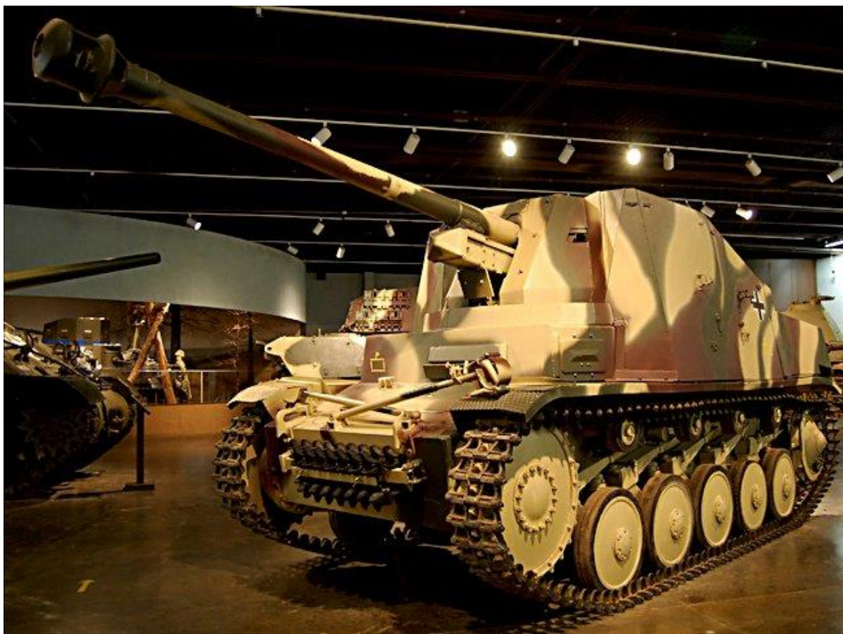
Slika 4.: Lovac na tenkove na bazi Panzera II nazivan Marder II. Proizvodio se od 1942. do 1944. godine, a najviše primjeraka poslano je na istočno bojište. Manji broj tih lovaca na tenkove bio je poslan na sjevernoafričko bojište 1942. i zapadno bojište 1944. godine. ( http://tank-photographs.s3-website-eu-west-1.amazonaws.com/marder-II-german-ww2-self-propelled-gun-spg.html , pristupljeno: 14. rujna 2022.)

Panzer II, kao i njegov prethodnik Panzer I sudjelovao je u ofenzivnim operacijama njemačke vojske na bojištima gdje se ona borila. Djelovao je sa istom ulogom opkoljavanja neprijatelja no za razliku od Panzera I duže je korišten tijekom rata. Određeni modeli korišteni su do kraja rata u pozadini za suzbijanje gerile ili za patrolu prometnica kada su na prvim borbenim linijama zamijenjeni sa suvremenijim tenkovima. Inačica Wespa zbog svoje dobre uloge pružanja potpore pješastvu korištena je u borbi sve do kraja Drugog svjetskog rata. 16