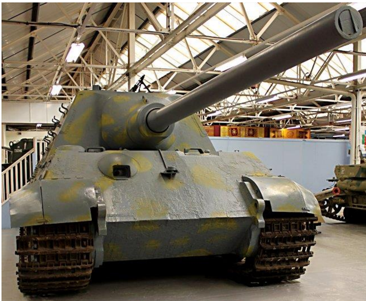
Slika 27.: Lovac na tenkove Jagdtiger proizveden krajem Drugoga svjetskog rata. Manje od 100 tih lovaca sudjelovalo je u defenzivnim borbama na istočnom i zapadnom bojištu u posljednjim mjesecima rata u pokušaju da zaustave brojčano nadmoćnijeg neprijatelja. 98