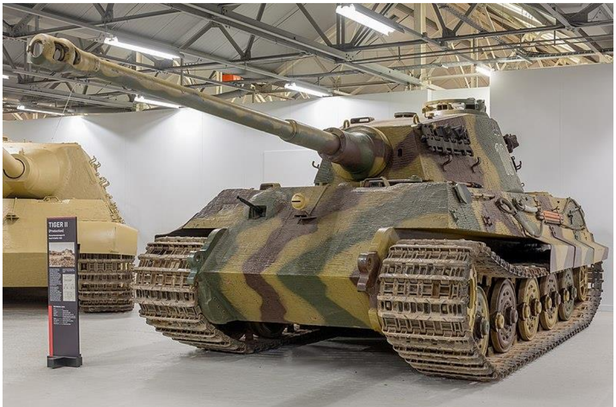
Slika 26.: Njemački teški tenk Tiger II. 94 Sudjelovao je u defenzivnim borbama krajem 1944. i tijekom 1945. godine. Na zapadnom bojištu korišten je prilikom proboja u Ardenima krajem 1944. godine. Jedna od posljednjih ofenzivnih operacija u kojoj je tenk sudjelovao bila je ofenziva na jezeru Balaton u proljeće 1945. godine. 95

tenkovima T-34 i potrebom za gradnjom tenka koji bi odolio protutenkovskim projektilima u bliskoj borbi. Nedostatak goriva u kasnijim godinama utjecao je na mali broj primjeraka koji su sudjelovali u borbi. Sustav upravljanja i kotača preuzet je s Tigera I, a nakošeni čeonik oklop kopiran je s Panthera. Debljina čeonog oklopa iznosila je 185 mm, dok su bočne strane imale debljinu oklopa od 80 mm. S takvim oklopom taj je tenk težio gotovo 69,8 tona pa je maksimalna brzina od 41 km/h bila teško dosežna. Ista je težina prouzročila probleme poput prelaska preko mostova ili bilo kakvoga mekog terena. U slučaju kvarova otežana je bila i vuča kako bi vozilo bilo popravljeno i vraćeno u borbeni sastav. Za borbu protiv tenkova vozilo je bilo naoružano dugim protutenkovskim topom od 88 mm i strojnicama MG-34 za obranu od pješništva. Od 1944. godine do kraja Drugoga svjetskog rata proizvedeno je 484 tenkova tog modela što nije bilo ni približno dovoljno za preokretanje ratne sreće. Da je njemačka vojska posjedovala tisuće takvih tenkova, ne bi bilo razlike u ishodu rata zbog nedostatka goriva. 93