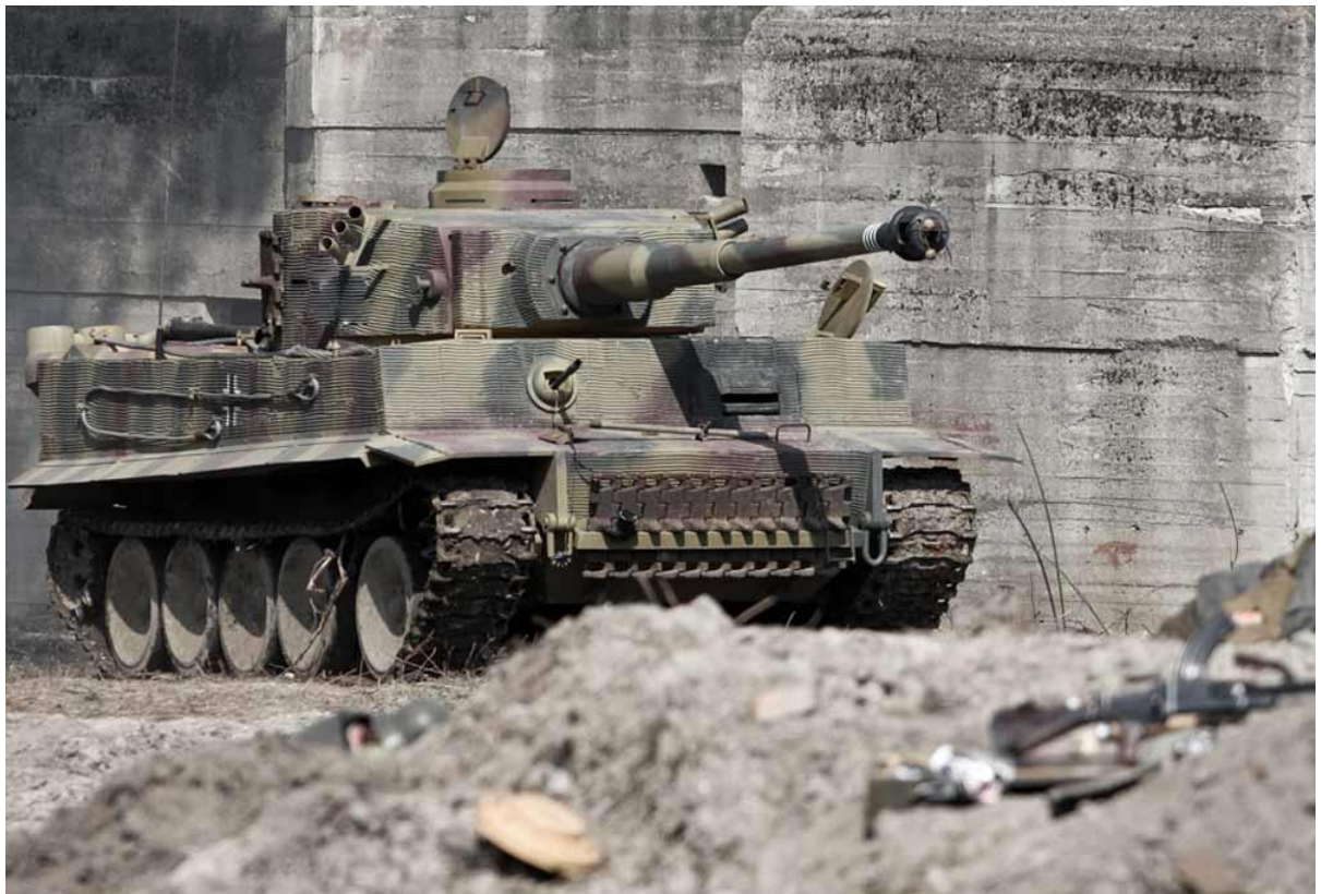
Slika 24.: Njemački teški tenk Tiger bio je dizajniran kao ofenzivni probojni tenk, no tijekom borbi na istočnom frontu češće je bio u defenzivi. Od približno 1500 Tigera većina ih je sudjelovala u obrambenim borbama na istočnom bojištu od 1943. do 1945. godine. Jedan manji broj Tigera prebačen je na zapadno bojište 1944. godine. 84

kopiran je od sovjetskih tenkova zbog lakše zamjene prilikom oštećenja. Problem se nalazio u pogonu i upravljanu tenka jer jedan motor nije bio dovoljan za pokretanje tako teškog tenka pa je Porsche ugradio dva motora, svaki za pogon jedne gusjenice. Sustav mijenjanja brzina koristio je mnogo žica i bakra što je bilo izuzetno skupo za proizvodnju i stvaralo je dodatne probleme. Preopterećenje sustava uzrokovalo bi česte kvarove i požare koji bi onespobili ili uništili tenk. Motor je bio smješten u zadnjem dijelu tenka odozgo zaštićen mrežastim poklopcima radi hlađenja što je bila ahilova peta tenka jer ga je mogla zaustaviti jedna boca Molotovljeva koktela. Da je Porsche bio manje optimističan, sigurno bi na vrijeme prekinuo s razvojem tenka, no suprotno tome on je pokrenuo proizvodnju vjerujući u pobjedu nad konkurencijom. Tako je do kraja 1942. proizveo gotovo 100 šasija Tigera P, pritom trošeći vrijedne resurse koje njemačka nije imala samo da bi kasnije te šasije stajale u skladištima. Kasnije će te šasije imati svoju svrhu u jednoj, gotovo nepraktičnoj prenamjeni. 83