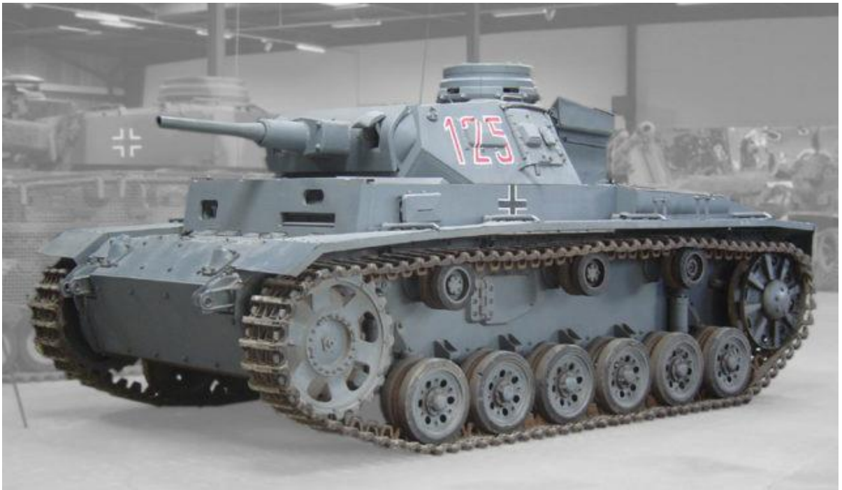
Slika 14.: Panzer III H naoružan topom od 50 mm. Glavni borbeni tenk njemačke vojske do kraja 1942. godine trebao je svojim naoružanjem uništavati protivničke tenkove. Do kraja rata prošao je kroz mnoge nadogradnje oklopa i naoružanja. Korišten je na svim europskim bojištima i u sjevernoj Africi. 45

Razvoj njemačkih lakih tenkova pratio je koncept razvoja srednjih tenkova kako bi nova vozila imala protutenkovsku i protupješačku ulogu. Njemačka vojska razmatrala je opciju montiranja protutenkovskog topa od 37 mm u neku vrstu oklopnog vozila imajući na umu moguću borbu protiv neprijatelja koji je raspolagao oklopnim vozilima. Od 1934. do 1936. godine podneseno je nekoliko ponuda koje su utvrdile dizajn i izgled novog tenka. Veličina kupole imala je više nego dovoljno prostora za montiranje topa i strojnice pa je razmatran i prijedlog da se tenk naoruža topom od 50 mm. S čeonim oklopom debljine 30 mm i navedenim naoružanjem usporediv je sa čehoslovačkim, a kasnije njemačkim tenkom LT vz. 38/ Panzer 38 (t). Međutim, iako u početku jednako oklopljen i naoružan kao Panzer 38 (t), Panzer III bio je veći i teži. Dizajn je omogućavao daleko više pregradnji i modifikacija od bilo kojeg prethodno dizajniranog tenka njemačke vojske. Iako su prvi modeli proizvedeni 1936. godine, serijska proizvodnja započela je tek tri godine kasnije. Zbog dugotrajnijeg razvoja laki čehoslovački tenkovi integrirani su u sastav njemačkih oklopnih snaga. 44