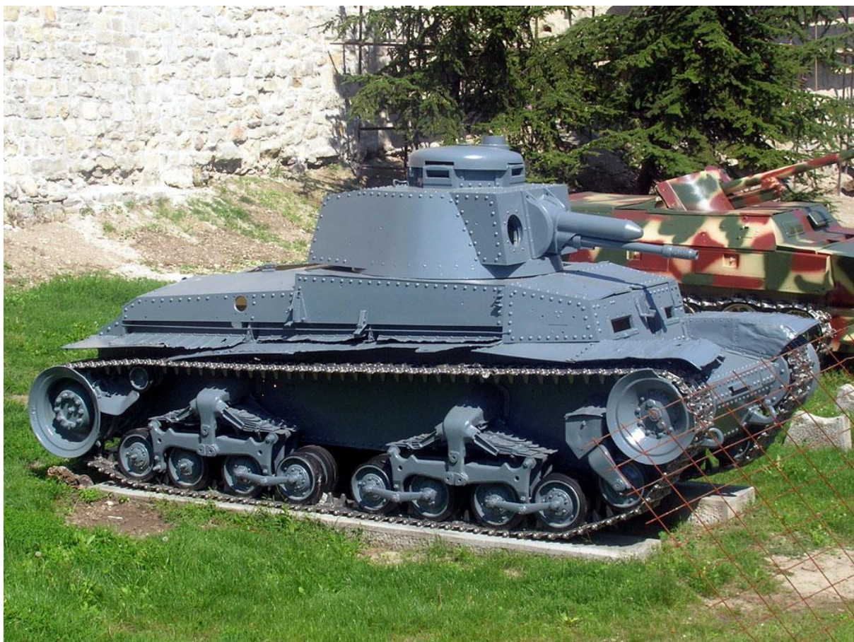
Slika 6.: Laki tenk model 35, odnosno Panzer 38 (t) korišten je u borbama u Poljskoj, Beneluxu, Francuskoj, Jugoslaviji i Sovjetskom Savezu. Naoružan topom mogao je uništavati sabije oklopljene protivničke tenkove te pružiti zaštitu drugim njemačkim tenkovima. Do studenoga 1941. godine taj je tenk povučen iz borbene upotrebe zbog zaostalosti. 19

Lehky tank vzor 35 (laki tenk model 35) dizajniran je u Čehoslovačkoj ranih 1930-ih, a njegova je glavna proizvodnja započela 1935. godine. Sa samo 135 primjeraka proizvedenih do 1938. godine ne može se količinski usporediti sa stotinama njemačkih Panzera I i II, no njegovi brzina, oklop i naoružanje superiorniji su prema njemačkim tenkovima proizvedenima do 1938. godine. Top marke Škoda od 37,2 mm kojim je tenk bio naoružan mogao je pouzdano probiti bilo koji tadašnji njemački tenk, a brzina od 40 km/h tom je tenku omogućila mobilnost ravnu njemačkim tenkovima. Osim topom tenk je bio naoružan i strojnicom za potporu i odbijanje napada pješništva. Njegova težina od 11,6 tona bila je malo veća od većine njemačkih tenkova, ali unatoč tome i posadi od četiri člana (njemački tenkovi imali su posadu od dva ili tri člana osim Panzera III i IV) taj je tenk bio bolje dizajniran. Treba napomenuti da oklop tenka (35 mm sprijeda do 12 mm straga) nije bio zavarivan kao u Panzera, nego pričvršćen zakovicama. Formacija sastavljena od tih tenkova u otvorenom okršaju uništila bi bilo kakvu formaciju sastavljenu od Panzera I i II jer potonji nisu bili