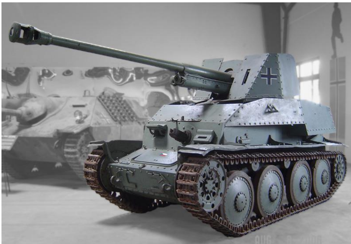
Slika 8.: Lovac na tenkove Marder III. 27 Taj lovac na tenkove bio je naoružan zarobljenim sovjetskim topom od 76 mm te je djelovao na istočnom bojištu. Proizvodnja je trajala do razvitka bolje dizajniranih lovaca na tenkove. 28