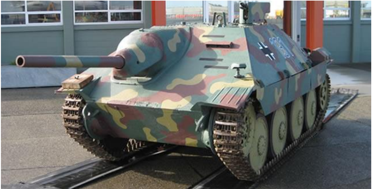
Slika 11.: Lovac na tenkove Jagdpanzer 38- Hetzer masovno proizveden 1944. godine. U ulozi prikrivenog lovca na tenkove pokazao se dobar i korišten je u borbama na istočnom bojištu. Jedna oklopna formacija Hetzera borila se protiv saveznika u Ardenima u prosincu 1944. godine. 32

prenamijenjena su ili proizvedena 2584 primjerka tog vozila koji su sudjelovali u borbama na svim glavnim europskim bojištima. 31