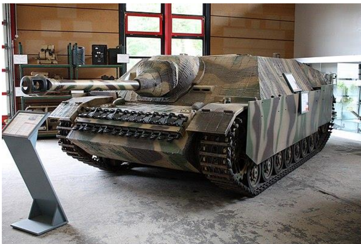
Slika 18.: Jurišni top na bazi Panzera IV-Jagdpanzer naoružan topom od 75 mm. Mogao se koristiti kao jurišni top ili lovac na tenkove, ovisno o situaciji. Gotovo svi primjerci korišteni su na istočnom bojištu od 1944. do 1945. godine kao lovci na tenkove u defenzivnim operacijama. 64

formacijama. Jagdpanzer IV izgledom je nalikovao povećanom Hetzeru (lovac na tenkove na bazi Panzera 38 (t)) s pojačanim naoružanjem. Dugi top od 75 mm imao je dobre protutenkovske karakteristike, a za obranu od pješništva u oklopljenu strukturu montirane su dvije strojnice MG-34. Čeoni nakošeni oklop debljine 60 mm mogao je zaustaviti protutenkovske projektele na srednjim i dalekim udaljenostima, no zbog nedostatka kupole vozilo nije bilo predviđeno za blisku borbu. Druga varijanta Jagdpanzera IV pokušala je u vozilo montirati jači i duži protutenkovski top od 75 mm, no to nije bilo moguće bez povećavanja visine vozila. Ipak je 1944. pokrenuta proizvodnja s obzirom na to da je druga varijanta bila jeftinija, a njemačkoj je vojsci u to vrijeme nedostajalo oklopnih vozila. Ukupno je proizvedeno približno 1050 primjeraka tog vozila što je veoma malo ako se usporedi proizvodnja glavnih modela njemačkih Panzera i ostalih oklopnih vozila. 63