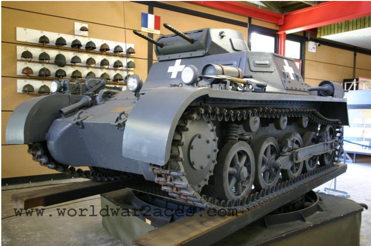
Slika 1.: Panzer I, proizveden u velikom broju, bio je česta pojava na glavnim europskim bojištima Drugoga svjetskog rata do 1941. godine kada je postalo jasno da tenkovi naoružani samo strojnicama ne zadovoljavaju taktičke potrebe. 5

zbog činjenice da nije bilo potrebe za varijantom tenka koji posjeduje visoku brzinu, a zbog slabog oklopa ne može "preživjeti" borbu protiv neprijateljskog tenka. Panzer I. D bio je posljednja varijanta te serije tenkova i imao je jednu ulogu, a to je bila potpora pješaštvu. Budući da se očekivalo da drži korak s pješaštvom, nije imao brzinu veću od 25 km/h, ali je zato bio bolje oklopljen od svih prijašnjih varijanti Panzera I. S oklopom od 66 mm mogao je zaustaviti zrna jačega pješačkog naoružanja i pojedinih topova. Međutim, naoružanje nije bilo pojačano pa je varijanta D ostala naoružana parom strojnica. 4