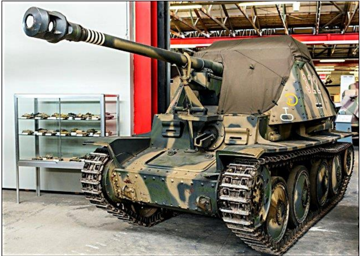
Slika 9.: Lovac na tenkove Marder III H naoružan njemačkim topom od 75 mm. Većina tih lovaca na tenkove djelovala je na istočnom bojištu od 1942. do 1945. godine. 29