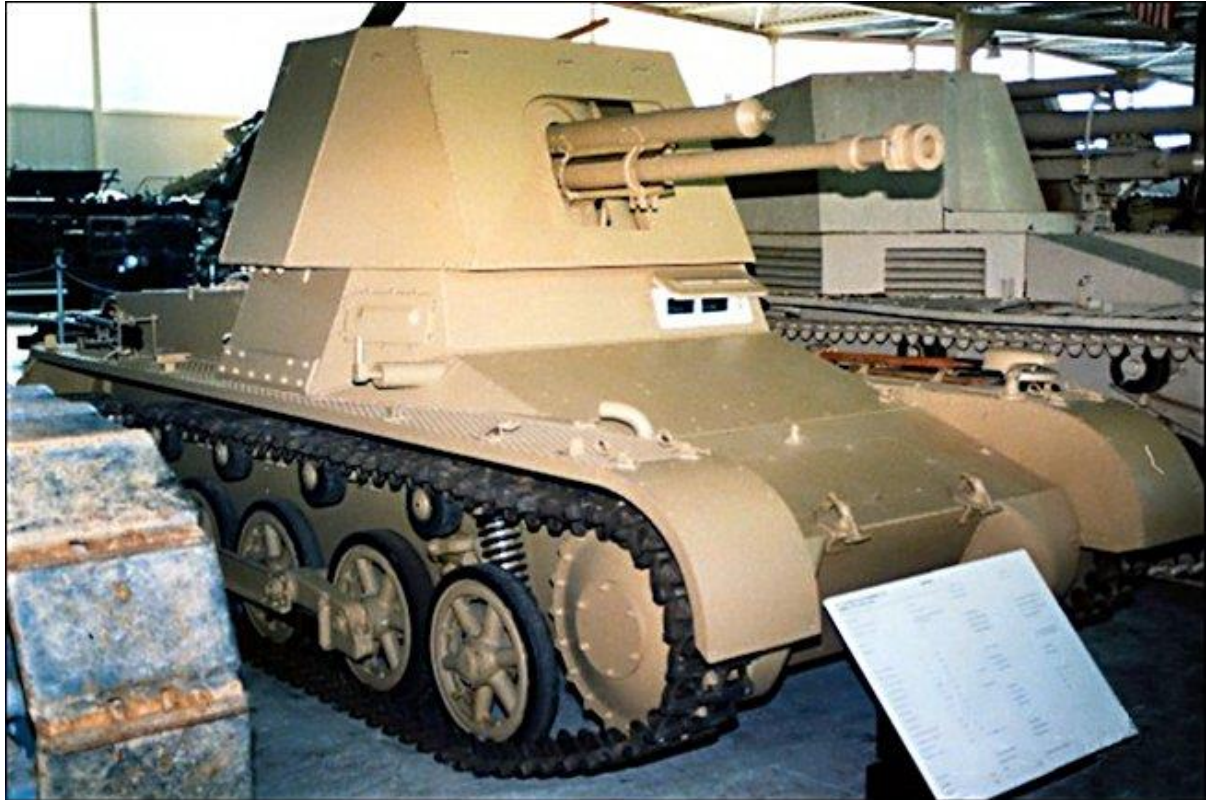
Slika 2.: Jedini očuvani primjerak Panzera I kojem je uklonjena kupola kako bi tenk imao bolju protutenkovsku ulogu (Panzerjäger). Korišteni su u borbama u Poljskoj, Francuskoj, sjevernoj Africi i u početnoj fazi operacije Barbarossa kao lovci na tenkove. 8

Panzer I korišten je u ofenzivnim operacijama na mnogim bojišnicama Drugog svjetskog rata do 1942. godine kada je postalo očito kako ne zadovoljava svoju prvotnu ulogu. Veliki brojevi ovih tenka sudjelovali su u napadu na Poljsku, Norvešku, Dansku, napadu na Francusku, Benelux, Jugoslaviju, Grčku i u borbama u Sjevernoj Africi. Njihova zadaća bila je probijanje neprijateljske obrambene crte svojom brojčanom nadmoći i opkoljavanjem protivnika. 9