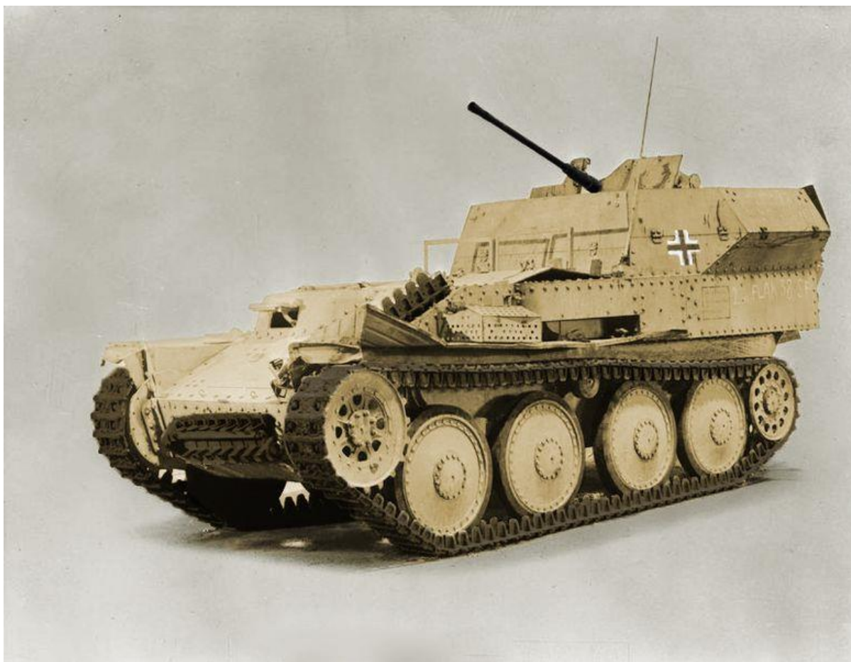
Slika 13.: Samovozni protuavionski top na šasiji Panzera 38 (t)-Flakpanzer. 38 Od 140 vozila koja su proizvedena 1944. godine gotovo svi primjerci uništeni su u borbama na zapadnom bojištu iste godine. 39