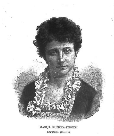
Slika 6: Marija Ružička- Strozzi, hrvatska glumica 139

Ljerka Šram, a početkom 90-ih godina Hermina Šumovska. 135 Kraj 19.stoljeća donio je korjenite promjene na području kazališta i glume. Zasluge pripadaju intendantu Stjepanu Miletiću, koji je 1894.g. uspio obnoviti operu, osnovao je glumačku školu, postavio je kvalitetan repertoar i prepoznao je talentirane scenske umjetnike. 136 Naglašavao je ulogu redatelja kao kreatora, te je u novoj zgradi HNK u Zagrebu otvorenu 1895.g., mogao lakše postaviti zahtjevnije produkcije. Glumci više nisu stajali na pozornici i recitirali tekst, već su se kretali po sceni, a pažnja se posvećivala kostimima i scenografiji. Osim što je uspio dovesti kazalište na srednjoeuropsku razinu, pobrinuo se i za bolji položaj umjetnika i umjetnica u društvu. 137 U njegovoj eri prosperiraju Marija Ružička Strozzi, Ljerka Šram, Sofija Borštnik, Mila Dimitrijević, Milia Mihičić, te Nina Vavra. 138