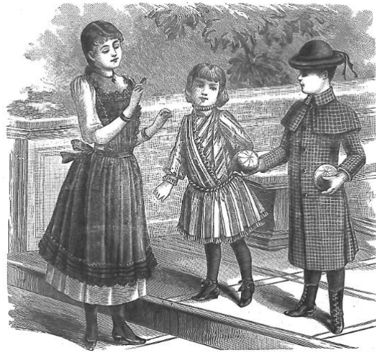
Slika 1: Žena s djecom 25

nije se brinula o vlastitoj djeci, već je o njima vodila brigu dadilja, kasnije kinderfrajla i napokon guvernanta. 24