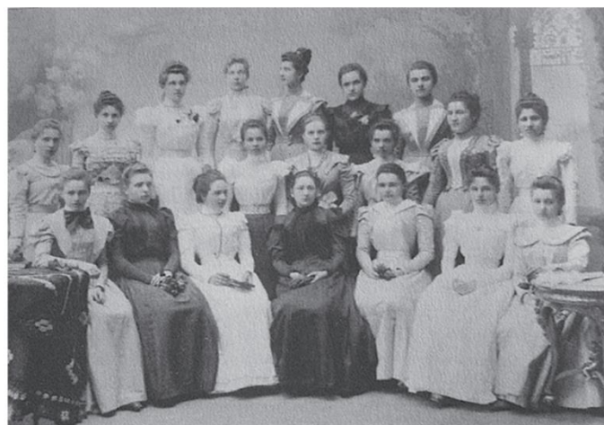
Slika 4: Maturantice Ženskog liceja krajem 19.stoljeća 74