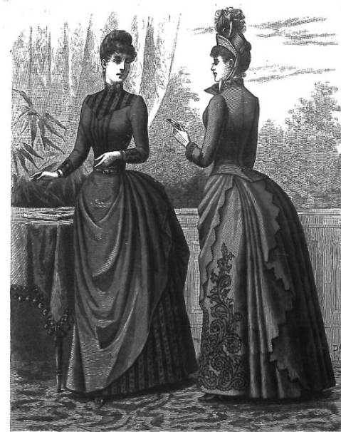
Slika 2: Žene visokog društva krajem 19.stoljeća 41

da bude moderna i obrazovana, ali da ujedno drži do tradicije, kako bi zadovoljila ulogu majke, žene i kućanice. 40