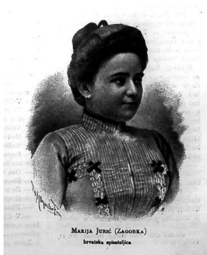
Slika 5: Marija Jurić- Zagorka, hrvatska spisateljica 109

Žena u novinarstvu nije bilo mnogo. To je zanat koji se ipak jače razvio tijekom i nakon Prvog svjetskog rata. Krajem 19.stoljeća, jedna žena se bavila novinarstvom, a to je bila Marija Jurić Zagorka. Započela je svoju karijeru 1896.g. Osim novinarstva, bavila se i književnim radom. Prvi roman „Roblje“ iz 1899.g. izlazio je u časopisu Obzor . Među najpoznatijim djelima koji nastaju prije početka rata svakako je ciklus romana „Grička vještica“ koji nastaju između 1912. i 1915.g. a objavljeni su po dijelovima u „Malim Novinama“. 107 Koliko je bila omiljena u društvu i koliki je napredak predstavljala u društvu dokazuje i članak u listu Dom i Sviet piše o njoj: „...Među najvrstnije hrvatske spisateljice sadašnjega vremena možemo ubrojiti mladu, darovitu i duhovitu gospodju Mariju Jurić..., ...baveć se novinarstvom- sada je stalna suradnica Obzora – napisala je svu silu članaka i podlistaka..., ...najveće joj je djelo roman „Roblje“ koji je preveden na poljski jezik, onda su veće stvari „U zagorskom zatišju“, „Zorka“, „Iz Darinkina dnevnika“, „Crtice iz ženskog života“, „Tajni spisi“, napisala je dvije vesele igre „Roman“ i „Što žena umije“...“. 108