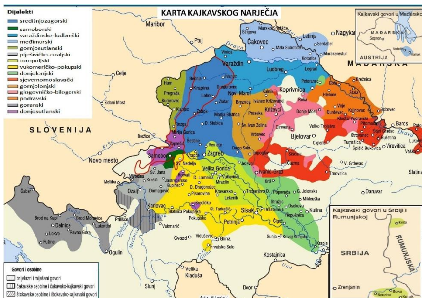
Karta 2. Prostiranje bednjanskozagorskoga dijalekta na karti kajkavskoga narječja (Lončarić 2005: 110)