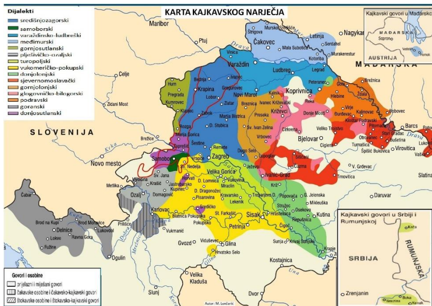
Karta 2. Prostiranje bednjanskozagorskoga dijalekta na karti kajkavskoga narječja (Lončarić 2005: 110)