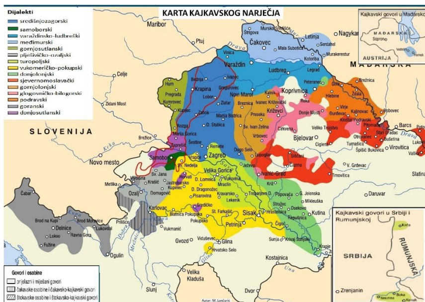
Karta 2. Prostiranje bednjanskozagorskoga dijalekta na karti kajkavskoga narječja (Lončarić 2005: 110)

Od ostalih istraživanja govora bednjansko-zagorskoga dijalekta užeg i šireg područja zlatarske okolice, dijalektološki su istraženi sljedeći punktovi: Wolfgang Jakoby istražio je govor Gornje Stubice 1 , Alojz Jembrih i Mijo Lončarić istraživali su govor Gregurovca Veterničkoga 2 , Ivana Oraić Rabušić proučavala je govor Šemnice Gornje 3 , Antun Šojat istražio je govor Krapine i Začretja (govor Začretja obradili su Dalibor Brozović i Josip Lisac) 4 , a Vesna Zečević bavila se istraživanjem govora Lobora 5 .