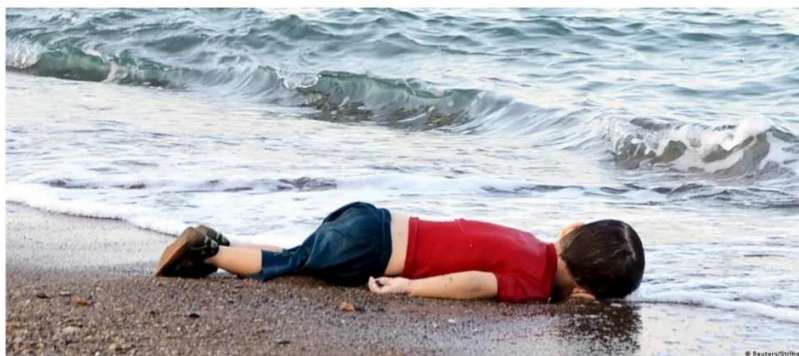
Slika 4. (Izvor:

palicama-i-tjeraju-iz-hrvatske-sluzbeno-nema-naredbe-ali-interno-04124cac-26d7-11ec-9fa0-7ec041c97306 ). Spoznaja o manipulacijama je bitna i trebamo biti svjesni koliko je politika upletena u prostor medija i koliko je autonomnost zapravo smanjena. Sve se pregledava, korigira, osim tekstualnog sadržaja, tako i sadržaj fotografija. Izrada fotografije kao i obrada, možemo reći da je u fotonovinarstvu laka i brza, međutim po putu joj se lako prišije novo značenje što je zapravo zabrinjavajuće.