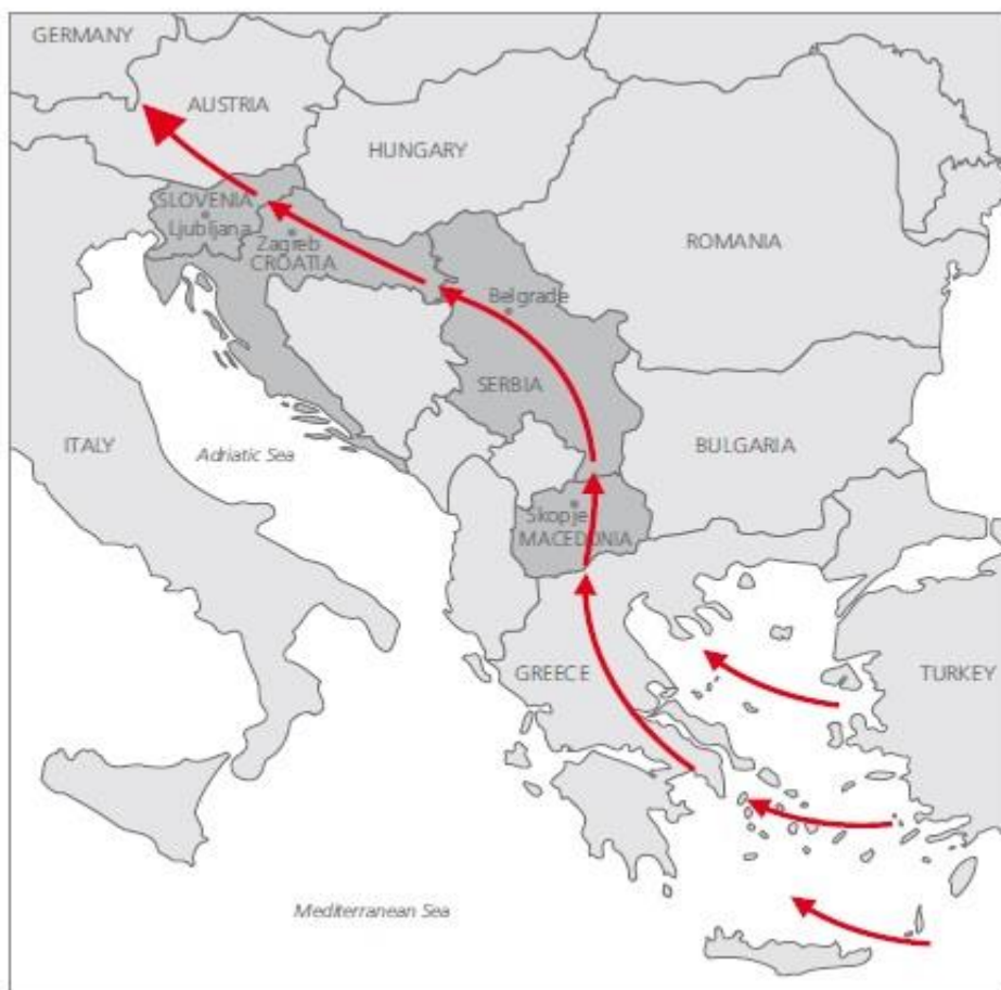
(Slika 2.)

Europskoj uniji se generalno zamjera provođenje jednostrane politike u potpunoj suprotnosti s njezinom retorikom, solidarne unije. (Simić, 2017). Uz to, veliki problem na periferiji je nastao sa neprovođenjem Dublinske uredbe, točnije njezinom suspenzijom. Schengenski sustav je također bio nepostojeći, samo s namjerom da se izbjegne humanitarna katastrofa. No, je li se to zapravo dogodilo? Smisao Dublinske uredbe je da država članica u kojoj je ulazak migranta zabilježen, da ju se u slučaju preskakanja država, tu osobu vrati u državu gdje je ona prvotno zabilježena. Odluka suda Europske unije, u konačnici leži pod istom interpretacijom. Stoga, odluka suda Europske unije glasi da oni migranti koji su ušli na ilegalan način na teritorij EU uz odobrenje perifernih država članica na Balkanskoj ruti, koje se i smatra odgovornima za taj postupak, da im država trebaj omogućiti prijavu za azil ili izvršiti povratak ilegalnih migranata. (Maldini, Takhashi, 2017). U suštini je to posve isto.