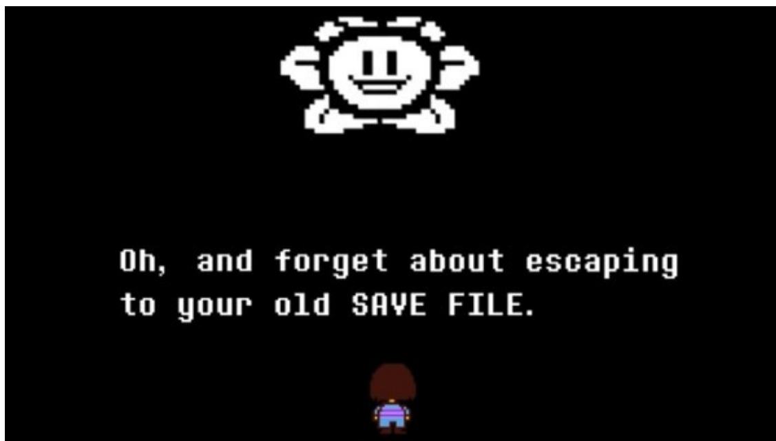
Slika 6. Undertale

primoran koristiti se agresivnim i nasilnim metodama kako bi nastavio igru. Kao što to S. Gottschalk u svojoj studiji objašnjava: „Naravno, ne sadrže sve videoigre nasilne teme, ali u velikoj većini njih nasilje je osnovna pretpostavka. Jedino relevantno pitanje koje postavlja videologija nije zahtijeva li određena situacija pregovore ili nasilje, već koliko se ono učinkovito može primijeniti. Nagrađujući nasilje s više bodova, kredita i vremena igranja, videologija također šalje jasne poruke o tome što se 'isplati' i 'radi' u igrama, a možda i 'vani'. Odabirom teme nasilja kao središnje unutar i među igrama, povezujući je sa širokim rasponom objekata, situacija i vrsta susreta, videologija pojačava kulturnu važnost nasilja i postavlja ga kao osno i organizacijsko pravilo svoje logike.” (Gottschalk 1995:7). Uvjetovani takvim tradicionalnim pristupom videoigara, igrači kao i sami kreatori igara, često su uvjereni da je borba jedini način razvijanja igre, no Undertale svojim pristupom ukazuje na alternative koje videoigra može ponuditi. Nagrađivanjem nenasilnih rješenja i ističući važnost empatije, osim što pruža kritiku nasilnoj prirodi videoigara, ukazuje na potencijal koji nenasilne igre mogu imati.