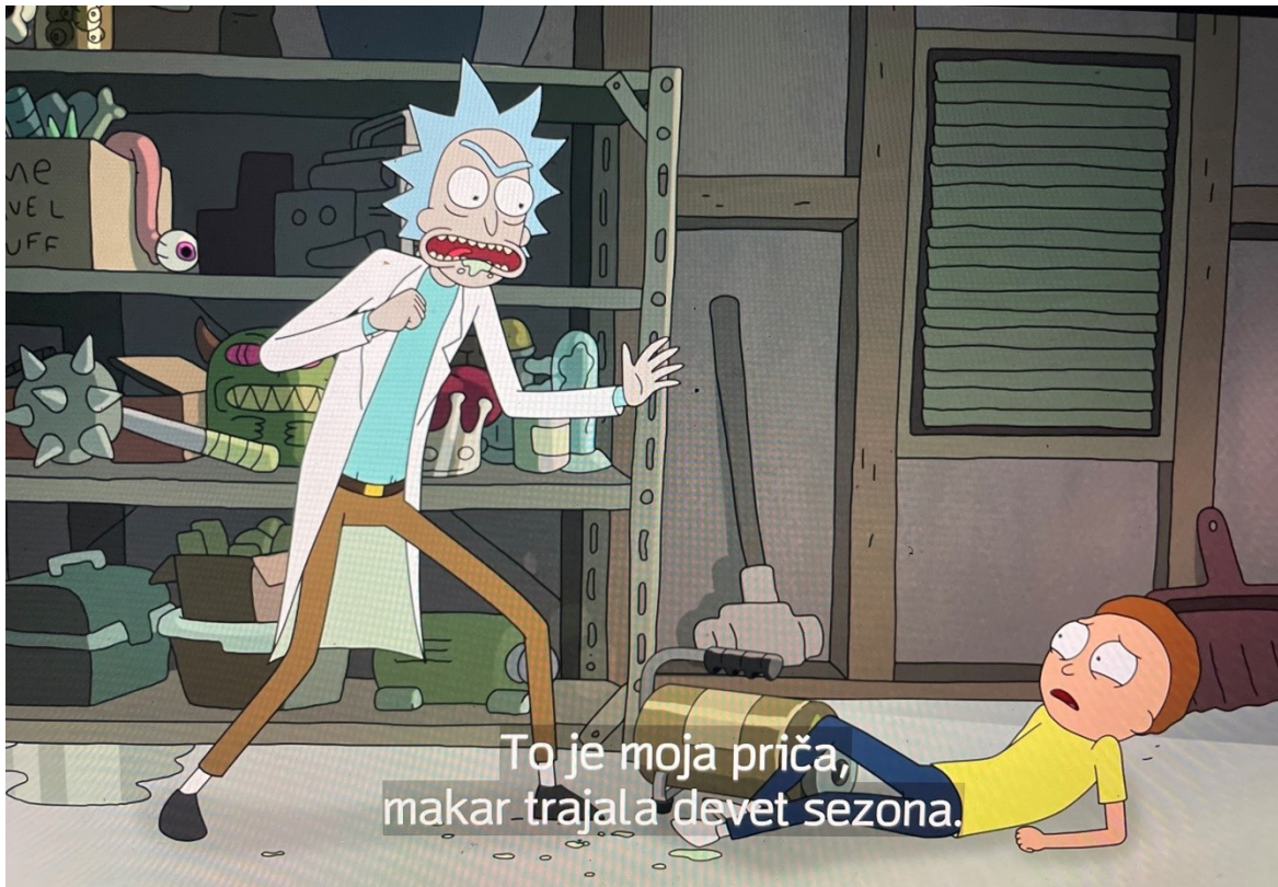
Slika 3. Rick & Morty

vrhunac spajanja stvarnog i fiktivnog svijeta direktnom komunikacijom kreatora i gledatelja kroz likove. Na ovaj način potaklo se gledatelje da se kritički uključe u medije koje konzumiraju te serija na inteligentan način aktivno radi na oblikovanju informirane i promišljate publike.