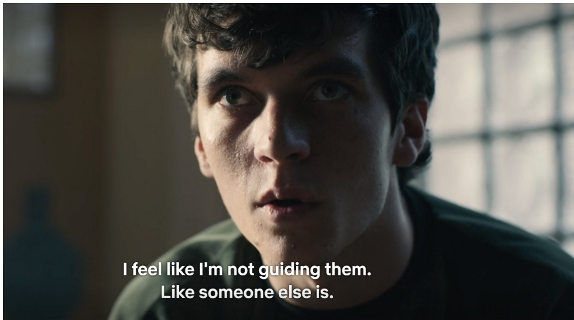
Slika 2. Scena 2 iz filma Black Mirror: Bandersnatch

dimenzija realnosti i odabira, tako i glavni lik filma počinje skretati s uma radi sve većeg uvjerenja u to da on sam ne upravlja vlastitim odlukama, dok nas također, kao gledatelje, izluđuje pritisak najboljeg odabira kako bi film imao potpuni i (potencijalno) najbolji ishod te i mi sami ispitujemo arbitrarnost izbora i slobode.