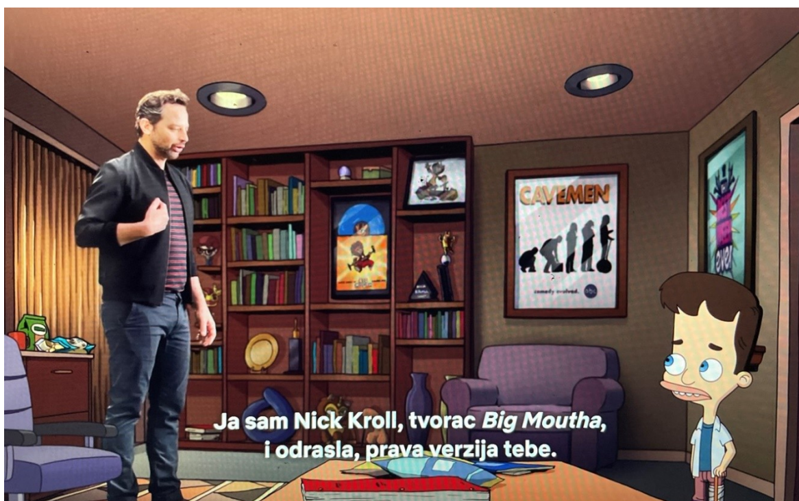
Slika 4. Big Mouth

da se suoče s vlastitim iskustvima te na taj način brišu granicu stvarnosti koju proživljavaju i fikcije koju gledaju. Tehnika direktnog obraćanja publici služi kao narativno sredstvo koje produbljuje razumijevanje likova unutar serije. Oni nerijetko direktno publici objašnjavaju svoje probleme, nesigurnosti i emocionalne poteškoće. Uzevši u obzir intimne i osjetljive tematike kojima se serija bavi te razbijanje četvrtog zida od strane likova, Big Mouth postiže autentičnu vezu između gledatelja i likova. Metafizijski elementi stoje kao zrcala unutarnje borbe adolescentnih likova čineći to iskustvo poticajnim za razmišljanje gledatelju te također pružaju platformu za raspravu o tabu temama kroz dozu humora.