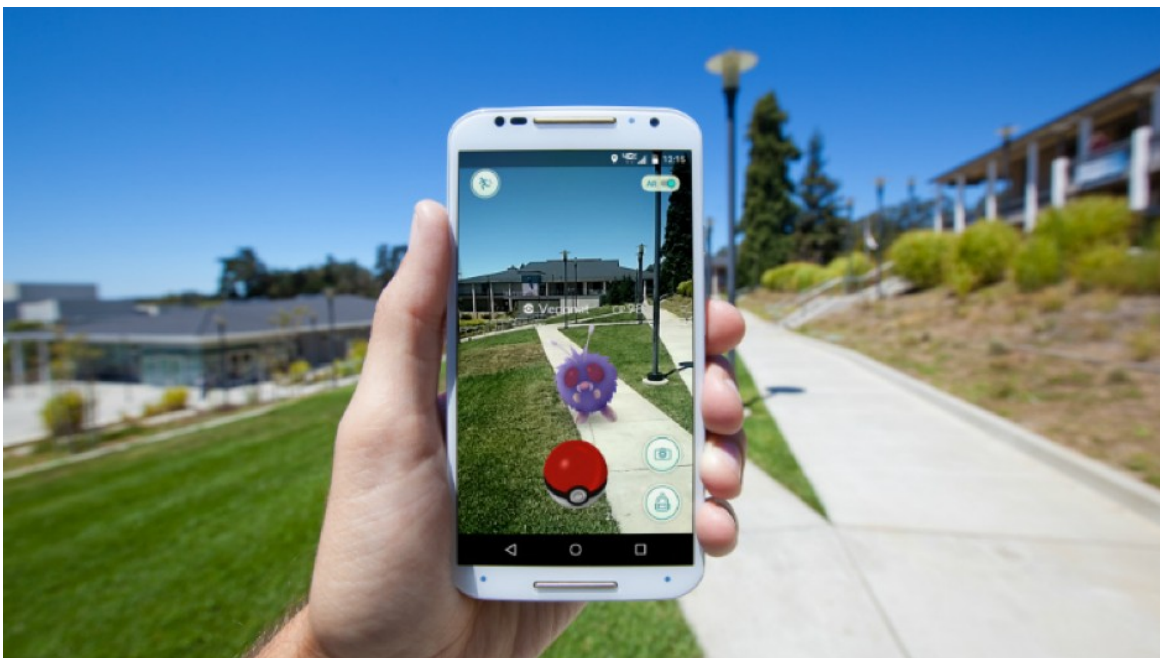
Slika 8. Pokemon GO

U sferi tehnologije, igre alternativne stvarnosti potiču tehnološko razvijanje preciznog prostornog mapiranja, što točnijeg praćenja geolokacija te napredak u domeni tehnologije senzora. Usporedno s time, u sferi zajednice igrača, igre alternativne stvarnosti potiču pojedince da istražuju svoja okruženja, da se zblizavaju s ostalim igračima te ostvaruju interakciju sa svojom zajednicom kako bi postigli određene ciljeve igre. Ovakve igre promoviraju zajednička iskustva a ne samo izoliranu samostalnu igru. Iako potiču fizičku aktivnost igrača, što nije tradicionalna karakteristika videoigara, postoji zabrinutost mogućih kršenja zakona o privatnosti radi netočnih prikupljanja geolokacijskih podataka koji nedovoljno jasno pružaju informacije o privatnim i javnim površinama.