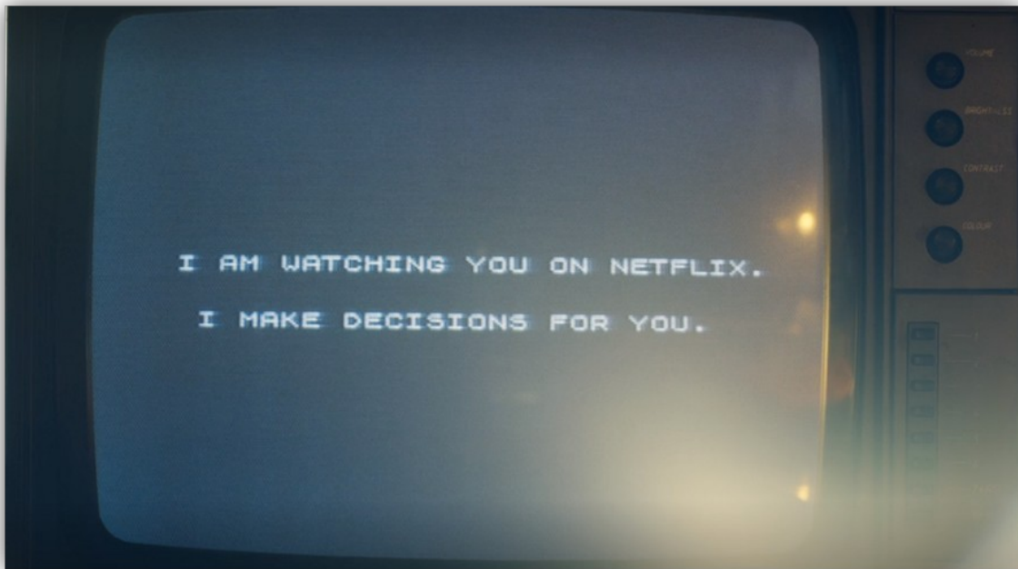
Slika 1. Scena 1 iz filma Black Mirror: Bandersnatch

U jednom od završetaka filma vidimo ženski lik koji kao Netflixov programer razvija film u kojem je glavni lik Stefan "zarobljen" te njime prikazuje sve moguće ishode koji se dešavaju Stefanu, odnosno koje smo mi mogli odabrati. Na taj način, film zatvara krug metafikcije u kojem se ponovno preklapa koncept slojevitosti narativa i povećava zapletenost. Kroz tu scenu Netflix se ponovno infiltrirao u sam narativ te pokazuje kako njegov zadatak ne završava samo na distribuciji filma već dekonstrukcijom konvencionalnih uloga dobiva važnije mjesto u slojevitoj konstrukciji priče.