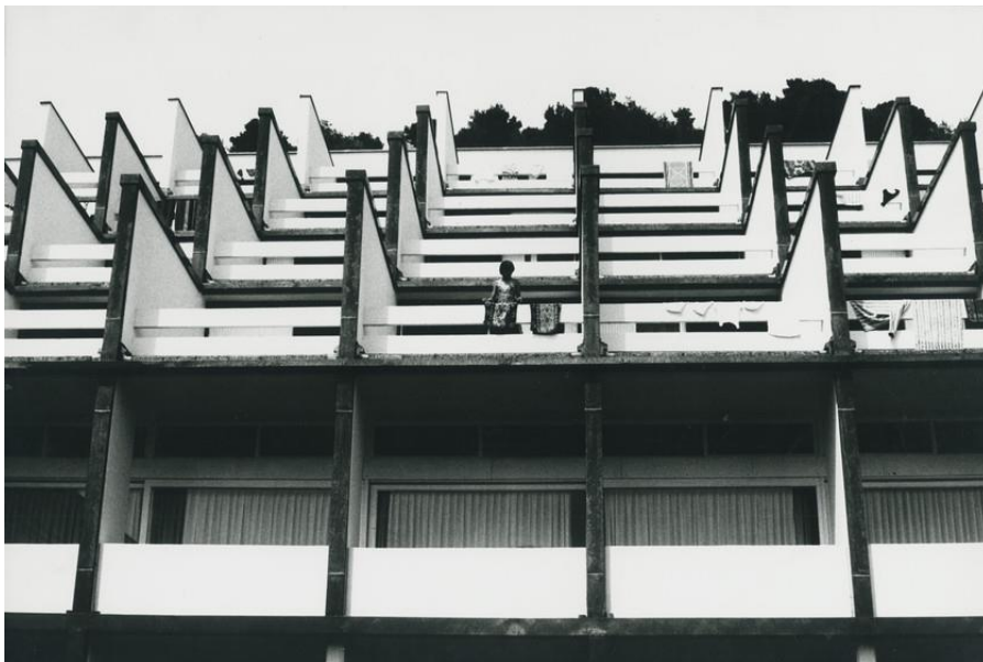
Fotografija 4. Slavka Pavić, Kuća s balkonima , 1977., fotografija, 39.8 cm x 26.5 cm, Fotoklub Zagreb (zbirka Hrvatske fotografije).

Fotografija je horizontalne kompozicije. Glavni motiv čini zid koji je vertikalno podijeljen na pet manjih dijelova koji daju ritmičnost kompoziciji fotografije. Ritmičnost je najviše naglašena blago dijagonalnim padom sjena. Na desnoj strani vidimo ljestve naslonjene na zid koje putem svoje sjene lome ritmičnost kompozicije. Ritmičnost postignutu sjenom dodatno naglašuje crno-bijela tehnika fotografiranja. Na drugim varijantama ove kompozicije ritmičnost putem sjene je i dalje prisutna, ali uz to je također prisutan i motiv čovjeka koji dodaje novi element fotografiji i pridonosi dinamičnosti kompozicije.