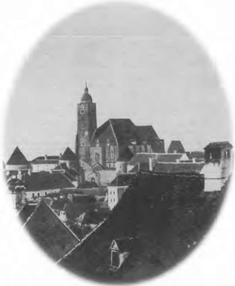
Pogled na staru zagrebačku katedralu.

Fluminensis”, rimokatolik, star osamnaest godina, student prve godine filozofije u Zagrebu. Tijekom prve godine studija postigao je najbolji uspjeh s pohvalom ( prima cum eminentia ), dok je u vladanju izvrstan ( prima ). Njegovi roditelji Matija “ex Ludimagister” i Antonija rođ. Lenac “budući da dohodaka nemaju, žive u krajnjem siromaštvu” ( quoniam reditu carentes in extrema pauperitati vivunt ). 28 U obitelji su još dvije sestre, starija u dobi od dvadeset i tri, mlađa od sedamnaest godina. Ovoga puta komisija mu je bila blagonaklona, odobrivši mu stipendiju zaklade Thonhausen u iznosu od 80 forina godišnje, koja će mu biti isplaćivana ukupno tri školske godine zaredom.