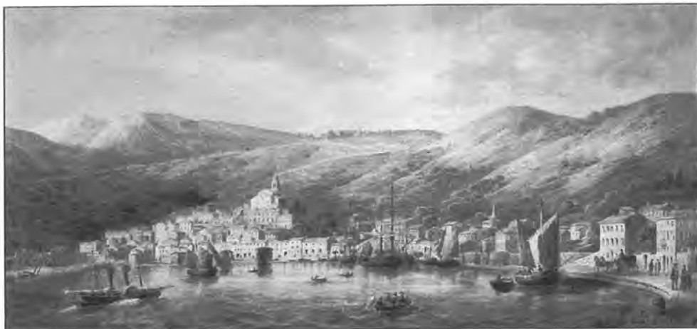
Pogled na Bakar s početka XIX. stoljeća