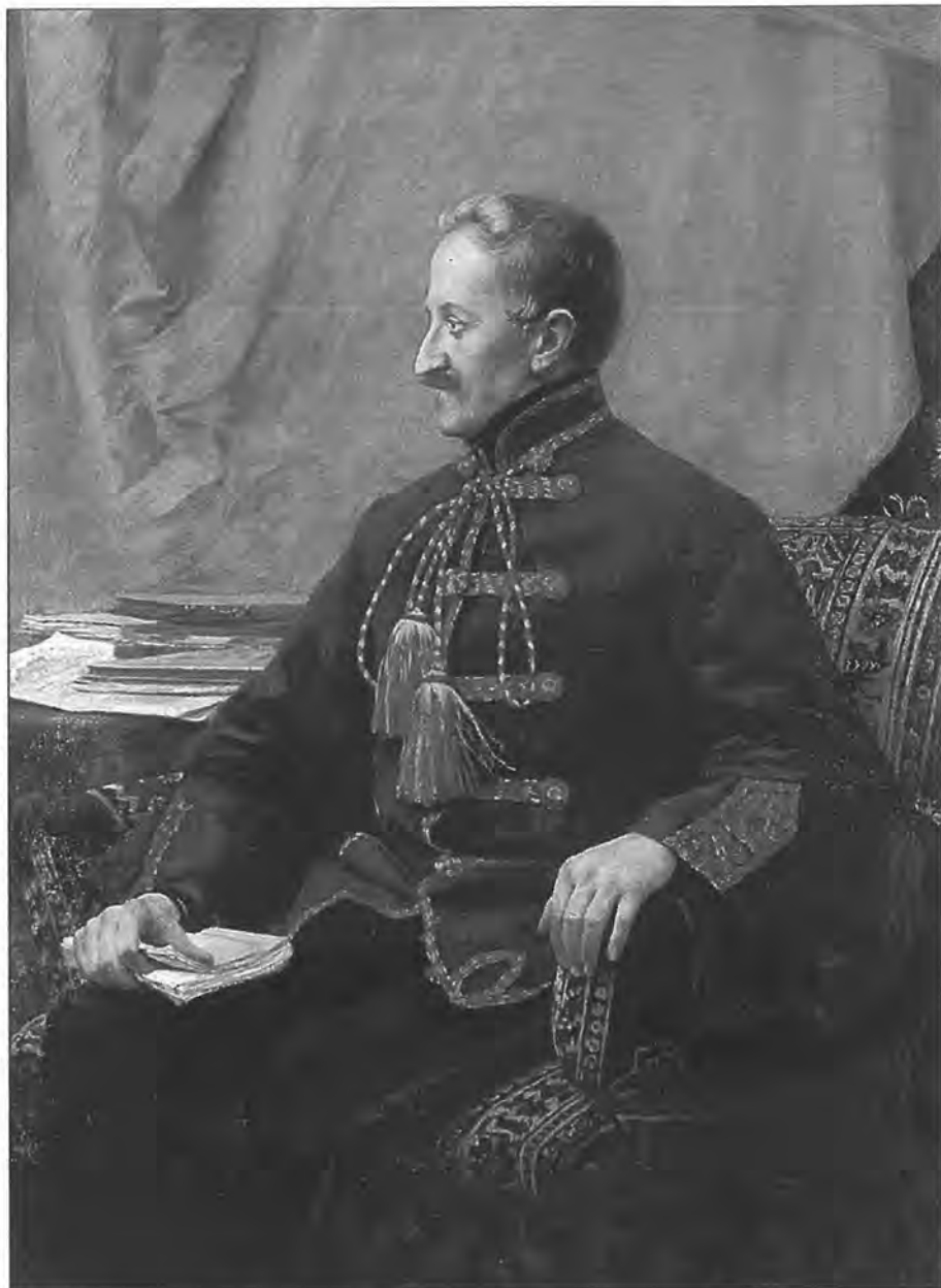
Grof Janko Drašković (1770-1856), osnivač i prvi predsjednik Matice ilirske. Nesumnjivo jedna od najznačajnijih osoba u političkom i kulturnom životu Hrvatske u prvoj polovici 19. stoljeća. Portret grofa Draškovića izradio je veliki hrvatski slikar Vlaho Bukovac. Slika se čuva u zbirci Matice hrvatske u Zagrebu.

mađarizacije. Sada je ona bila prožeta idealima slobodarstva i čovjekoljublja, izričito otklanjajući staleške razlike, te isticanjem gesla "prosvjetom k slobodi". 32 On traži promicanje trgovine, razvitak industrije, uvažavajući važnost ekonomskih i financijskih pitanja. "Kako bi liepo odotle fabrike uvesti i blagopušje privesti svojoj domovini, i po tim trgovinu, koja sad trpeća jest, dobitnu učiniti mogli, da tekar bivanje svoje u tuđih varaših pomajšnjaju, i toliko tamo zaman domovini pako na štetu ne troše. Kako liepo bi nama morsko društvo se utemelilo, i koliko ne bi Rieka i naš komerc napredovao". 33