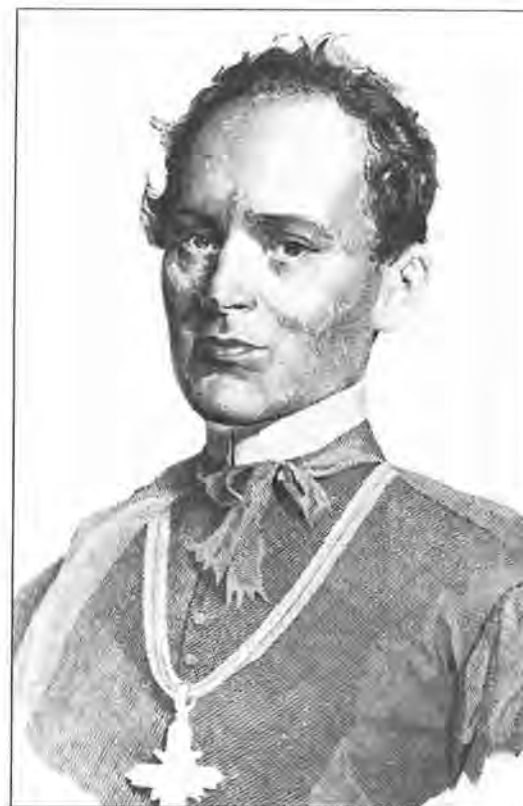
Josip Juraj Strossmayer

U sudenom 1891. Erazmo Barčić podnio je interpelaciju hrvatskom saboru, izvrgavši oštroj kritici vladinu politiku u Rijeci, predbacujući joj osobito, da pod plaštem mađarizacije u Rijeci njeguje talijanstvo. Pritom je izjavio da tadašnji riječki župnik Kajetan Bedini radi u korist peštanske vlade, nastojeći iz crkve istisnuti hrvatski jezik i Rijeku odcijepiti od senjske biskupije. Hrvatska je javnost prihvatila Barčićev stav, pa sveučilišna omladina radi toga organizira prosvjede i šalje deputaciju biskupu Strossmayeru, tražeći od njega da se u Vatikanu zauzme za riječku stvar. 297