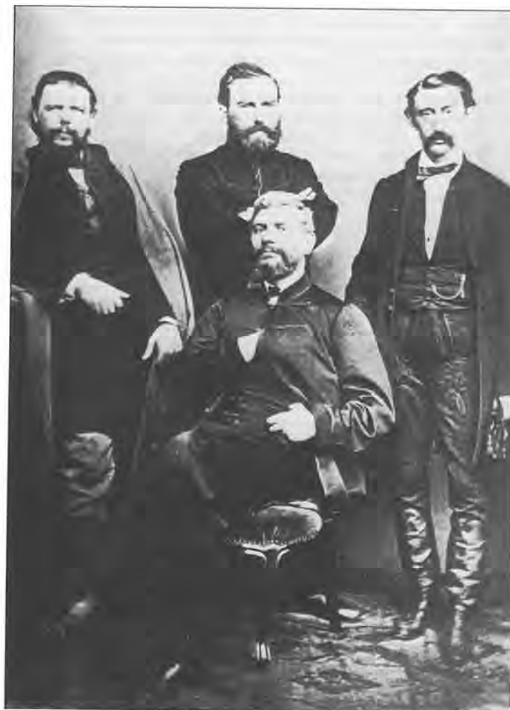
Ante Starčević (sjedi) sa zastupnicima Stranke prava, 1868. godine.

”Predstavke, što je Starčević pisao u ime občinstva županije riečke, nisu se dakako odobravale u banskom dvoru i kod namjesničkog vieća, ter veliki župan Zmajić imao je radi njih dosta neprilika. Kad su mu gospoda u Zagrebu spočitavali, što ne pazi, on bi im odvrćao: Kad ih Stari u skupštini čita, kano da moli “otče naš!”. Ni vi, gospodo, nebi u njima ništa zla opazili! Čini se, da su iz Zagreba stizale sve to oštrije poruke, tako da se