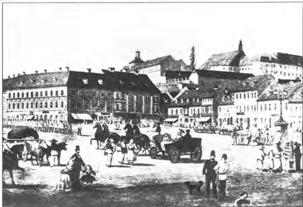
Julije Hühn, Zagreb, Harmica 1860. godine

naperene, smatrati nego kako rujanje ili, preuzetnost; osim da mi primorski Hrvati, duhom zapadne civilizacije opojeni, nebi morda znali pojmiti duh orientalne civilizacije, pod uplivom koje stoje naša braća tim više, čim su više od mora oddaljeni.