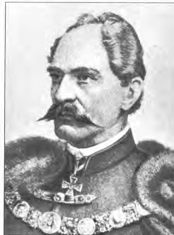
Ivan Kukuljević Sakcinski

Vjerojatni razlog radi kojega mu se odlučuje pisati na talijanskom, umjesto na hrvatskom, leži u tadašnjim sve napetijim političkim okolnostima rane apsolutističke ere, u kojoj su se pisma nalazila pod policijskom prismotrom. Suppé se Mažuraniću tuži na tešku situaciju u kojoj se našao radi toga što mu je kao državnome službeniku tada bilo zabranjeno obavljati privatne odvjetničke poslove, te je gotovo bio ostao bez svoje prijašnje klijentele i doveden do ekonomske propasti. Srećom, na temelju banske odluke i pod izravnim Mažuranićevim uplivom, ova će situacija biti riješena u Suppéovu korist. U pismima opširno govori o lokalnim riječkim prilikama, upozoravajući Mažuranića na činjenicu da su mnogi mađaronski nastrojani službenici još uvijek na važnim javnim pozicijama, te da imaju nedopustivo veliki upliv na zbivanja i važne gradske poslove. Tome, nažalost, svakako pridonose i hrvatske vlasti u Zagrebu, koje kao vrhovne nadzornike u Rijeku šalju povodljive i neadekvatne osobe (npr. E. Vrbančića kojeg i poimence spominje). Na taj način jačaju se snage koje polako, pritajeno i gotovo nesmetano nastavljaju s protuhrvatskom agitacijom.