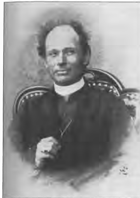
Biskup Josip Juraj Strossmayer