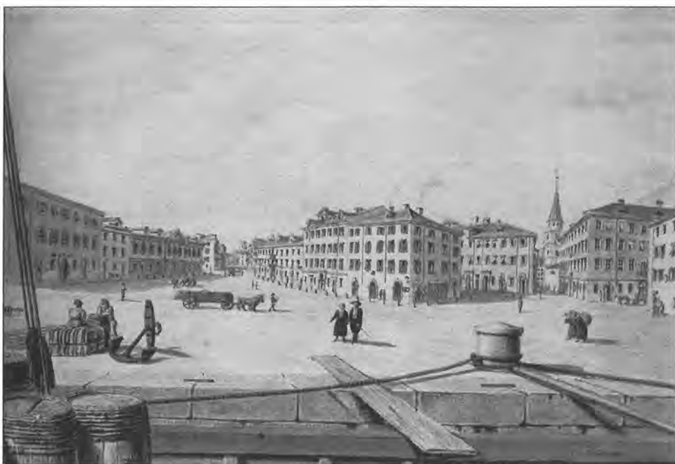
C. von Majr, Rijeka, pogled na današnji Jelačićev trg, akvarel, 22,5 x 31 cm, 1832. (Pomorski i povijesni muzej Hrvatskog primorja, Rijeka)