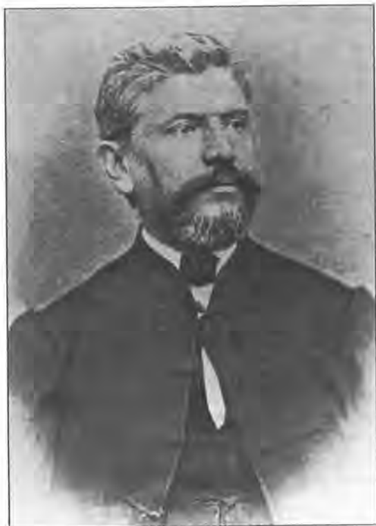
Dr. Ante Starčević