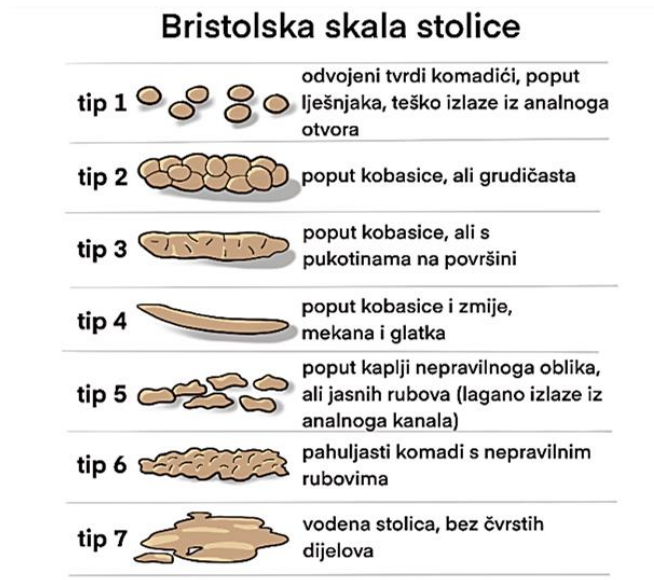
Slika 1. Bristolska skala stolice

trebali uzimati nikakve lijekove koji se inače rabe za liječenje abnormalnosti stolice (Lacy i sur., 2016). Ovisno o broju zastupljenosti navedenih tipova stolice, koja se izražava u postocima, pojedinci se klasificiraju u jedan od 3 glavna podtipa SIC-a prethodno opisana.