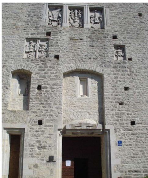
Slika 5. Grbovi na zapadnom pročelju Kaštela

Posjetom muzejima na zapadnom pročelju utvrde iznad ulaznih vrata sugerirano nam je da je Pazinski kaštel spomenik kulture upisan 1960. godine u Registar. Također naznačena je i godina prvog spomena Pazinskog kaštela i latinski mu naziv: Castrum Pisinum . Podaci su to koji posjetitelju sugeriraju kako je Pazinski kaštel jedan od najvrednijih primjeraka fortifikacijske baštine. U višim dijelovima pročelja prezentirani su i grbovi plemićkih obitelji koje su na posredan ili neposredan način odigrale značajnu ulogu u prošlosti Pazina te traka s natpisom koji spominje obnovu utvrde. Detaljnijih podataka o tome koje obitelji reprezentiraju grbovi i slično nedostaju.