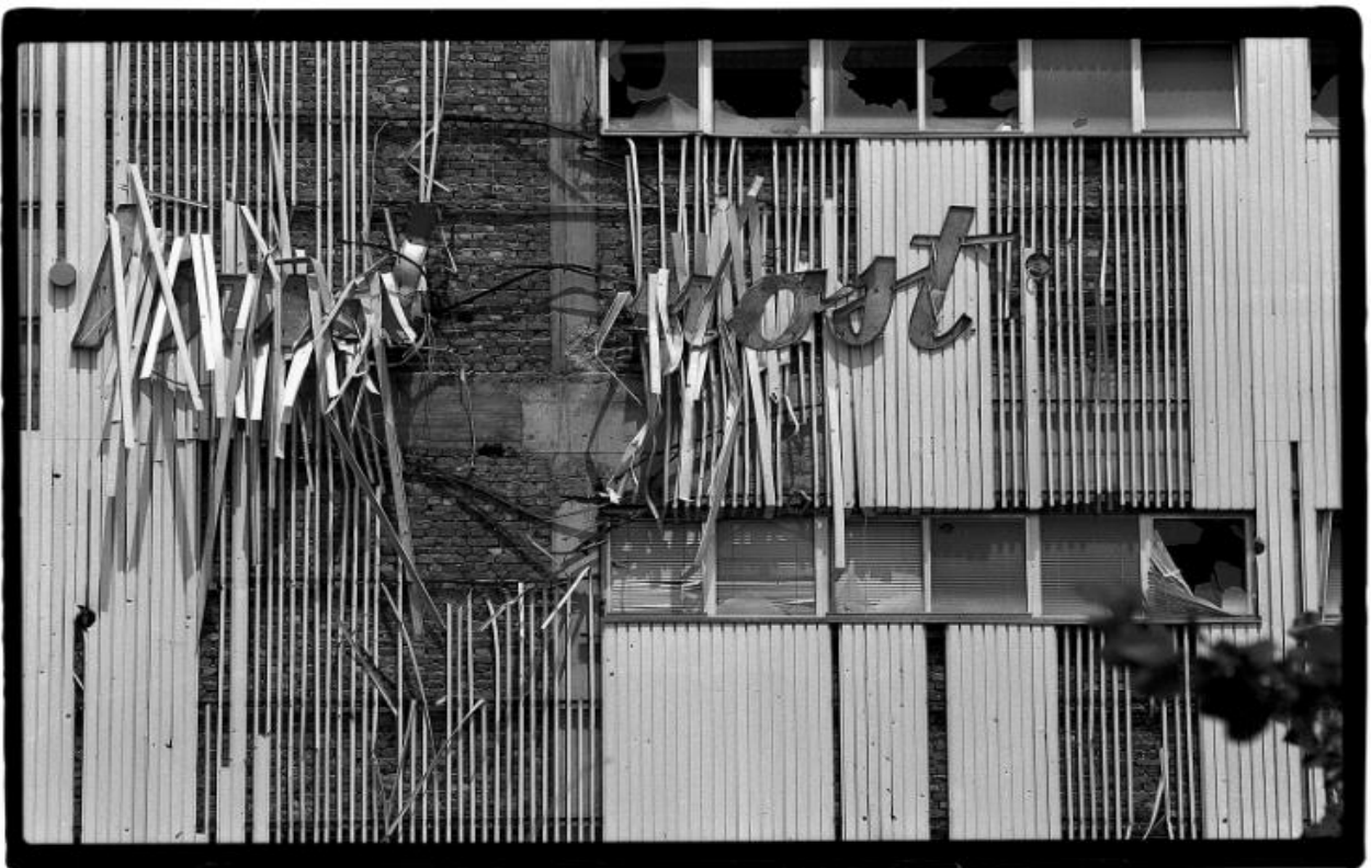
Slika 6. Darko Bavljak. Budućnost . Muzej moderne i suvremene umjetnosti. 1992.