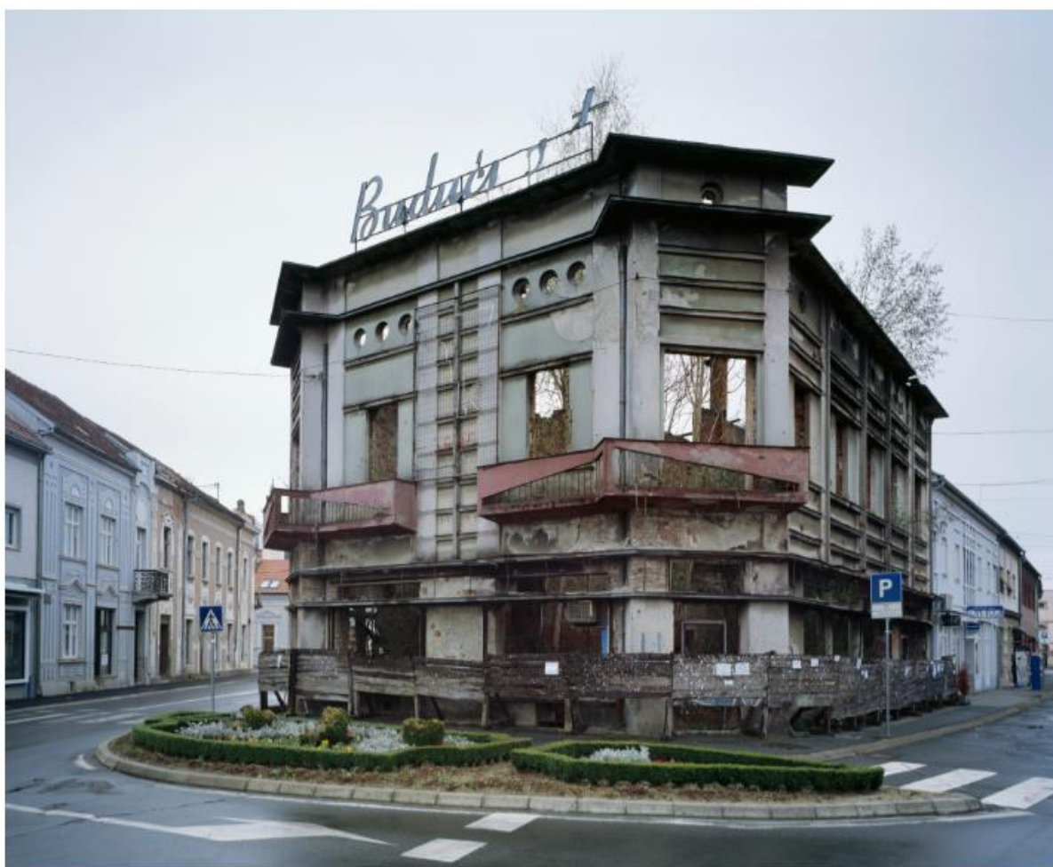
Slika 13. Bojan Mrđenović, Budućnost , 2011. – 2018.

Univerzalna istina što ju motiv budućnosti prenosi čimbenik je koji uvjetuje njegovu citatnost. Autor Bojan Mrđenović nastavlja Bavoljakov rad stvarajući parafrazu originalne serije fotografija. (Slika 13, Slika 14, Slika 15, Slika 16, Slika 17)