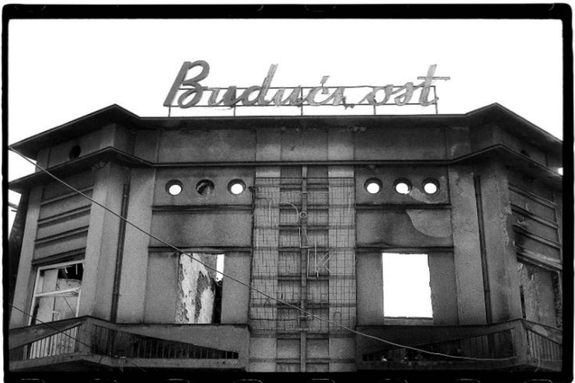
Slika 4. Darko Bavljak. Budućnost . Muzej moderne i suvremene umjetnosti. 1992.