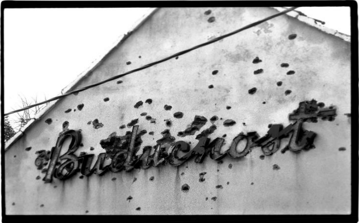
Slika 3. Darko Bavljak. Budućnost . Muzej moderne i suvremene umjetnosti.

moгуćnost autoru serijala da se natpisom referira na paradigmu prošlog vremena. Referenca obuhvaća razdoblje socijalizma kada je budućnost bila određena i kada je imala prepoznatljiv oblik koji je valjalo ispuniti.