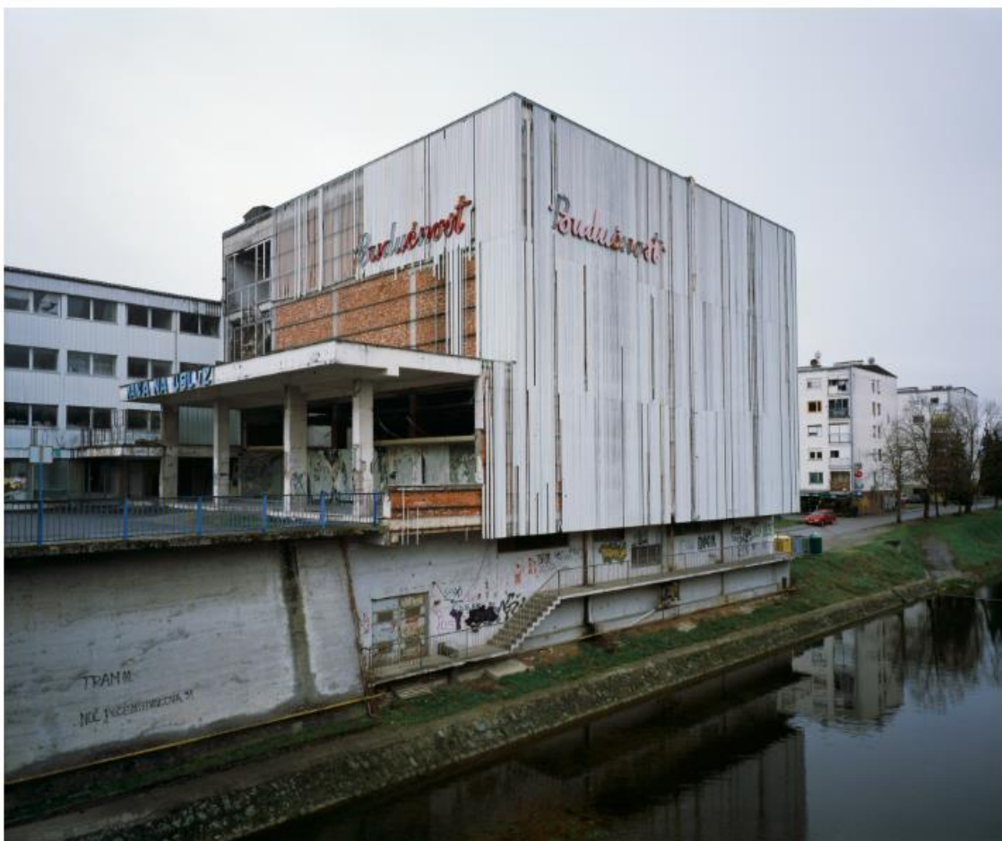
Slika 15. Bojan Mrđenović, Budućnost , 2011. – 2018.