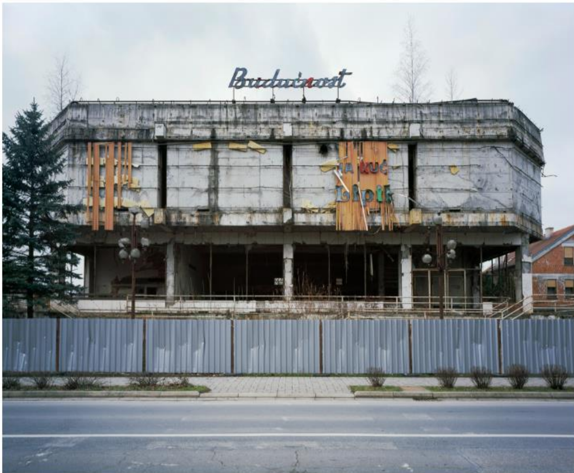
Slika 14. Bojan Mrđenović, Budućnost , 2011. – 2018.