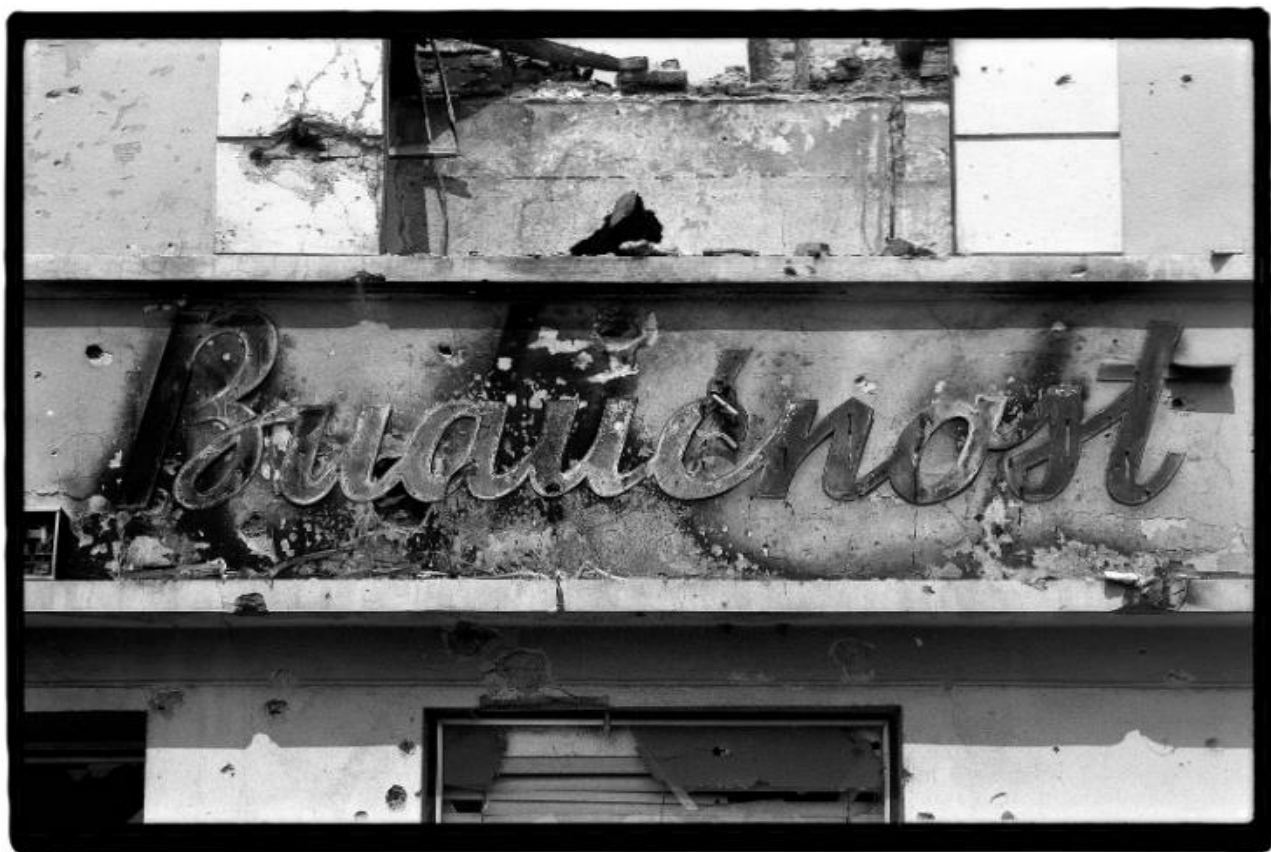
Slika 7. Darko Bavljak. Budućnost . Muzej moderne i suvremene umjetnosti. 1992.