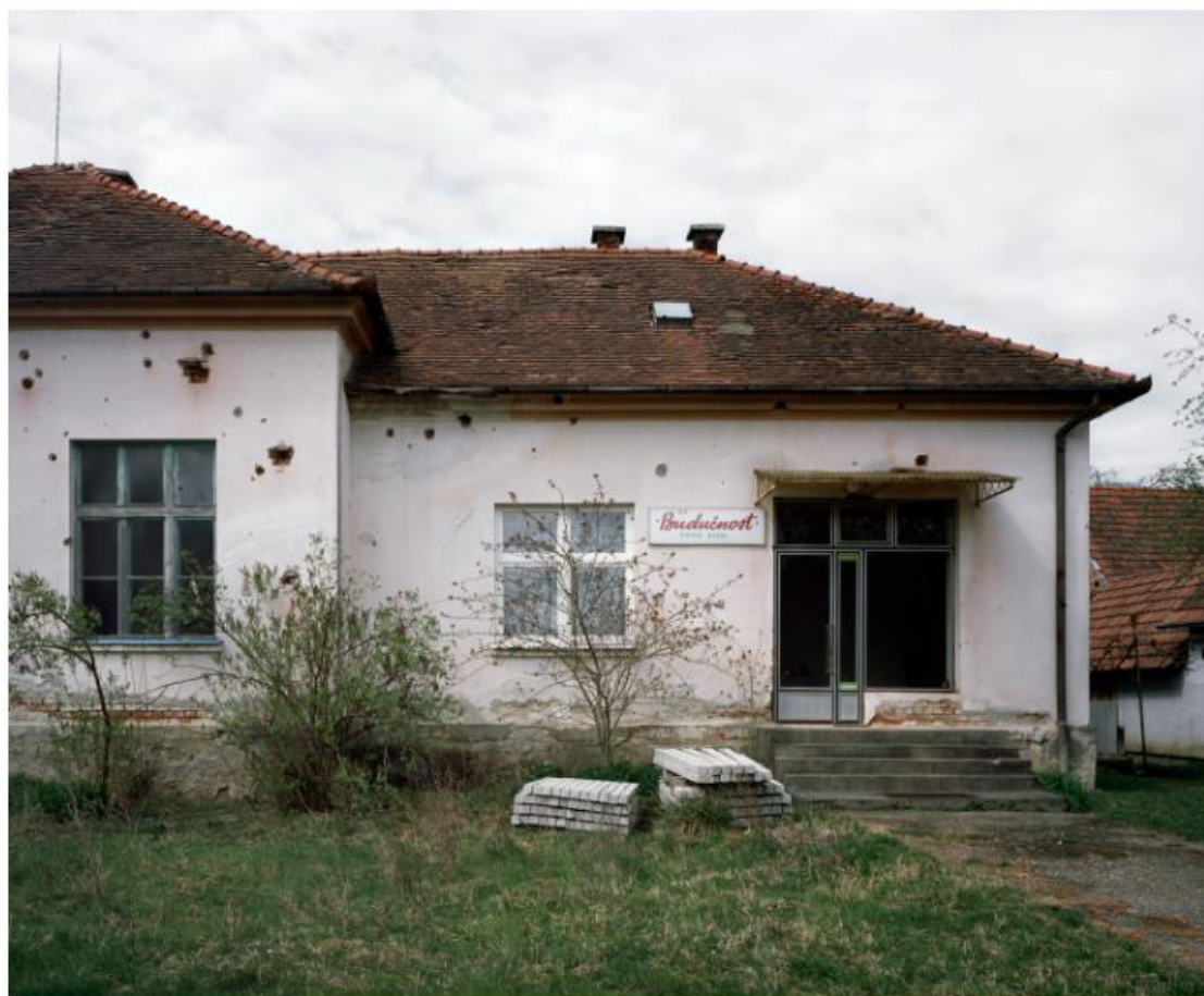
Slika 17. Bojan Mrđenović, Budućnost , 2011. – 2018.