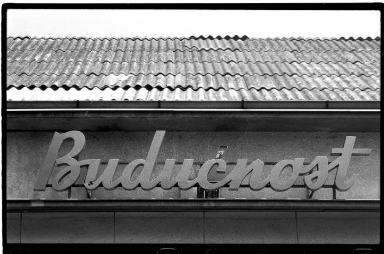
Slika 9. Darko Bavoljak. Budućnost . Muzej moderne i suvremene umjetnosti. 1992.

Prepoznatljiv oblik zgrada, odnosno specifična tipografija koja se ogleda u jednostavnosti i naglašenom funkcionalizmu zgrada poduzeća, ukazuje na pedesete godine. Prizori uništenih natpisa granatiranih i djelomično spaljenih objekata reference su budućnosti minulog vremena socijalizma, no isto postaje primjenjivo za tadašnje ratno razdoblje i nesigurne budućnosti. Nastaje 1992. godine u jeku Domovinskog rata kada D. Bavoljak kao pripadnik Satnije hrvatskih umjetnika bilježi ratna razaranja, u slučaju ovog serijala na području Pakraca i Lipika. 23