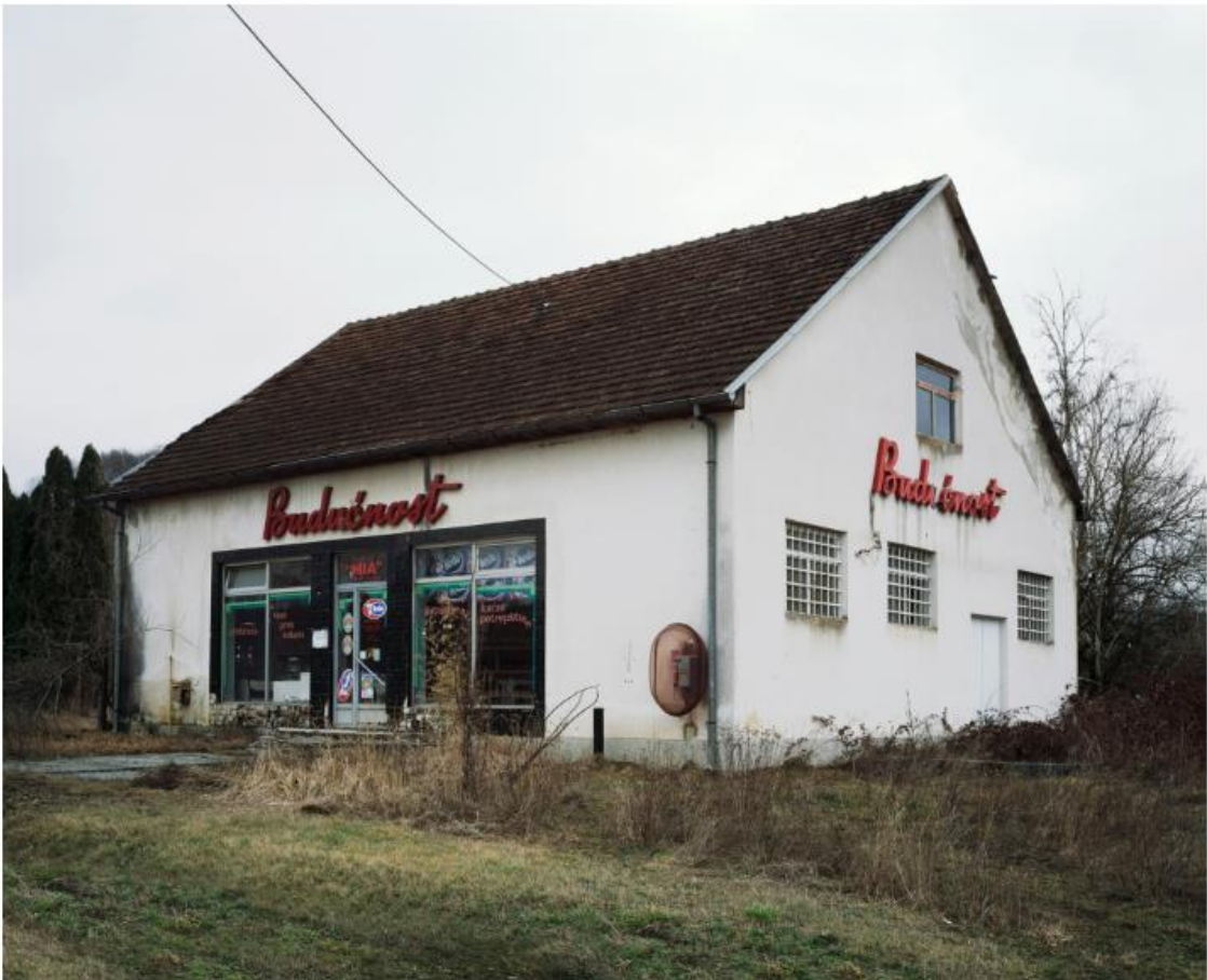
Slika 16. Bojan Mrđenović, Budućnost , 2011. – 2018.