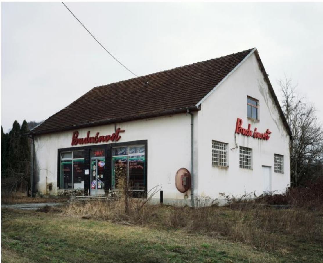
Slika 16. Bojan Mrđenović, Budućnost , 2011. – 2018.