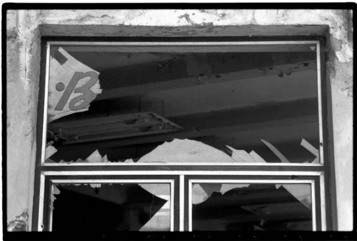
Slika 8. Darko Bavljak. Budućnost . Muzej moderne i suvremene umjetnosti. 1992.