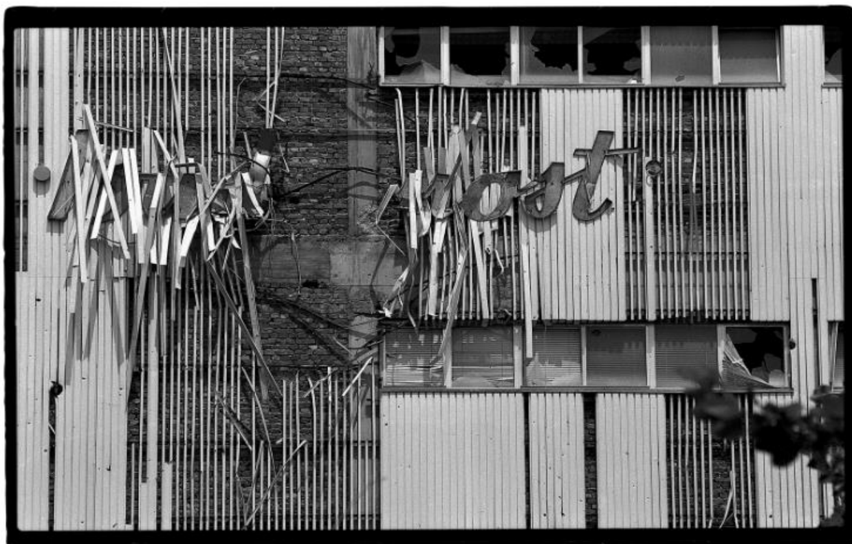
Slika 6. Darko Bavljak. Budućnost . Muzej moderne i suvremene umjetnosti. 1992.