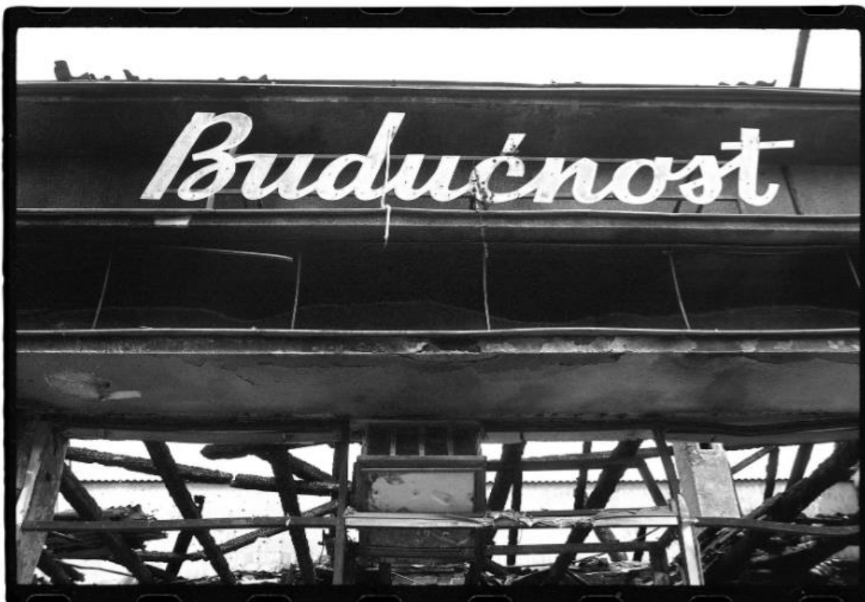
Slika 5. Darko Bavljak. Budućnost . Muzej moderne i suvremene umjetnosti. 1992.