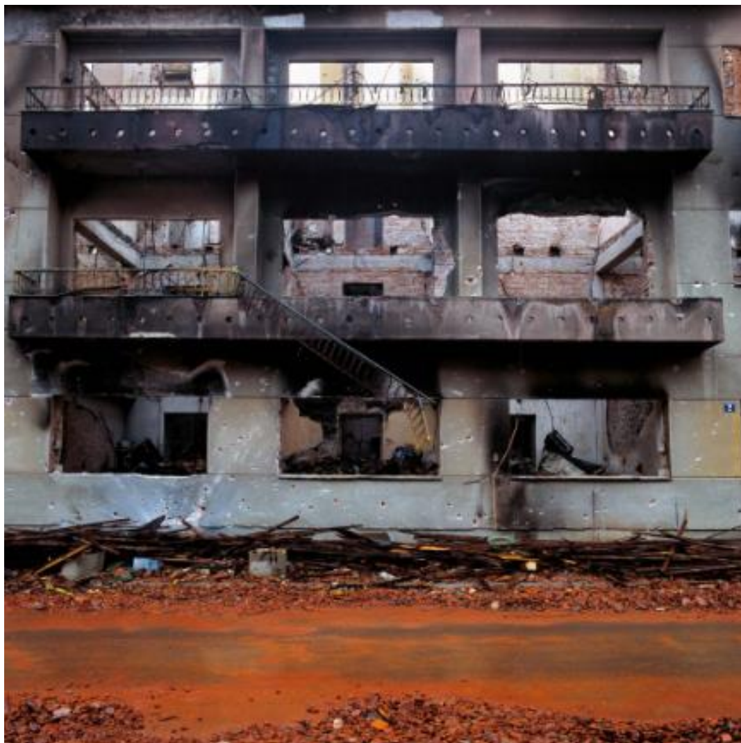
Slika 10. Damir Fabijanić. Stambena Zgrada Pakrac . 1992.

U kontekstu Fabijanićevog rada valja spomenuti fotografije ratom razorenog Dubrovnika. Zanimljivo je istaknuti kako autor u dva posebna trenutka fotografira Dubrovnik, netom prije napada 1989. godine, a zatim 1992. nakon razaranja stvarivši kvalitetnu referencu situacije prije – poslije, odnosno fotografijom ratom razorenog Dubrovnika, razrušenih kulturnih spomenika izvještava o ratnoj zbilji. 24 (Slika 11)