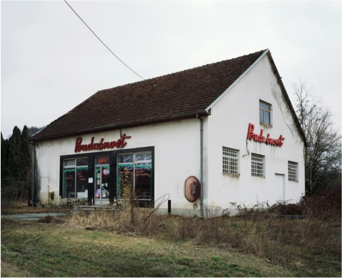
Slika 16. Bojan Mrđenović, Budućnost , 2011. – 2018.