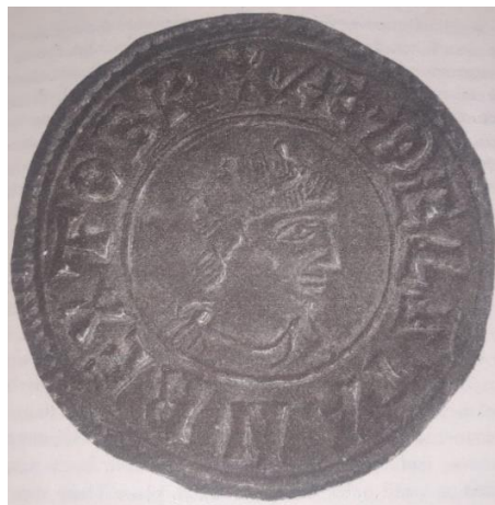
Sl. 1 - Novac s likom Etelstana koji nosi krunu i nazivom „kraljem čitave Britanije“ ( rex totius Britanniae ) (Morris 2022, str. 265)

Etelstanov program ujedinjenja Britanije također je vidljiv i u zakonodavstvu, te se u sačuvanih šest dokumenata koji sačinjavaju tzv. Leges Aethelstani , odnosno Etelstanove zakone vidi nastojanje za ujedinjenjem različitih zakonskih sustava anglosaskih kraljevstava koje je Etelstan pokorio nakon Eamonta. 37 Vjerojatno su bili sastavljeni i obznanjeni početkom 930-ih godina te se mogu shvatiti kao nadogradnja na zakone Etelberta od Kenta i Etelstanovog djeda Alfreda, a pokrivaju brojna područja poput građanskih, kaznenih i crkvenih zakona. 38 Osim toga, novost koju Etelstanovi zakoni donose je i naglašavanje važnosti kraljevskog autoriteta i jedinstva kraljevstva kroz osobu kralja, čiji zakoni nadvladavaju lokalne i regionalne zakone te su stvoreni s ciljem centralizacije moći. 39 Sarah Foot povezuje učestalost spominjanja kazni za narušavanje mira i krađe s Etelstanovim centralističkim tendencijama i uzdizanjem kraljevske pozicije kao vrhovne, kao i važnost koju je Etelstan davao osobnoj odanosti njemu samome. 40