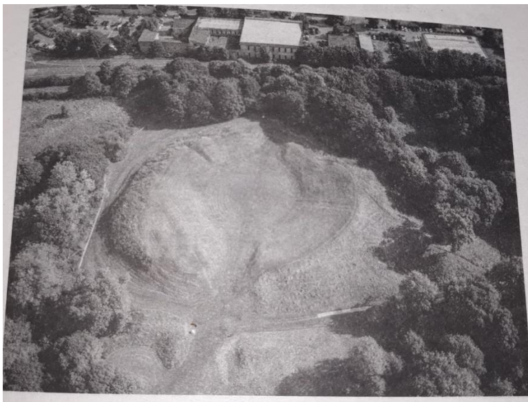
Sl. 3. Ostaci rimskog amfiteatra u Cirencesteru (Morris 2022, str. 269)