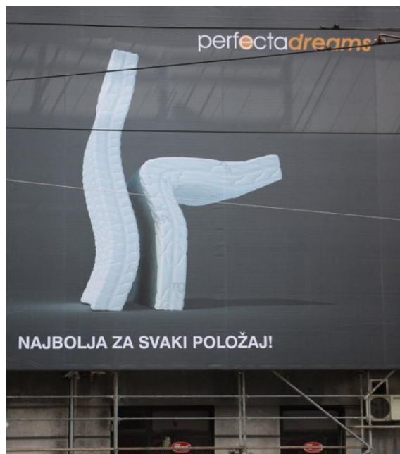
Slika 24. Reklama za Perfecta Dreams madrace (2010.)

Reklama slikovno prikazuje seksualni čin, a sloganom Najbolja za svaki položaj! žene svodi na fizičke objekte. Ovdje se reklamiraju madraci pa bi pridjev trebao biti u muškom rodu ( najbolji ), no ova reklama šalje i jednu drugačiju poruku. Žena je u reklamama prikazana na uvredljiv način, a sam natpis daje nam do znanja da je žena predmet kojim se upravlja. Ova je reklama krajnje omalovažavajuća, a potiče seksizam i rodne stereotipe.