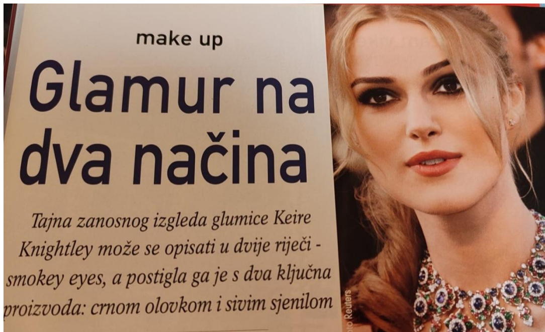
Slika 1. Reklama za kozmetičke proizvode ( Gloria , ožujak 2006., broj 41)

U ovoj se Glorijinoj reklami promoviraju kozmetički proizvodi koje koristi i slavna glumica Keira Knightley. Reklama se proteže kroz cijelu stranicu, a ispod prikazane slike izloženi su spomenuti ključni proizvodi: olovka za oči i sjenilo te cijeli dodatni komplet proizvoda: olovka za obrve, ruž za usne, tekući puder i MaxFactor maskara koje također koristi poznata glumica. Naravno, osnovni cilj reklame jest privući kupce kod kojih se javlja divljenje prema prekrasnoj, savršeno našminkanoj glumici i njezinim zavidnim crtama lica. Dio rečenice koji posebno privlači našu pažnju jest tajna zanosnog izgleda , odnosno sintagma zanosni izgled . Zašto bi izgled trebao biti zanosan i koga bi trebao zanimati ? Žene mogu težiti ljepoti same zbog sebe i zbog osobnog užitka, no ova se reklama može shvatiti i u smislu privlačenja muškaraca. Osim toga, ovakve reklame mogu imati i negativne posljedice koje smo spomenuli u poglavlju 6.1. Rečeno je da reklame vrlo često promoviraju nedostižnu ljepotu i različitim računalnim programima kreiraju nestvaran izgled. Ukoliko pomnije promotrimo prikazanu fotografiju, vidjet ćemo da na prekrasnoj glumici ne postoji niti jedna nesavršenost, što vrlo teško postižu i najbolji profesionalni kozmetičari. Tako, primjerice, Knightley ima madež iznad desne obrve, no on je na ovoj fotografiji u potpunosti uklonjen ili je prekriven njezinom kosom. Glumica je prvenstveno prikazana kako bi zaplijenila pažnju korisnika i