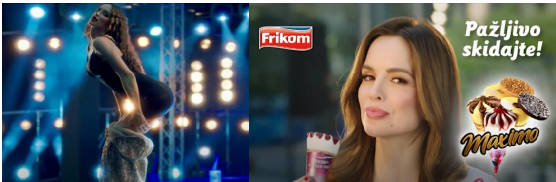
Slika 21. Reklama za sladoled Maximo (2014.) 17

Pjevačica je u ovoj reklami gotovo potpuno razodjevena, a svojim zavodljivim pogledom, položajem usana i pokretima hipnotizira muškarce te ih potom poziva da kušaju sladoled Maximo . Prilikom otvaranja sladoleda upućuje im sljedeću rečenicu: Pažljivo skidajte! . Ova reklama ima seksističke naznake, a završnom rečenicom publici šalje dvosmislenu poruku – skidanje se ne odnosi samo na omot sladoleda, već i na žene koje se ovdje svode na fizičke objekte.