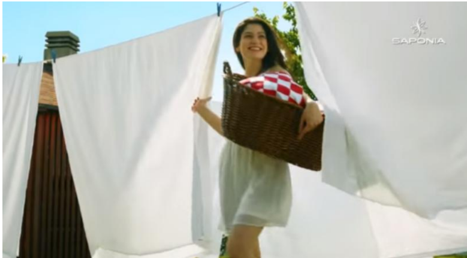
Slika 20. Reklama za Saponiju Osijek (2016.) 16

poslovno. Ta nam činjenica daje do znanja da žene u reklamama više nisu domaćice, već poslovne žene koje nakon dolaska kući spremaju ručak za svoju obitelj. Sljedeća reklama nastala je za vrijeme Europskog prvenstva u nogometu, a govori da iza svakog hrvatskog navijača stoji jedna žena :