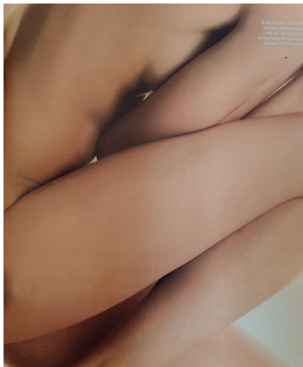
Slika 5. Reklama za hidratantne losione ( Gloria , rujan 2005, broj 19)

Spomenuli smo kako su žene često prikazane s vrlo malo odjeće ili potpuno obnažene, a takve su reklame pronađene u starijim brojevima: