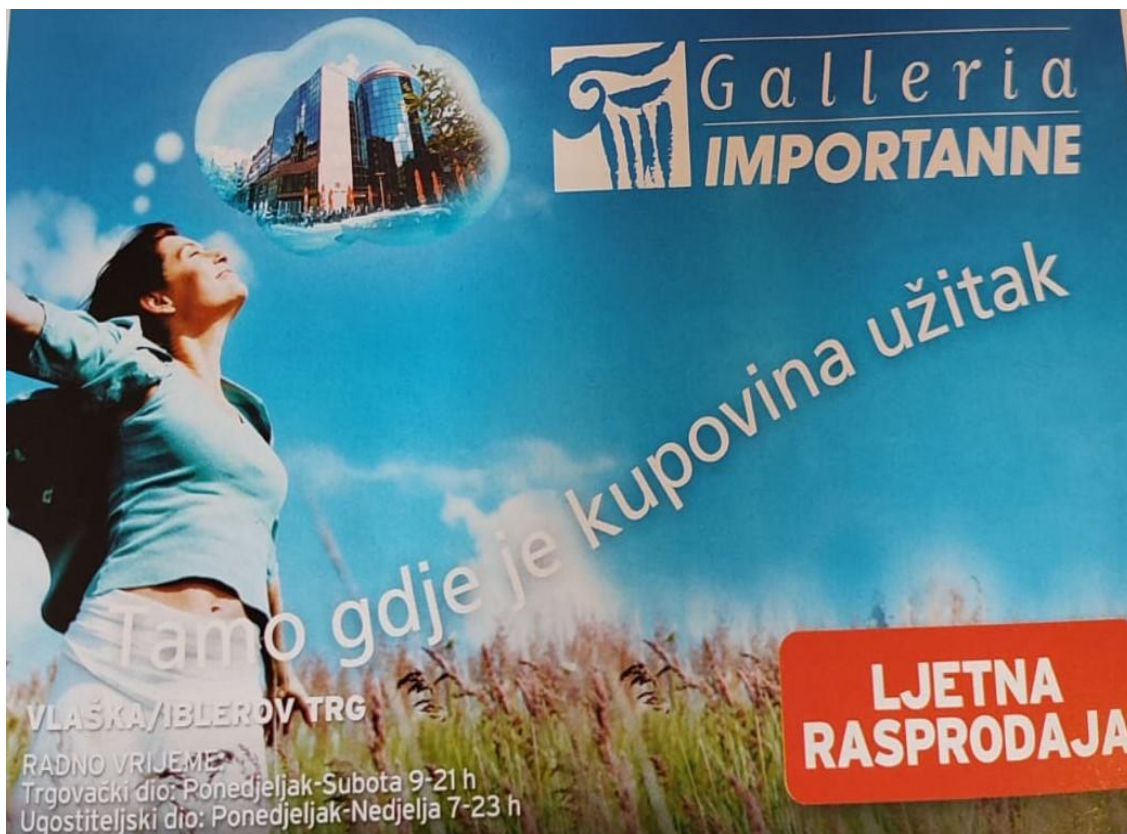
Slika 13. Reklama za trgovački centar Galleria Importanne ( Gloria , kolovoz 2006., broj 62)

Fotografija prikazuje reklamu za ljetnu rasprodaju u zagrebačkom trgovačkom centru Galleria Importanne . Na slici je prikaza žena koja uživa u šetnji prirodom, a pritom razmišlja o ljetnim popustima u omiljenom centru gdje je kupovina užitak . Na ženi vidimo ushićenje, sreću i osmijeh koje izaziva sama pomisao na kupovinu. Ona sanjari o odlasku u trgovački centar i uživa u tome. Šetnja prirodom i uživanje u ljetnom povjetarcu moglo bi se povezati s onim osjećajima koje kod žena izaziva kupnja. Ustaljena je misao kako su muškarci oni koji zarađuju, a žene te koje troše novac provodeći veliku količinu vremena u trgovinama. To možda i jest točno u nekim slučajevima, no žene zasigurno nisu jedine koje uživaju u kupovini – veliki broj muškaraca provede istu ili veću količinu vremena kupujući proizvode i šeući po trgovačkim centrima. Nas ovdje zanimaju stereotipi, a opće je poznato da će se za pojam kupovine gotovo uvijek prvenstveno vezati žene, posebice jer su one te koje bi trebale nabavljati namirnice i brinuti o kuhinji i domu. Reklame znatno učvršćuju ove stereotipe: