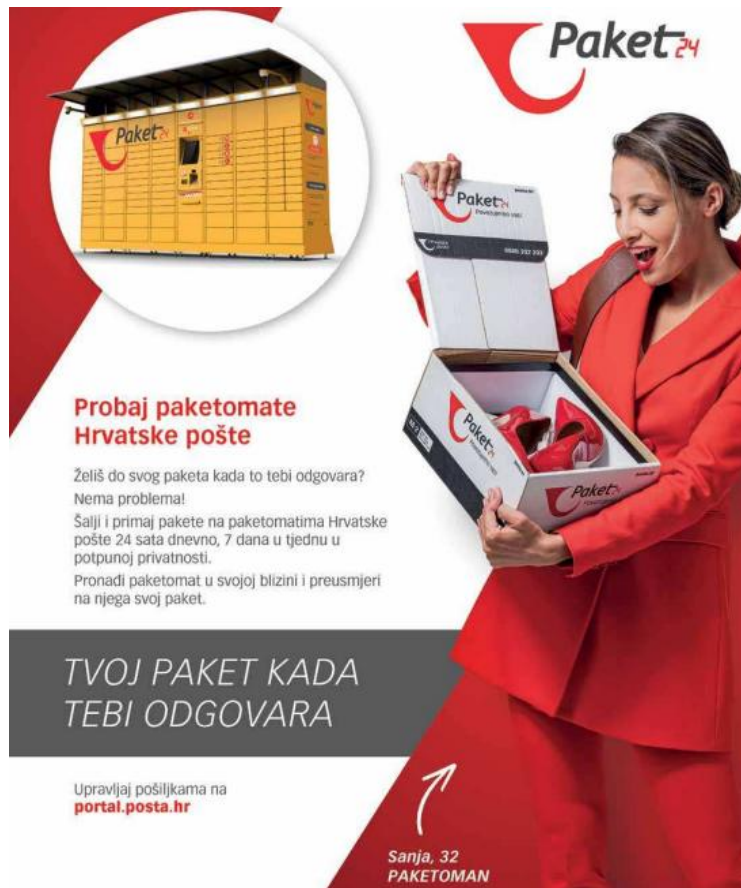
Slika 15. Reklama za paketomate Hrvatske pošte (Gloria, lipanj 2021., broj 1381)

opskrbiti sebe, dom i djecu sa svime što joj je potrebno. Naravno, ne mora značiti da je kreator reklame imao upravo ovu ideju, no stereotip je svakako vidljiv već u prvoj rečenici. Da su žene one koje uživaju u kupovini, trošenju novaca i naručivanju različitih proizvoda, govori nam i sljedeća reklama: