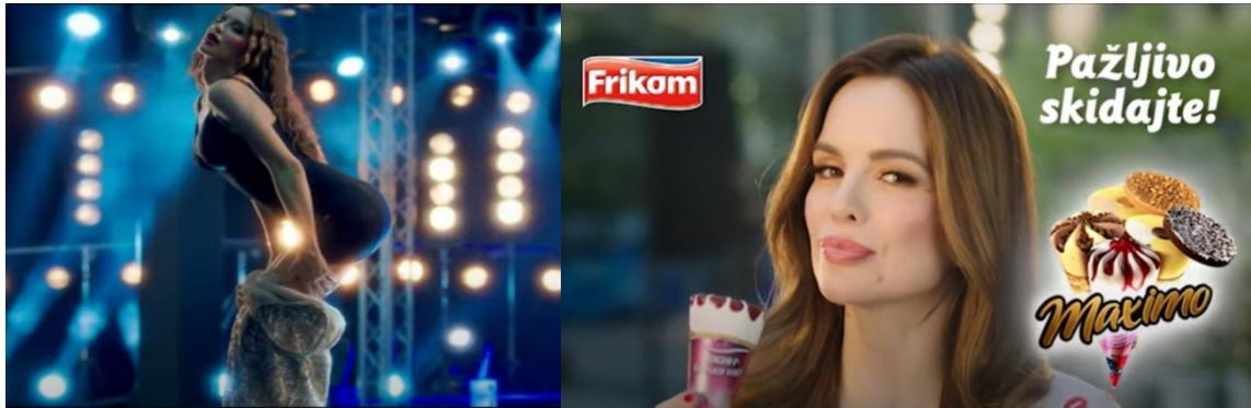
Slika 21. Reklama za sladoled Maximo (2014.) 17

Pjevačica je u ovoj reklami gotovo potpuno razodjevena, a svojim zavodljivim pogledom, položajem usana i pokretima hipnotizira muškarce te ih potom poziva da kušaju sladoled Maximo . Prilikom otvaranja sladoleda upućuje im sljedeću rečenicu: Pažljivo skidajte! . Ova reklama ima seksističke naznake, a završnom rečenicom publici šalje dvosmislenu poruku – skidanje se ne odnosi samo na omot sladoleda, već i na žene koje se ovdje svode na fizičke objekte.