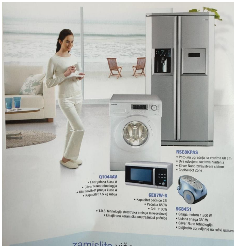
Slika 16. Reklama za Samsung kućanske aparate ( Gloria , lipanj 2006., broj 55)

U časopisu Gloria pronađene su i reklame koje ženama pripisuju tradicionalne rodne uloge, odnosno one koje ih smještaju u okrilje doma i kuhinje. Takve su reklame pronađene u starijim i novijim brojevima: