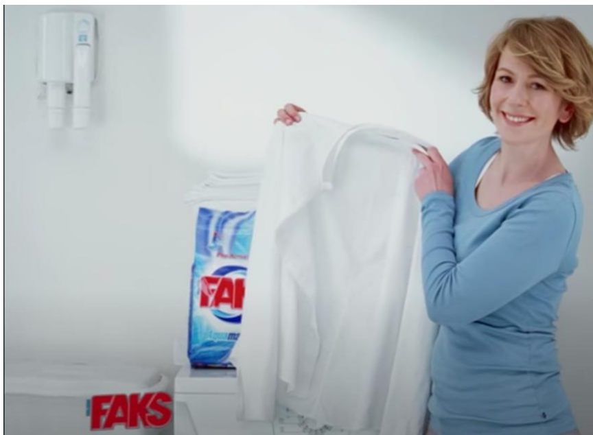
Slika 18. Reklama za Faks Helizim , Saponia Osijek (2011.) 14

U prethodnom su poglavlju analizirane reklame iz tiskanog medija u kojima su pronađeni sljedeći problemi: ženama se nameće nestvarni ideal ljepote, one su objektivizirane, podčinjene maštarijama muškaraca, „žive“ od kupovine, a prvenstveno im se dodjeljuju tradicionalne uloge – kuhanje, čišćenje i briga za obitelj. U ovom je poglavlju analizirano nekoliko televizijskih reklama u kojima su također prisutni rodni stereotipi. U radu je nekoliko puta navedeno kako su stereotipi društveni konstrukti s kojima se susrećemo već u najranijoj životnoj dobi, ponajprije u krugu obitelji i putem televizije. Televizijske reklame mogli bismo odrediti kao najzanimljivije: one prenose cijelu „video-priču“, dok tiskani mediji ili reklamni panoi nude isključivo fotografije. U televizijskim reklamama najčešće prepoznajemo stereotip žene domaćice. U gotovo svim reklamama koje se odnose na sredstva za čišćenje prikazana je vrijedna majka i supruga: