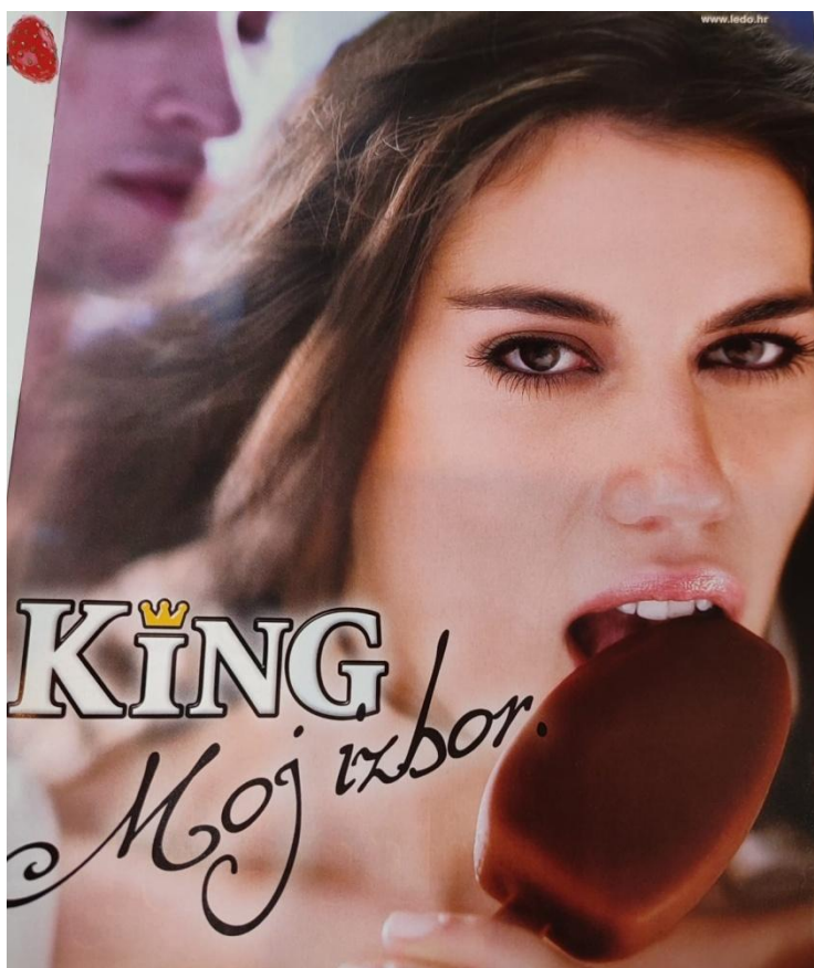
Slika 12. Reklama za sladoled King (Gloria, srpanj 2006., broj 61)

U ovoj reklami, koja se također proteže kroz cijelu stranicu časopisa, vidimo atraktivnu mladu ženu koja „zavodljivo“ konzumira sladoled King. Ona svojim pogledom plijeni pažnju, a natpisom King, Moj izbor. poručuje da želi svoga „kralja“. Iza žene koja je u prvom planu vidimo muškarca koji joj prilazi s leđa, privučen njezinom zavodljivošću i atraktivnošću. Ova reklama ima dvojaku poruku: žena bira sladoled King, ali i muškarca koji će bit njezin kralj i koji će se brinuti o njoj. Žena je u ovoj reklami prikazana kao objekt, podčinjena maštarijama superiornih i dominantnih muškaraca (Labaš, Košćević 2014).