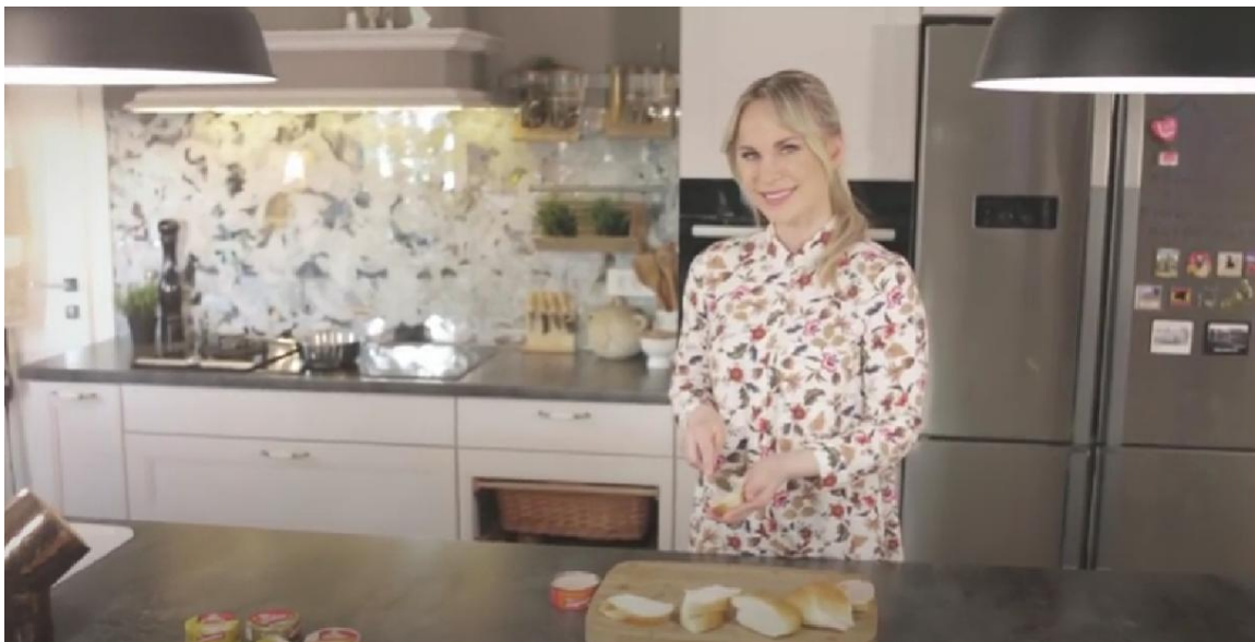
Slika 19. Reklama za Gavrilović paštete (2018.) 15

svojoj obitelji i pritom ističe kako je kuhanje za nju oduvijek bilo užitak. U sljedećoj sceni zadovoljno promatra svoje nećake koji uživaju u posluženoj hrani. Navodi kako nakon ručka i dječje igre posvuda ostaju mrlje te kako je njezin recept za čistoću Faks Helizim . U reklami vidimo više tradicionalnih ženskih uloga: kuhanje, spremanje, čišćenje i pranje rublja. Pritom se niti u jednom trenutku u ne pojavljuje muškarac koji bi ženi pomogao u kućanskim poslovima. Žena je prvo prikazana u pregači, a potom u udobnoj odjeći koja nam daje do znanja riječ o kućanici. U sljedećoj reklami također vidimo žensku osobu koja sprema ručak, no riječ je o novijoj reklami pa je njezin stil odijevanja i fizički izgled znatno drugačiji od prethodne: