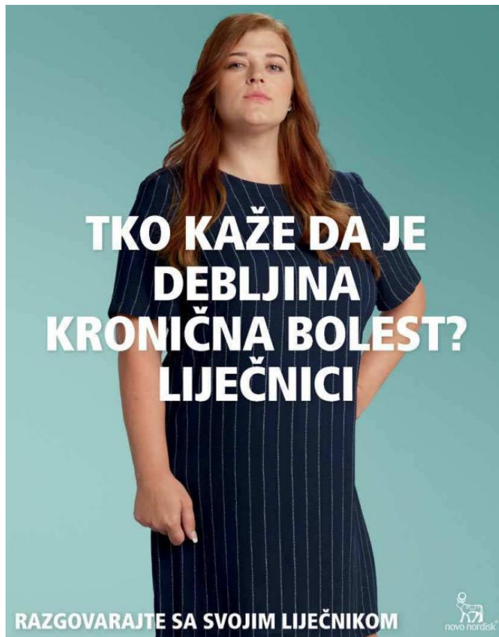
Slika 9. Reklama za farmaceutsku kompaniju Novo Nordisk ( Gloria , prosinac 2021., broj 1406)

Zašto u ovoj reklami nije prikazan muškarac? Ovakve reklame također učvršćuju stereotipe jer, prikazujući samo ženske modele, dovode do pogrešnog zaključka kako prvenstveno žene moraju brinuti o svome izgledu, biti mršave, vitke i privlačne, dok za muškarce višak kilograma nije preveliki problem. U reklamnom videu povodom svjetskog dana debljine koji je također objavio Novo Nordisk , prikazane su isključivo pretilе žene 13 . U starijem broju Glorije također je pronađena reklama koja promovira proizvod za mršavljenje. Taj je proizvod namijenjen isključivo ženama: