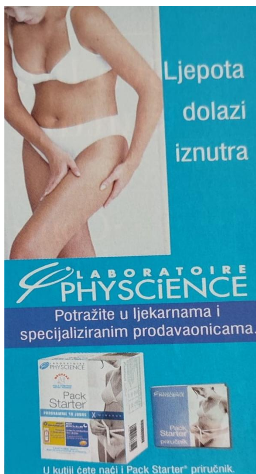
Slika 10. Reklama za 10-dnevni program mršavljenja ( Gloria , svibanj 2006., broj 50)

U ovoj su reklami opisana dva proizvoda: Pack starter za pripremu tijela za mršavljenje te Pack cellulite za izlučivanje masnoće. Na fotografiji je prikazana žena u donjem rublju koja njeguje svoje tijelo. Zanimljivo je kako niti u jednom proizvodu za mršavljenje nije prikazan muškarac, što nam ponovo govori kako prvenstveno žene moraju brinuti o svojim kilogramima, o celulitu, masnoći i izgledu općenito. Sve do sada prikazane reklame učvršćuju stereotipe vezane za fizički izgled žena: jedna je od njihovih najvažnijih uloga da uvijek brinu o svome tijelu, fizičkome izgledu, kilogramima, masnim naslagama, kosi, licu i da zauvijek ostanu mladolike i privlačne.