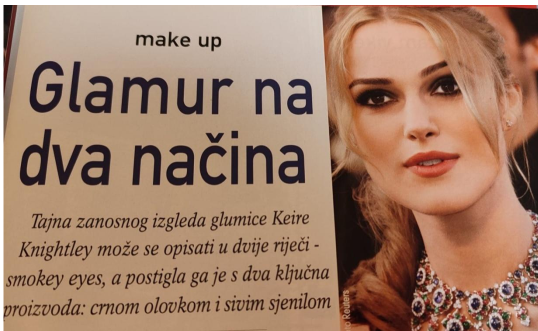
Slika 1. Reklama za kozmetičke proizvode ( Gloria , ožujak 2006., broj 41)

U ovoj se Glorijinoj reklami promoviraju kozmetički proizvodi koje koristi i slavna glumica Keira Knightley. Reklama se proteže kroz cijelu stranicu, a ispod prikazane slike izloženi su spomenuti ključni proizvodi: olovka za oči i sjenilo te cijeli dodatni komplet proizvoda: olovka za obrve, ruž za usne, tekući puder i MaxFactor maskara koje također koristi poznata glumica. Naravno, osnovni cilj reklame jest privući kupce kod kojih se javlja divljenje prema prekrasnoj, savršeno našminkanoj glumici i njezinim zavidnim crtama lica. Dio rečenice koji posebno privlači našu pažnju jest tajna zanosnog izgleda , odnosno sintagma zanosni izgled . Zašto bi izgled trebao biti zanosan i koga bi trebao zanimati ? Žene mogu težiti ljepoti same zbog sebe i zbog osobnog užitka, no ova se reklama može shvatiti i u smislu privlačenja muškaraca. Osim toga, ovakve reklame mogu imati i negativne posljedice koje smo spomenuli u poglavlju 6.1. Rečeno je da reklame vrlo često promoviraju nedostižnu ljepotu i različitim računalnim programima kreiraju nestvaran izgled. Ukoliko pomnije promotrimo prikazanu fotografiju, vidjet ćemo da na prekrasnoj glumici ne postoji niti jedna nesavršenost, što vrlo teško postižu i najbolji profesionalni kozmetičari. Tako, primjerice, Knightley ima madež iznad desne obrve, no on je na ovoj fotografiji u potpunosti uklonjen ili je prekriven njezinom kosom. Glumica je prvenstveno prikazana kako bi zaplijenila pažnju korisnica i