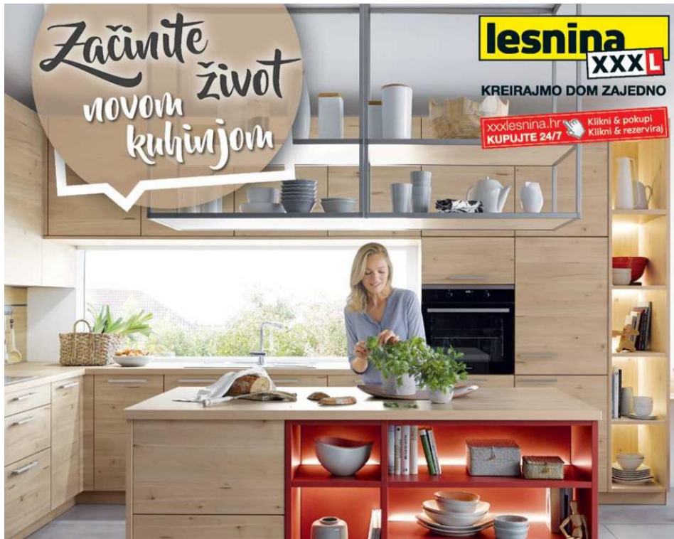
Slika 17. Reklama za kuhinju u Lesnini ( Gloria , travanj 2022., broj 1423)

vrijeme u takvim reklamama sve više sudjeluju i muškarci. Oni nisu u potpunosti preuzeli ulogu „domaćice“, no sve ih češće viđamo u društvu žene koja priprema ručak ili u krugu obitelji. Bez obzira na to što se broj muškaraca u takvim reklamama povećao, još uvijek nalazimo velik broj reklama koji tradicionalno smješta žene u njihovo „pravo“ okružje, pa se takvi primjeri mogu pronaći i u novijem broju časopisa: