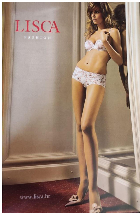
Slika 7. Reklama za novu kolekciju marke Lisca ( Gloria , srpanj 2006., broj 61)

reklame u kojima su žene prikazane gotovo ili potpuno gole, osim kada je riječ o reklamiranju donjeg rublja. U nastavku će biti prikazane dvije reklame koje prikazuju donje rublje, jedna s početka stoljeća i jedna iz novijeg broja Glorije . U tim su reklamama također pojavljuju mlade, atraktivne, vitke, možemo reći savršene žene, čime se samo potvrđuju stereotipi: