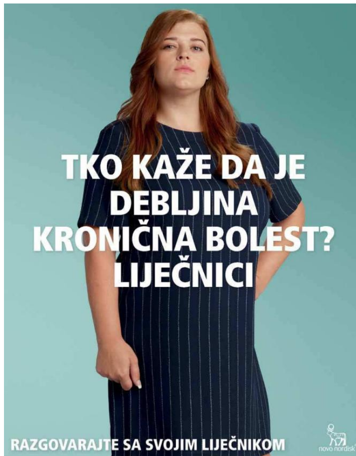
Slika 9. Reklama za farmaceutsku kompaniju Novo Nordisk ( Gloria , prosinac 2021., broj 1406)

Zašto u ovoj reklami nije prikazan muškarac? Ovakve reklame također učvršćuju stereotipe jer, prikazujući samo ženske modele, dovode do pogrešnog zaključka kako prvenstveno žene moraju brinuti o svome izgledu, biti mršave, vitke i privlačne, dok za muškarce višak kilograma nije preveliki problem. U reklamnom videu povodom svjetskog dana debljine koji je također objavio Novo Nordisk , prikazane su isključivo pretilе žene 13 . U starijem broju Glorije također je pronađena reklama koja promovira proizvod za mršavljenje. Taj je proizvod namijenjen isključivo ženama: