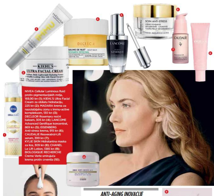
Slika 3. Reklama za kozmetičke proizvode ( Gloria , ožujak 2021., broj 1365)

Za stariju populaciju vrlo se često reklamiraju proizvodi protiv starenja, što ženama daje do znanja da uvijek moraju biti mladolike i „odgađati“ starost. Za ovakve se proizvode također vrlo često koriste reklame u kojima se prikazuju slavne glumice, plijeneći pozornost svojom zapanjujućom mladolikošću. Takav je primjer pronađen u novijem broju Glorije :