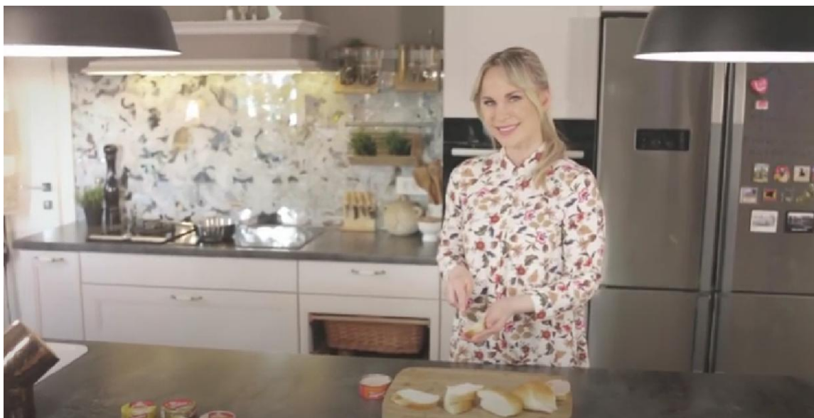
Slika 19. Reklama za Gavrilović paštete (2018.) 15

svojoj obitelji i pritom ističe kako je kuhanje za nju oduvijek bilo užitak. U sljedećoj sceni zadovoljno promatra svoje nećake koji uživaju u posluženoj hrani. Navodi kako nakon ručka i dječje igre posvuda ostaju mrlje te kako je njezin recept za čistoću Faks Helizim . U reklami vidimo više tradicionalnih ženskih uloga: kuhanje, spremanje, čišćenje i pranje rublja. Pritom se niti u jednom trenutku u ne pojavljuje muškarac koji bi ženi pomogao u kućanskim poslovima. Žena je prvo prikazana u pregači, a potom u udobnoj odjeći koja nam daje do znanja riječ o kućanici. U sljedećoj reklami također vidimo žensku osobu koja sprema ručak, no riječ je o novijoj reklami pa je njezin stil odijevanja i fizički izgled znatno drugačiji od prethodne: