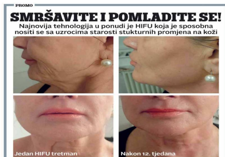
Slika 4. Reklama za tretman pomlađivanja HIFU ( Gloria , ožujak 2021., broj 1365)

pedesetim godinama života, pa je glumica odabrana s razlogom – kada je reklama objavljena, glumica je imala 49 godina. Winslet se proslavila u filmu Titanic kao mlada djevojka, što znači da ju danas vrlo dobro poznaju sve generacije. Pored fotografije navedeni su proizvodi koje žene trebaju koristiti kako bi zadržale svoju mladolikost te izgledale poput Winslet. U centru reklame nalazi se fotografija na kojoj je glumica slikana iz profila – osnovni je cilj bio prikazati njezino zategnuto lice bez bora i nepravilnosti. Ovakve reklame također mogu izazvati nezadovoljstvo kod žena koje ne uspijevaju zadržati željenu mladolikost, pa one često posežu za reklamiranim anti-ageing proizvodima. Ovaj bismo primjer mogli povezati i sa spomenutom manipulacijskom moći medija: reklamirani proizvodi ne bi plijenili pozornost da uz njihovu reklamu nije prikazana fotografija poznate glumice. Iako nigdje nije navedeno da glumica koristi navedene proizvode, jer novinari to najvjerojatnije nisu mogli provjeriti, čitatelji ih automatski povezuju s osobom na fotografiji. Upravo je iz tog razloga pomno odabrano što će se u reklami prikazati: fotografija prekrasne slavne glumice pred pedesetim godinama života. Koliko je važno za ženu da uvijek ostane mlada i lijepa, govori nam i sljedeća reklama: