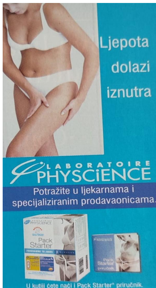
Slika 10. Reklama za 10-dnevni program mršavljenja ( Gloria , svibanj 2006., broj 50)

U ovoj su reklami opisana dva proizvoda: Pack starter za pripremu tijela za mršavljenje te Pack cellulite za izlučivanje masnoće. Na fotografiji je prikazana žena u donjem rublju koja njeguje svoje tijelo. Zanimljivo je kako niti u jednom proizvodu za mršavljenje nije prikazan muškarac, što nam ponovo govori kako prvenstveno žene moraju brinuti o svojim kilogramima, o celulitu, masnoći i izgledu općenito. Sve do sada prikazane reklame učvršćuju stereotipe vezane za fizički izgled žena: jedna je od njihovih najvažnijih uloga da uvijek brinu o svome tijelu, fizičkome izgledu, kilogramima, masnim naslagama, kosi, licu i da zauvijek ostanu mladolike i privlačne.