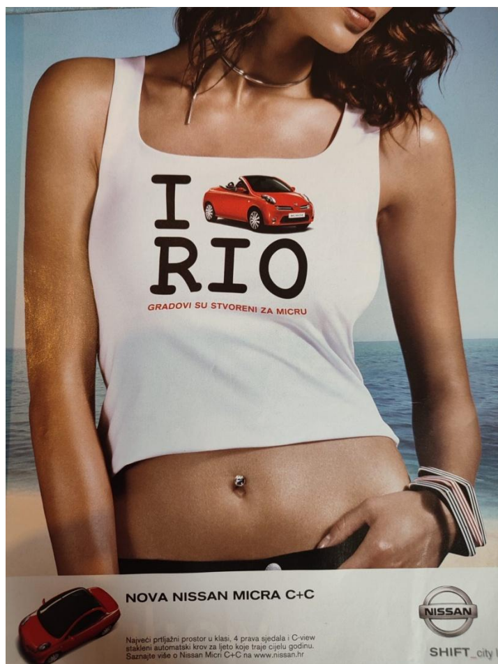
Slika 11. Reklama za novu Nissan Micru ( Gloria , ožujak 2006., broj 41)

Ova se reklama proteže kroz cijelu stranicu časopisa, a automobil je prikazan na majici koju nosi atraktivna, vitka i mlada djevojka. Majica je kratka, zavodljiva, a otkriva i piercing na pupku. Riječ je o kabrioletu stvorenom za ljetne dane pa je model smješten na plaži. Zavodljivo žensko tijelo služi kako bi privuklo muškarce na kupnju ovog automobila. Osim toga, u reklami je zastupljen još jedan stereotip: žene će uvijek odabrati dobrostojećeg muškarca koji si može priuštiti najnovije skupocjene proizvode. Može se zaključiti kako je žensko tijelo ovdje objektivizirano: uz zavodljivu ženu svaki će proizvod izgledati bolje i privlačnije, bilo da je riječ o automobilima, gumama ili garažnim vratima. U ovoj reklami žensko tijelo ima dekorativnu funkciju, ono služi kao ukrasni predmet, a muškarcima poručuje da će nakon kupnje nove Nissan Micre biti poželjniji. Sličnu zavodljivost vidimo i u reklami za sladoled King :