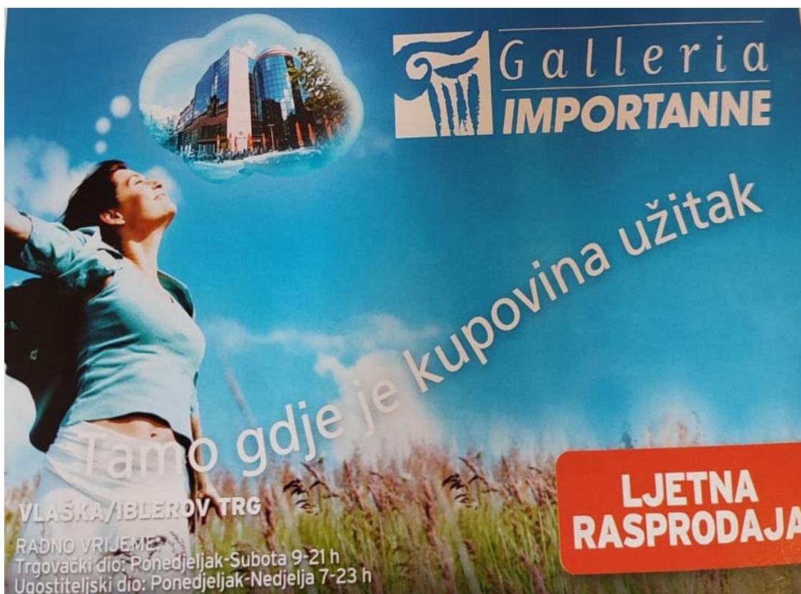
Slika 13. Reklama za trgovački centar Galleria Importanne ( Gloria , kolovoz 2006., broj 62)

Fotografija prikazuje reklamu za ljetnu rasprodaju u zagrebačkom trgovačkom centru Galleria Importanne . Na slici je prikaza žena koja uživa u šetnji prirodom, a pritom razmišlja o ljetnim popustima u omiljenom centru gdje je kupovina užitak . Na ženi vidimo ushićenje, sreću i osmijeh koje izaziva sama pomisao na kupovinu. Ona sanjari o odlasku u trgovački centar i uživa u tome. Šetnja prirodom i uživanje u ljetnom povjetarcu moglo bi se povezati s onim osjećajima koje kod žena izaziva kupnja. Ustaljena je misao kako su muškarci oni koji zarađuju, a žene te koje troše novac provodeći veliku količinu vremena u trgovinama. To možda i jest točno u nekim slučajevima, no žene zasigurno nisu jedine koje uživaju u kupovini – veliki broj muškaraca provede istu ili veću količinu vremena kupujući proizvode i šetajući po trgovačkim centrima. Nas ovdje zanimaju stereotipi, a opće je poznato da će se za pojam kupovine gotovo uvijek prvenstveno vezati žene, posebice jer su one te koje bi trebale nabavljati namirnice i brinuti o kuhinji i domu. Reklame znatno učvršćuju ove stereotipe: