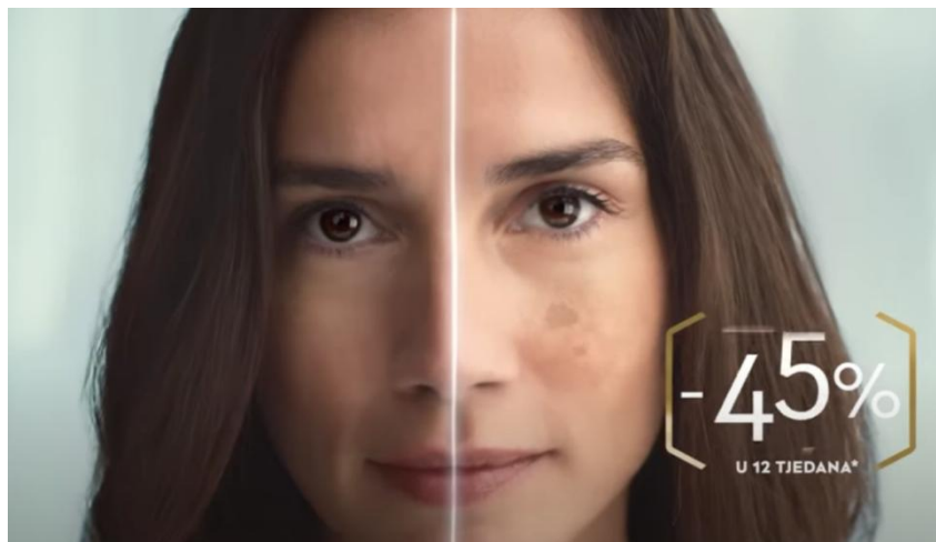
Slika 22. Reklama za Nivea Cellular Luminous serum protiv mrlja (2022.) 18

Da žene uvijek moraju biti lijepe, uredne, privlačne i zavodljive dale su naslutiti reklame iz časopisa Gloria . Istu poruku šalju i mnoge televizijske reklame za njegu lica i kože te različite kozmetičke proizvode. U kojoj se mjeri ženama nameće ideal ljepote i savršenosti pokazuje nam reklama za Nivein serum protiv mrlja na koži: