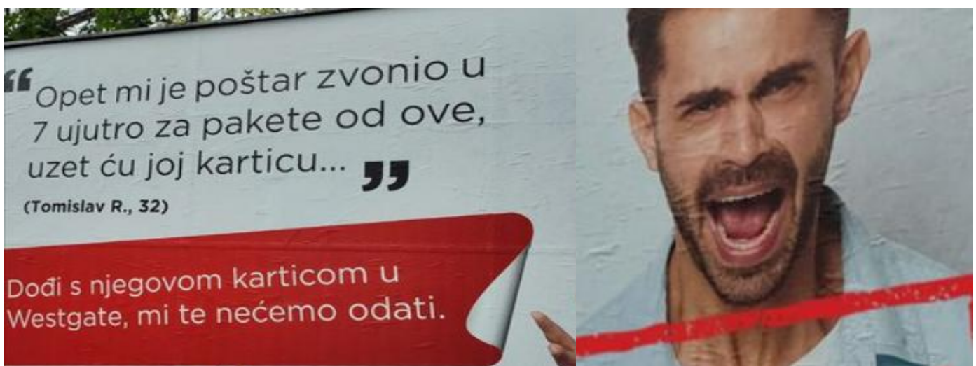
Slika 25. Reklama za trgovački centar Westgate (2023.)

Još jedan problematični reklamni pano pojavio se 2023. godine, a reklamira zagrebački trgovački centar Westgate :