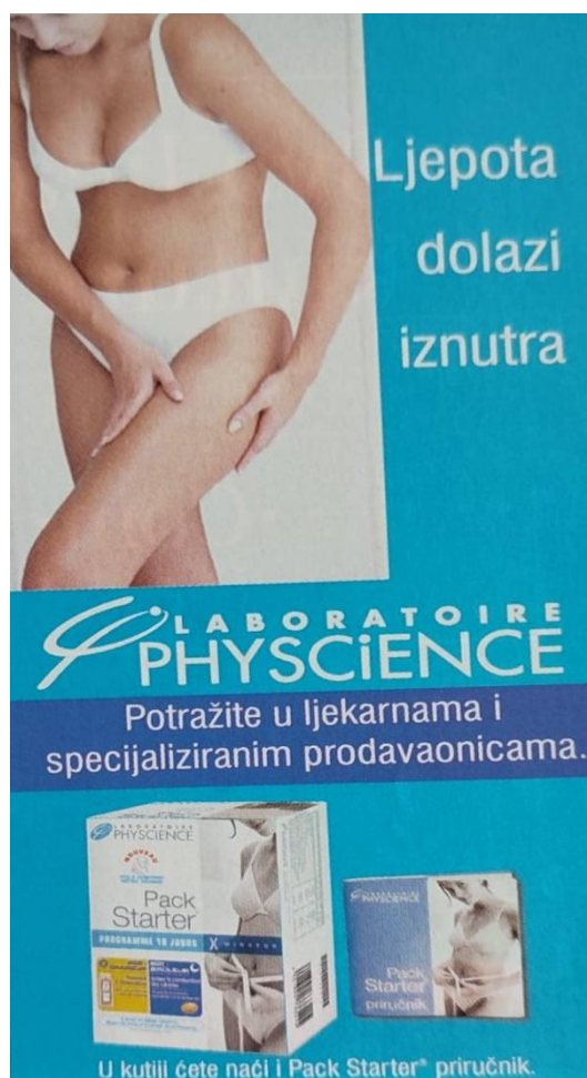
Slika 10. Reklama za 10-dnevni program mršavljenja ( Gloria , svibanj 2006., broj 50)

U ovoj su reklami opisana dva proizvoda: Pack starter za pripremu tijela za mršavljenje te Pack cellulite za izlučivanje masnoće. Na fotografiji je prikazana žena u donjem rublju koja njeguje svoje tijelo. Zanimljivo je kako niti u jednom proizvodu za mršavljenje nije prikazan muškarac, što nam ponovo govori kako prvenstveno žene moraju brinuti o svojim kilogramima, o celulitu, masnoći i izgledu općenito. Sve do sada prikazane reklame učvršćuju stereotipe vezane za fizički izgled žena: jedna je od njihovih najvažnijih uloga da uvijek brinu o svome tijelu, fizičkome izgledu, kilogramima, masnim naslagama, kosi, licu i da zauvijek ostanu mladolike i privlačne.